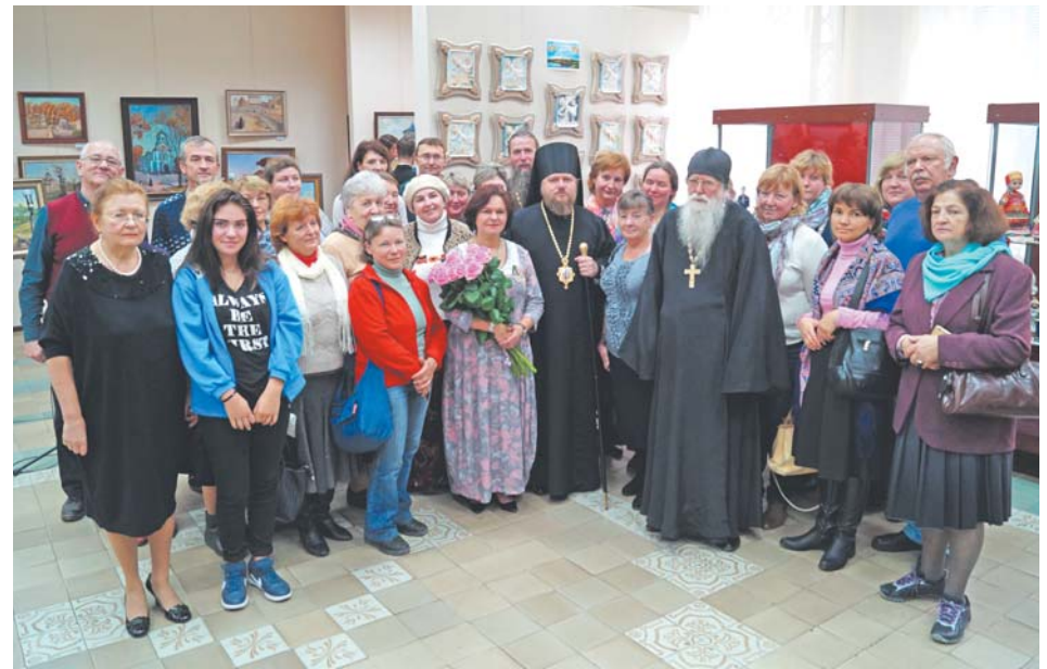
Прихожане Свято-Духовского храма в с. Шкинью Коломенского района на закрытии выставки в МУК «Музейно-выставочный центр», г. Боровск