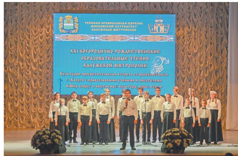
Ансамбль мальчиков и юношей Калужской филармонии и ансамбль «Тихоновский ручеёк» Свято-Тихоновой пустыни