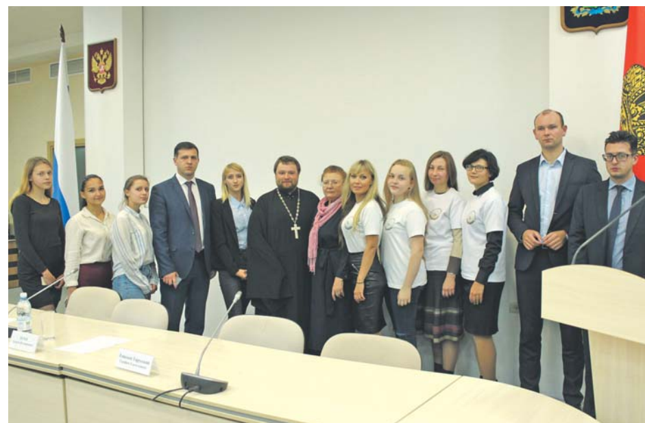
Памятное фото в Доме Правительства Калужской области