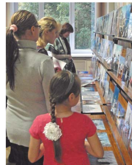
Знакомство с выставкой «Возрождённые святыни»