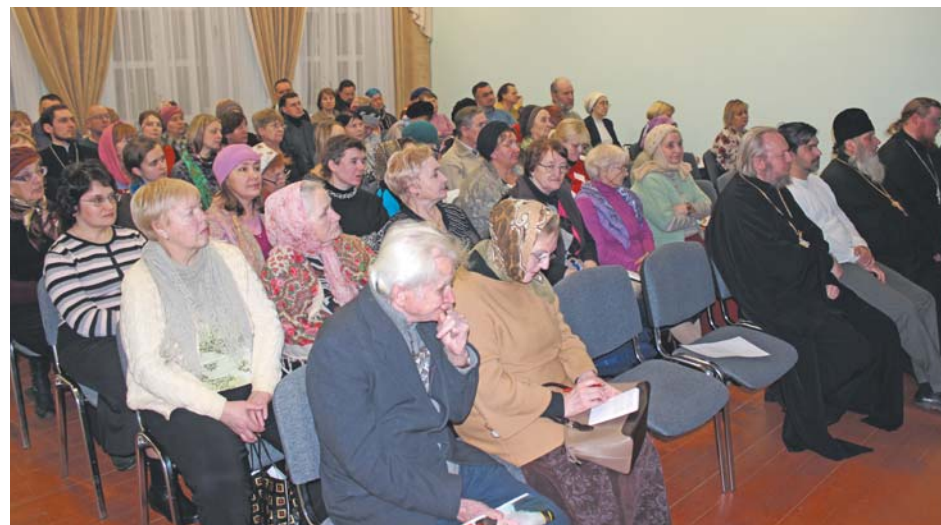
Вечер памяти Царственных страстотерпцев. Духовно-просветительский центр «Успенский», г. Калуга