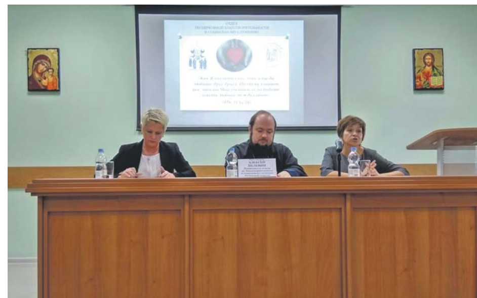
Заседание круглого стола «Организация межведомственного взаимодействия в вопросах социального служения»