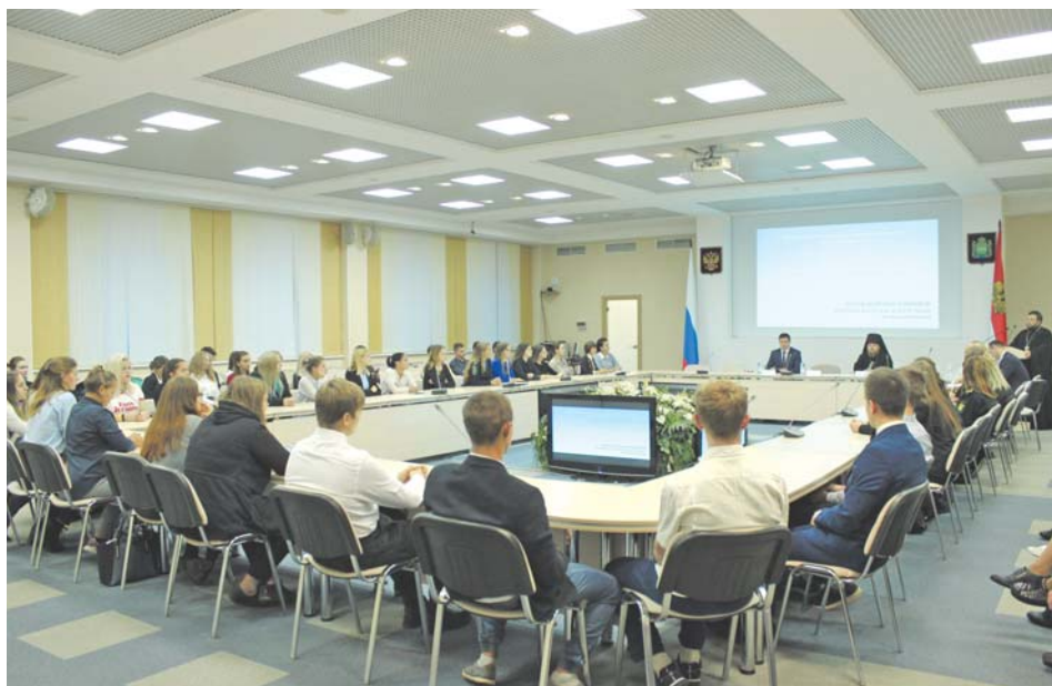
Заседание круглого стола «Пути развития добровольческого служения на стыке двух мировоззрений: светского и православного»