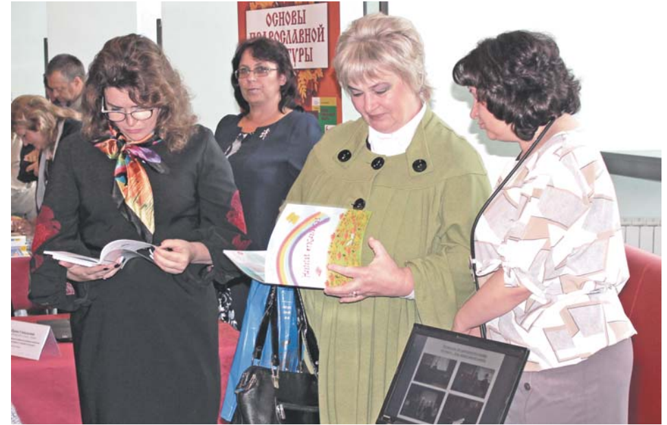
Знакомство с работами Всероссийского конкурса «За нравственный подвиг учителя». Фойе Калужской областной филармонии