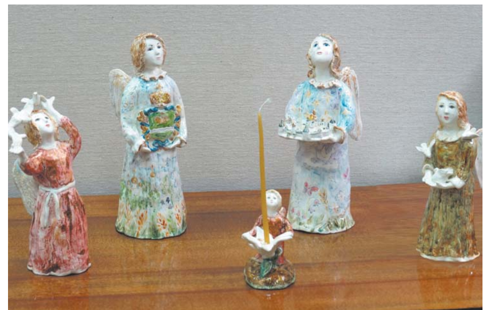
Авторские работы, подаренные на закрытии II Передвижной персональной выставки «Сохраним красоту Божьего мира»