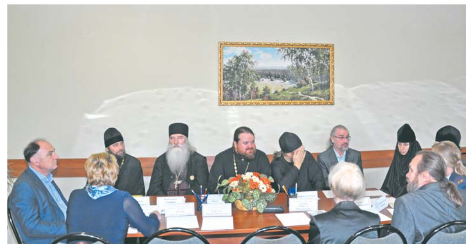
Заседание круглого стола «Свобода и ответственность»