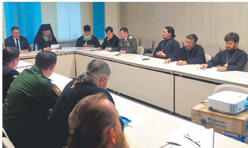
Дом Правительства Калужской области. Заседание круглого стола «Взаимодействие Церкви с силовыми структурами»