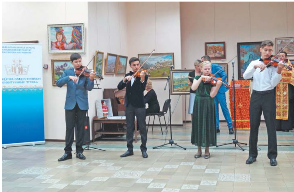
Музыкальный подарок участникам выставки от ансамбля скрипачей МОУ ДО «Балабановская детская школа искусств»