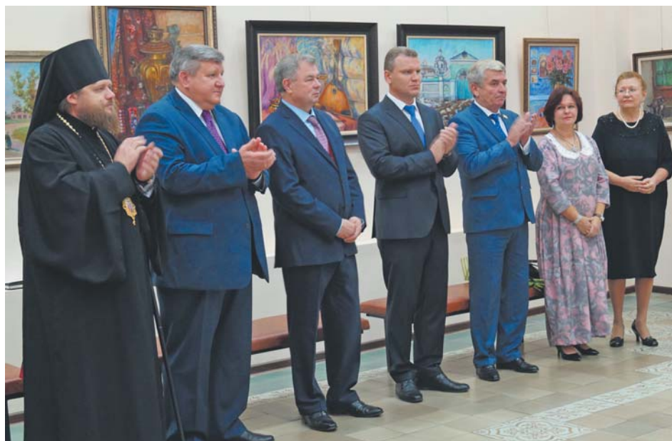
Почётные гости благодарят детский ансамбль скрипачей