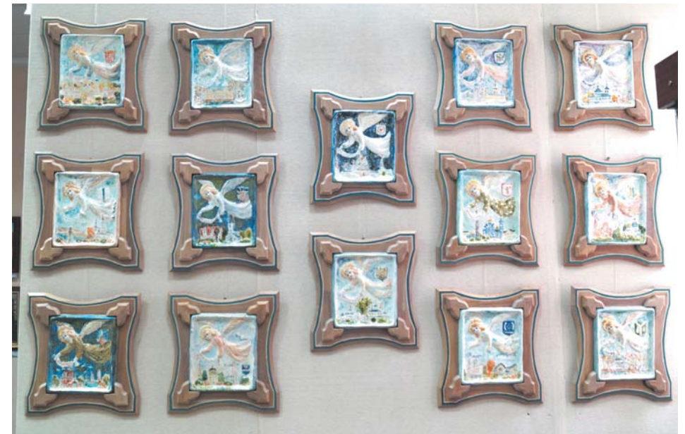
Экспозиция произведений из фаянса «Ангелы над землёй Калужской»