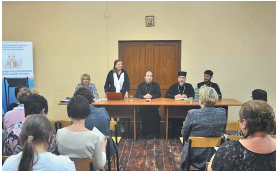
Муниципальные координаторы преподавания «Основ православной культуры» в актовом зале Православного молодёжного центра Калужской епархии «Златоуст»