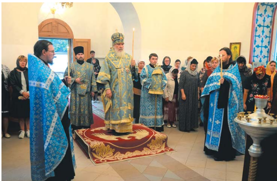
Всенощное бдение с литией совершает митрополит Калужский и Боровский Климент