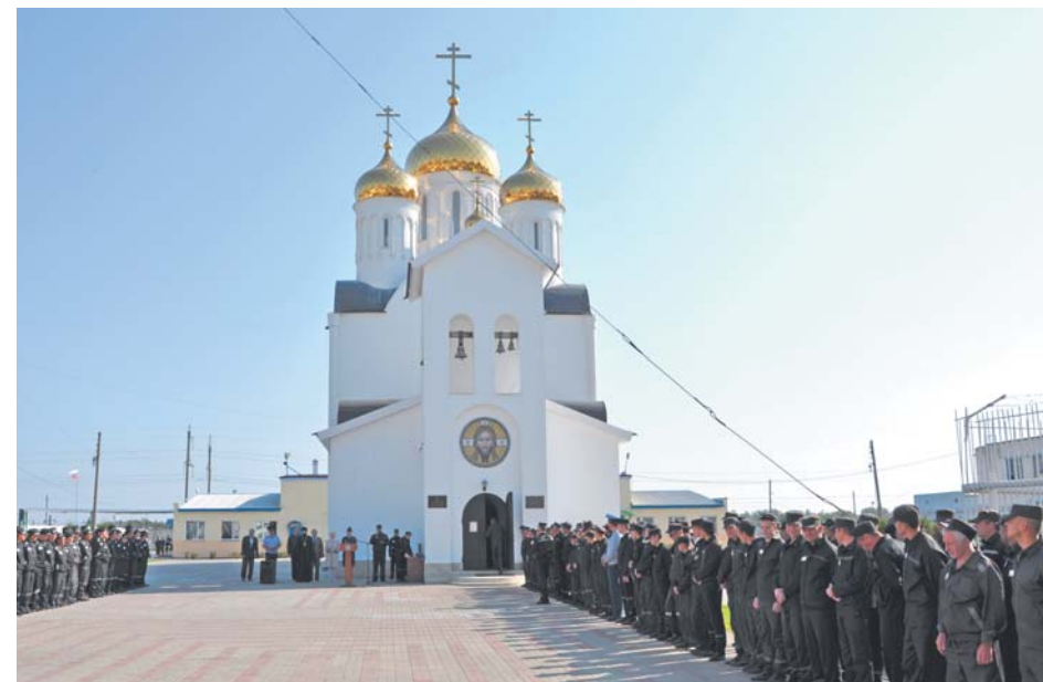
Храм в честь Всех святых, в земле Российской просиявших