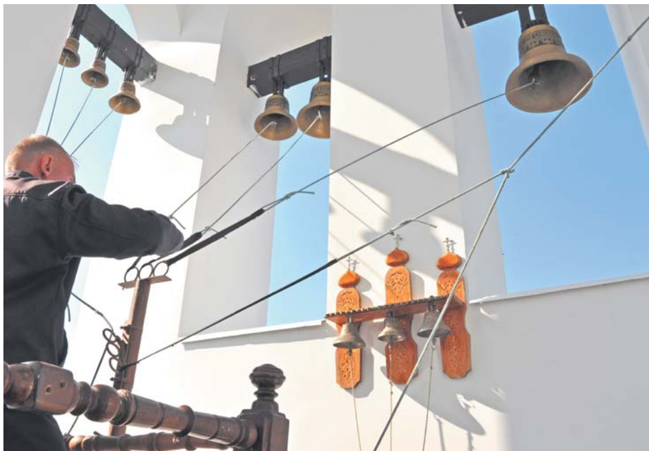
«Калужская звонница» – конкурс звонарей тюремных храмов