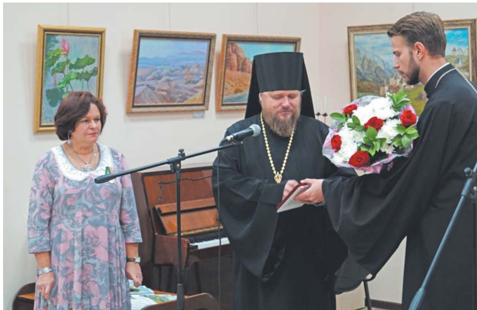
Епископ Тарусский Серафим вручает автору выставки медаль Преподобного Тихона Калужского II степени