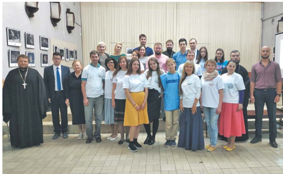
Расширенное заседание Молодёжного совета при администрации муниципального района «Боровский район»