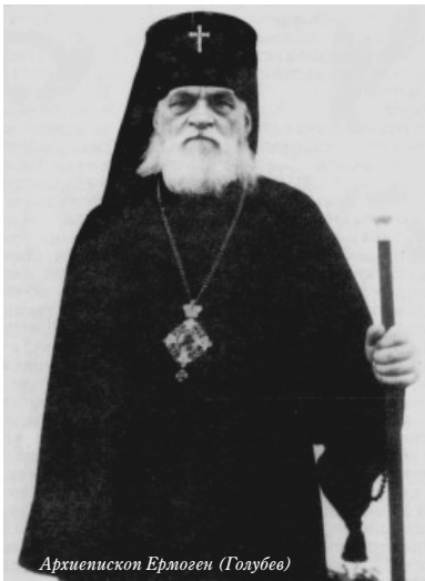
Архиепископ Ермоген (Голубев)

Чтобы обойти запрет на колокольный звон, он установил колокола в алтаре Свято-Георгиевского собора, и там во время богослужения и после звонили колокола. Казалось бы, небольшая деталь, но это вселяло бодрость в сердца верующих людей, укрепляло их дух в те тяжелые времена.