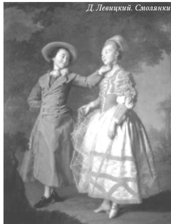
Д. Левицкий. Смоленск

Эти вопросы встают перед каждым, кто всерьез решает направить свою жизнь по Святоотеческому пути, стать православным не формально, а реально, вступить на сложный и тесный путь настоящей духовной жизни.