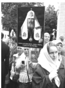
Молебен на Соборной площади Киева 27 июля 2008 г.