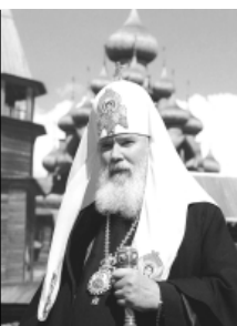
Святейший Патриарх в Киргизии