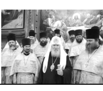
Патриаршее служение в день памяти святителя Филарета Московского 2 декабря 2008 г.