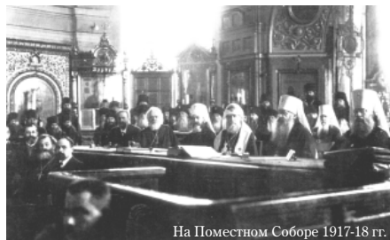
На Поместном Соборе 1917-18 гг.

Этот вопрос, каким должен быть состав Собора, об участии в нем мирян очень сильно будоражил общественность перед созывом Поместного Собора Русской Православной Церкви 1917 года. В печати очень много появлялось мис-