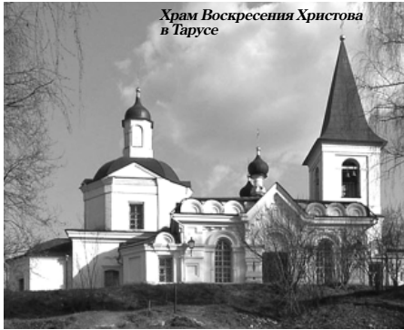
Храм Воскресения Христова в Тарусе

Если точнее, это был день второго, если не третьего, рождения. Потому что само место на Воскресенской горе, где стоит храм имеет древнейшую историю. Когда-то в шестнадцатом веке здесь находился мужской монастырь с деревянной Воскресенской церковью. Через