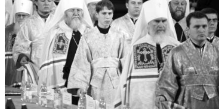
На Поместном Соборе

2. От имени всей Полноты церковной Поместный Собор воздает должное трудам приснопамятного Святейшего Патриарха Московского и всея Руси Алексия II, по благословению и под руководством которого совершалось церковное возрождение в течение более чем восемнадцати лет. Собор призывает всех пастырей и чад церковных неlessly молиться о упокоении души почившего Первосвятителя и хранить о нем благодарную память.