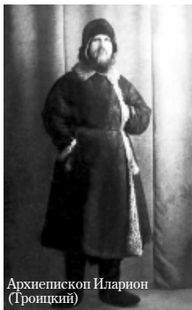
Архиепископ Иларион (Троицкий)