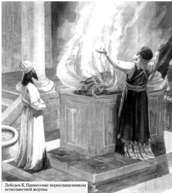
Лебедев К. Принесение первосвященником ветхозаветной жертвы

– Дело в том, что в Богочеловеке Христе соединяется божественное и человеческое естество, поэтому человеческое естество исцеляется во Христе. В тропаре читается: «во гробе плотски, во аде же с душею, яко Бог, в раи же с разбойником и на престоле был, Христе, со Отцем и Духом...». Ведь человеческая природа смертью разбивается на тело и душу. Душа Христа во аде проповедует прежде умерших и выводит их, а тело – «во гробе плотски». Христос – Богочеловек, то есть у Него божественное и человеческое естество соединены неслитно и нераздельно. И в момент смерти Его душа и тело, разрываясь между собою, оставались соединенными с божественной природой. Поэтому по естеству своему они должны опять соединиться. Они и соединяются во Христе и Господь воскресает. Невозможно было держать во аде Начальника