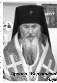
Архиеп. Берлинский Марк