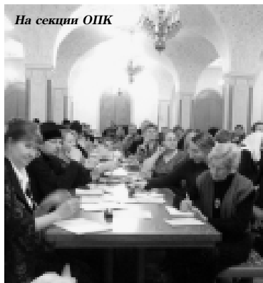
На секции ОПК

не значит атеистическое, а значит только то, что оно не подчинено церковной власти, не финансируется из церковного бюджета.