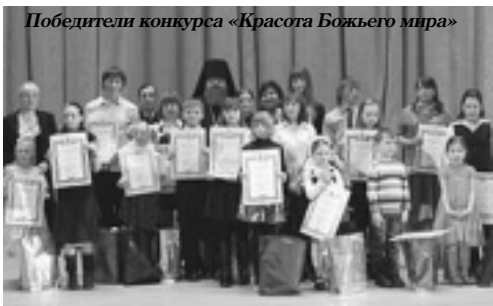
Победители конкурса «Красота Божьего мира»