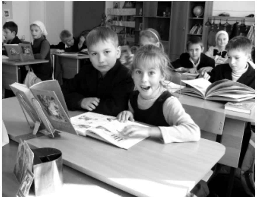
На уроке Закона Божия в Православной гимназии г. Калуги