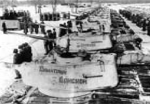
Танковая колонна им. Дмитрия Донского

ха Украины митрополита Николая (Ярушевича). На этой встрече Сталин дал согласие на созыв Поместного собора и избрание патриарха, на открытие новых церквей и учебных заведений.