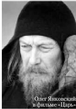
Олег Янковский в фильме «Царь»