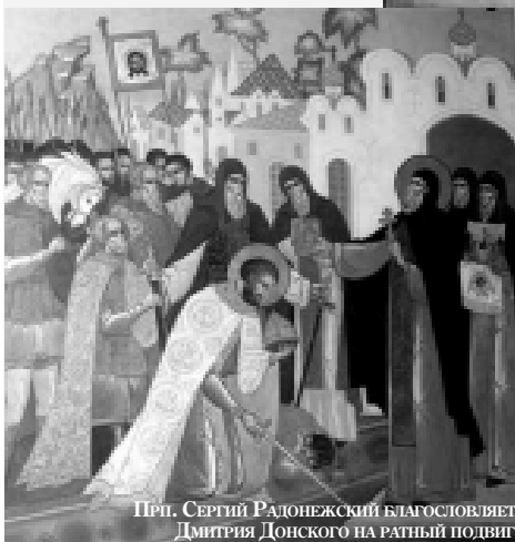
Прп. Сергий Радонежский благословляет Дмитрия Донского на ратный подвиг

Если кому, то именно нам нужно помнить заповедь Христову: «Нет больше той любви, как если кто положит душу свою за друзей своих». Душу свою полагает не только тот, кто будет убит на поле сражения за свой народ и его благо, но и всякий, кто жертвует собой, своим здоровьем или выгодой ради родины. Нам, пастырям Церкви, в такое время, когда отечество призывает всех на подвиг, недостойно будет лишь молчаливо посматривать на то, что кругом делается, малодушно-го не ободрить, огорченного не утешить, колеблющемуся не напомнить о долге и о воле Божией. А если, сверх того, молчаливость пастыря, его некасательство к переживаемому паствой объяснится еще и лукавыми соображениями насчет возможных выгод на той стороне границы, то это будет прямая измена родине и своему пастырскому долгу, поскольку Церкви нужен пастырь, несущий свою службу истинно «ради Иисуса, а не ради хлеба куса», как выражался свт. Димитрий Ростовский. Положим же души свои вместе с нашей паствой. Путем самоотвержения шли неисчислимые тысячи наших православных воинов, полагавших жизнь свою за родину и веру во все времена наше- ствий врагов на нашу родину. Они умирали, не думая о славе, они думали только о том, что родине нужна жертва с их стороны, и смиренно жертвовали всем и самой жизнью своей.