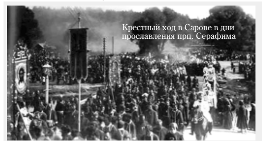
Крестный ход в Сарове в дни прославления прп. Серафима

1 августа (19 июля по ст. ст.) наша Церковь отмечает Первое (1903 г.) и второе (1991 г.) обретение мощей одного из величайших русских святых – преп. Серафима САРОВСКОГО. Инициатором прославления прп. Серафима был Государь Николай II. А с жизнью святого старца Серафима его познал архимандрит Серафим (Чичагов).