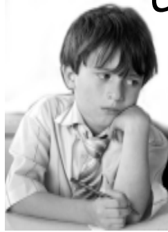
Тема: знание и понимание ребенка

Ребёнок одарен от природы, у него сильная потребность расти и развиваться, он умеет и хочет учиться; он упорен, сосредоточен, очарован миром; он непосредствен и эмоционален; он ищет нашего сочувствия и одновременно защищается от непонимания и грубого вторжения в его мир. Успех нашей миссии как родителей очень зависит от того, насколько мы понимаем и учитываем природу детей. Описание их потребностей, мотивов их поведения, эмоций и переживаний, их внутреннего мира посвящено несколько глав книги.