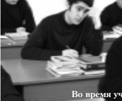
Во время учёбы