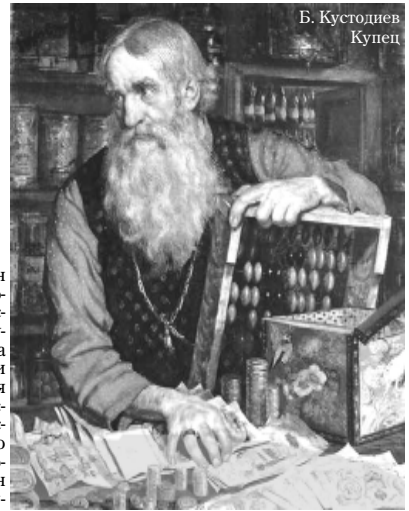
Б. Кустодиев Купец

Но, когда отношение к деньгам неправильное, они становятся злом. И стоит сказать, что в особую группу риска входят дети богатых родителей. Ещё не научившись зарабатывать и ценить деньги, они приучаются легко и бездумно их тратить. Можно собрать печальную статистику, сколько хорошо обеспеченных детей стали алкоголиками, наркоманами, у скольких не сложилась карьера и семейная жизнь. Кстати, понимая это и желая детям счастья и благополучия, некоторые русские