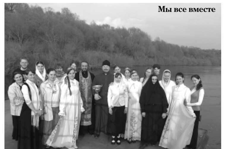
Мы все вместе