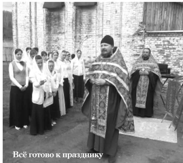
Всё готово к празднику

Обвинит ли кто этих мужичков в том, что им даже то невдомёк, что шапки во время