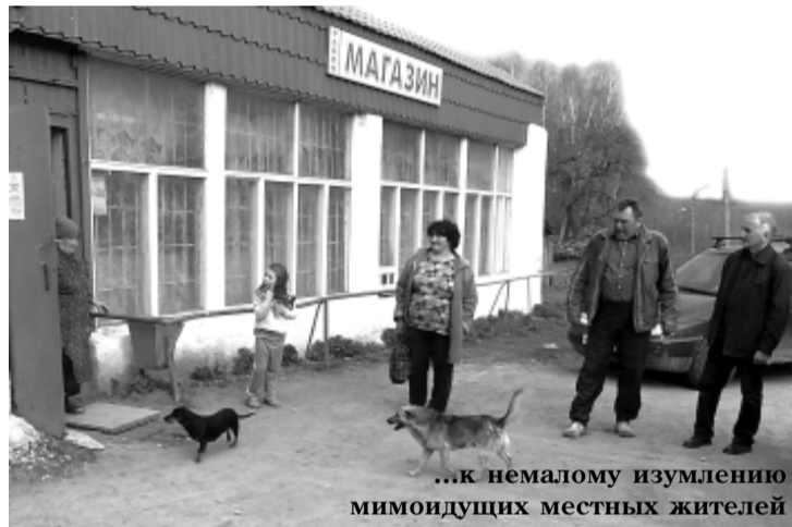
...к немалому изумлению мимоидущих местных жителей