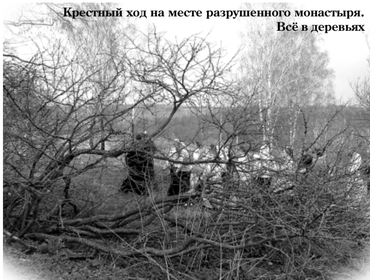
Крестный ход на месте разрушенного монастыря. Всё в деревьях

лась центром Православия на излучине Оки, а ныне здесь не сохранилось ни единого храма.