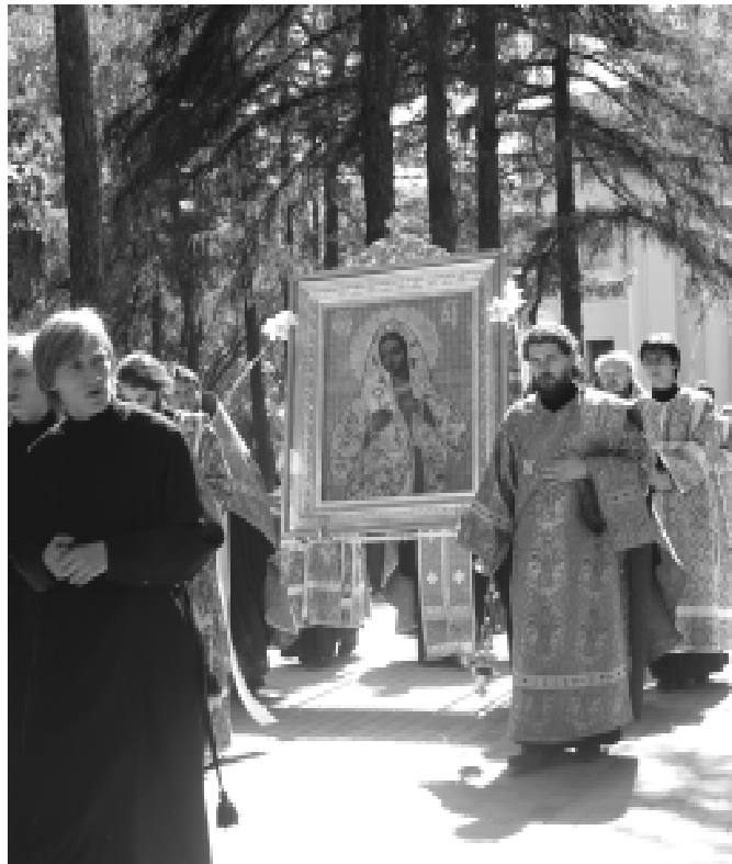
После молебна в Свято-Троицком кафедральном соборе 11 июля начинается Крестный ход по Калужской земле

С 11 по 30 июля в Калужской епархии пройдёт Крестный ход с чудотворной Калужской иконой Божией Матери