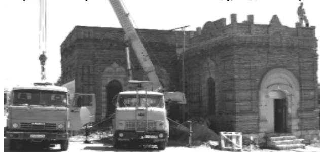
Ремонт храма Святого благоверного князя Александра Невского

Телефон для справок: 8-910-525-15-42 Запись на экскурсию в храме Василия Блаженного.