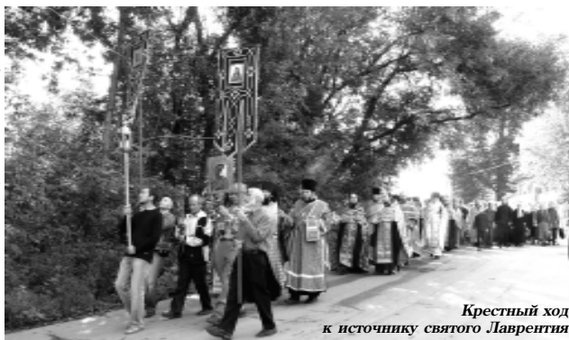
Крестный ход к источнику святого Лаврентия

– 23 августа – день памяти святого блаженного Лаврентия – престольный праздник нашей обите-