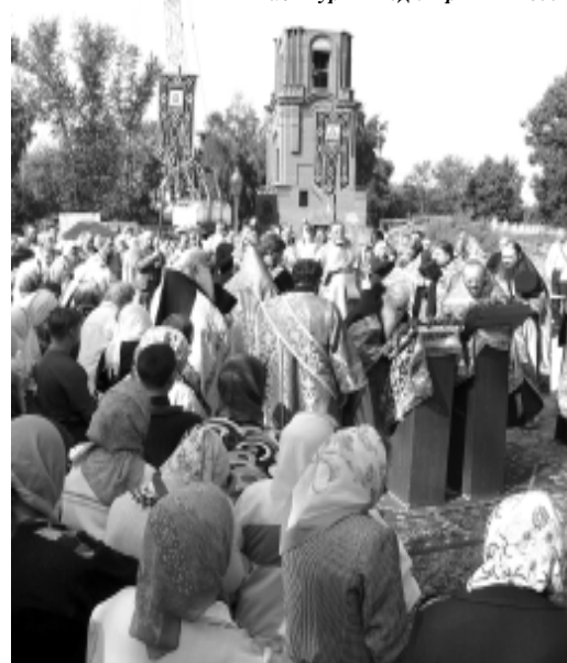
На Литургии под открытым небом

чтобы скрывать от людей свои добродетели и молитвы, он добродетельно подвизался, он прокопал подземный ход от своей кельи до храма и на молитвы и службы пробирался этим подземным ходом.