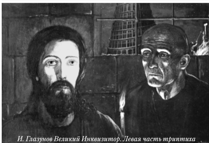
И. Глазунов Великий Инквизитор. Левая часть триптиха

Тогда оставляет Его диавол, и се, Ангелы приступили и служили Ему. (Евангелие от Матфея, гл. 4, 3-11)