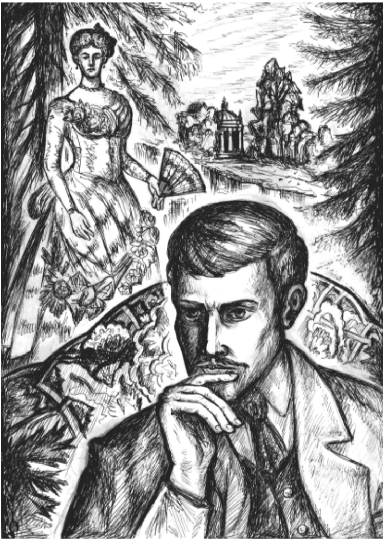
Рисунок Фёдора СТУКОВА

ческом аскетическом языке это состояние называется унынием. Когда пытаешься заполнить жизнь чем угодно, самыми благодетельными, на первый взгляд, делами, только бы не заниматься тем единственно важным делом, которое, ты знаешь, ты обязан в этот день и час делать.