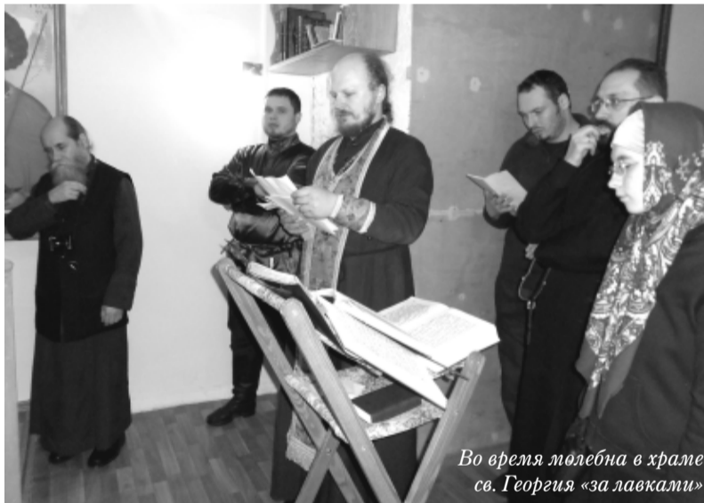
Во время молебна в храме св. Георгия «за лавками»

- Многие люди, которые давно ходят в церковь, успели привыкнуть к «партесу», многоголосному аккордовому пению. Для них переход к знаменному пению - это ломка. Не в обиду будет сказано, но люди неблагополучной жизни: наркоманы, алкоголики, но души кающиеся, лучше воспринимают древнее литургическое пение. Святитель Игнатий (Брянчанинов) писал, что знаменное пение близко душе именно кающегося человека. Но вообще успех введения знаменного пения может зависеть и от отношений настоятеля с приходом. Если они построены на взаимопонимании и доверии, то какое-то время люди потерпят переход и перестроятся.