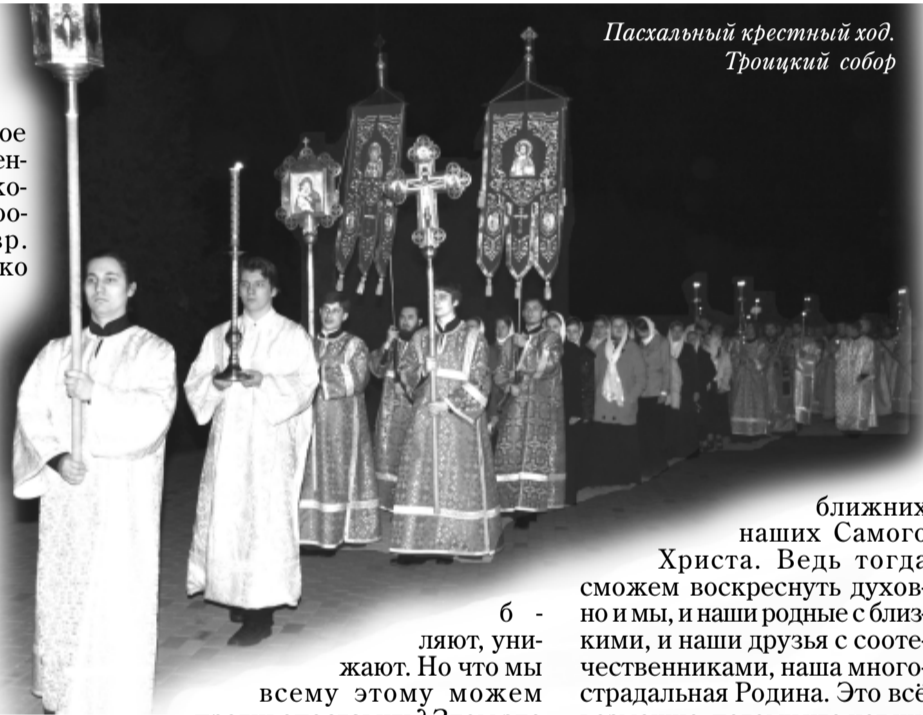
Пасхальный крестный ход. Троицкий собор

В этот великий Праздник Пасхи будем прославлять Воскресшего Бога не только словами, но и делами, видя в