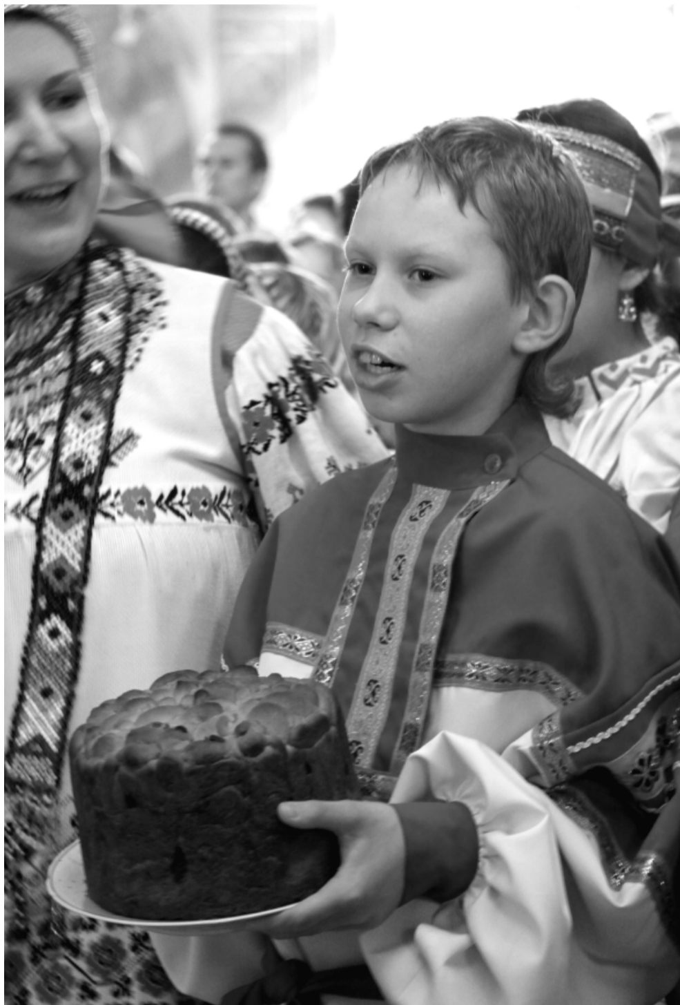
На Пасху в Троицком соборе