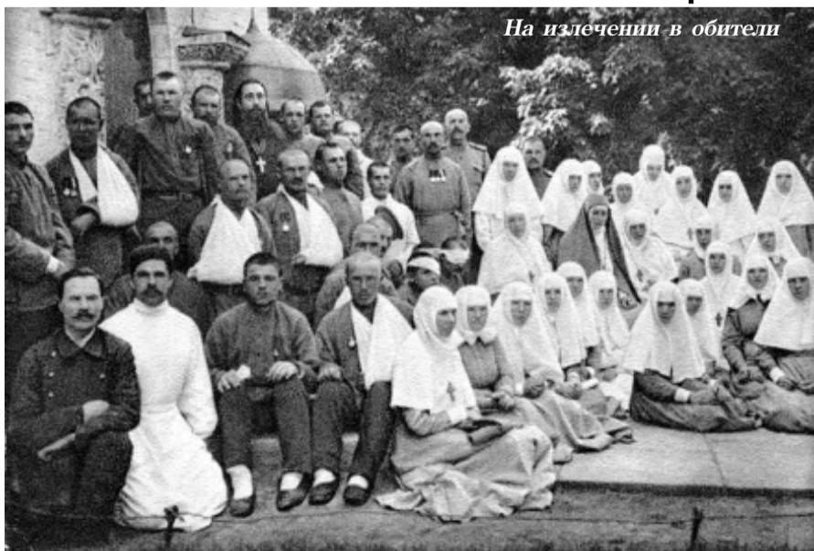
На излечении в обители

Отрешившись почти от всего земного, она тем ярче светилась исходящим от неё внутренним светом и особенно своей любовью и лаской. Не будучи монахиней в собственном смысле этого слова, она лучше каждой инокини блюла великий завет святого Нила Синайского: «Блажен инок, который всякого человека почитает как бы богом после Бога».