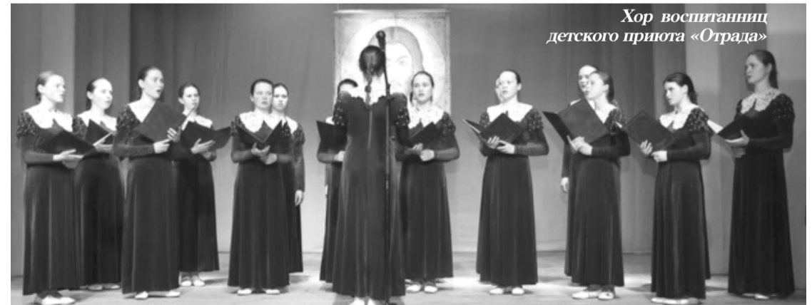
Хор воспитанниц детского приюта «Отрада»