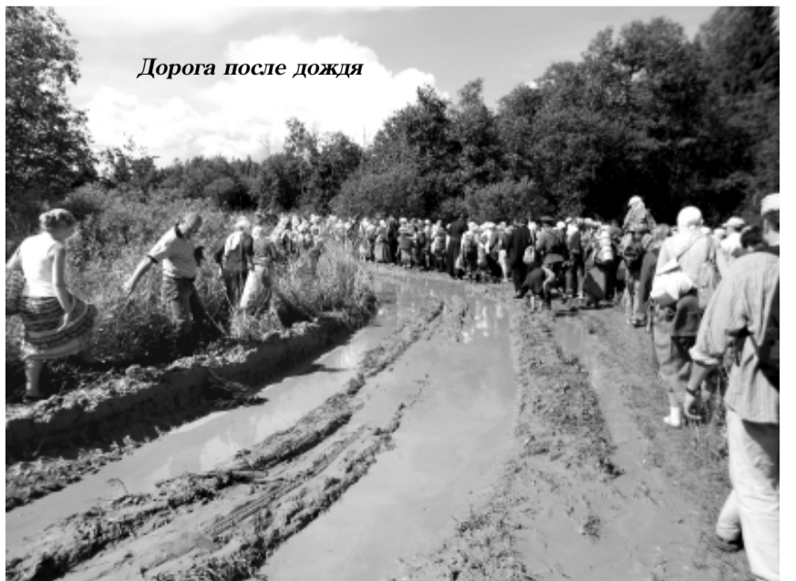
Дорога после дождя