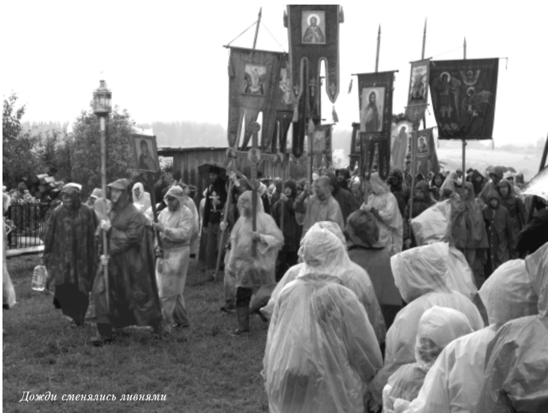
Дожди сменялись ливнями

Но в конечном итоге эти дожди оказались благом.