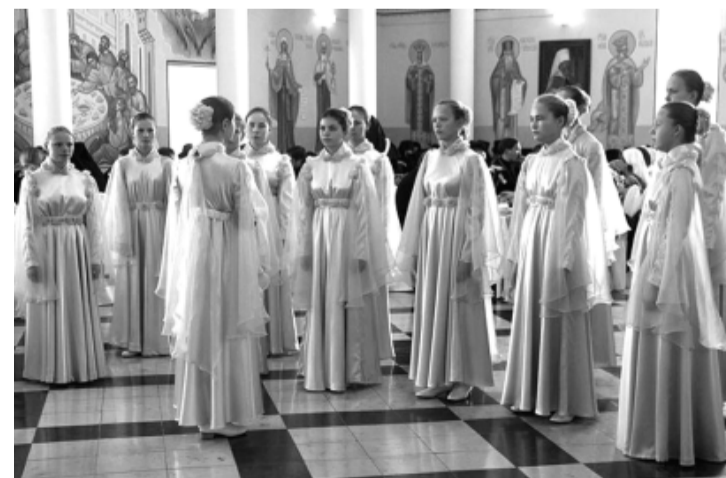
Во время концерта

По окончании Литургии был совершён благодарственный молебен Господу Богу. Архиереи и духовенство благодарили Бога о всех Его «милостях и щед-