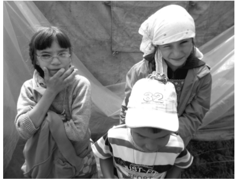
На привале дети приручали лягушку

Почему же в остальные дни жизни мы вполне обходимся без молитвы, не считая ул-