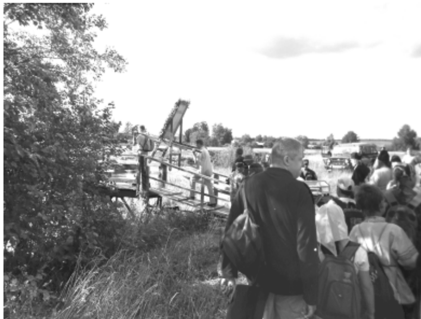
Тот самый раскачивающийся мостик

После её «спасибо» задумалась: почти невозможно в это поверить, но факт: придёт срок, и никого из нас на этой земле не будет. А потом придёт новый срок, и устройство души каждого откроется пред всеми. Все в своём чину станут, старики и младшие... Где обрящусь аз? Но пока ещё все мы идём по мостику. И