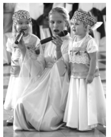
Поют дети приюта «Отрада»