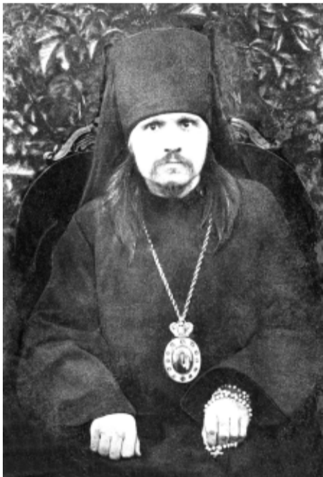
Священномученик Фаддей Тверской

Второе. У нас у всех в крови держится страх. Мы боимся сами себя. Автоцензура, самоцензура... Я боюсь лишнего сказать. Я боюсь сказать так, чтобы не подумали по-другому. Сталинская эпоха – это страшная эпоха, от которой остались следы не то, что неизгладимые, а генетические следы даже остались.