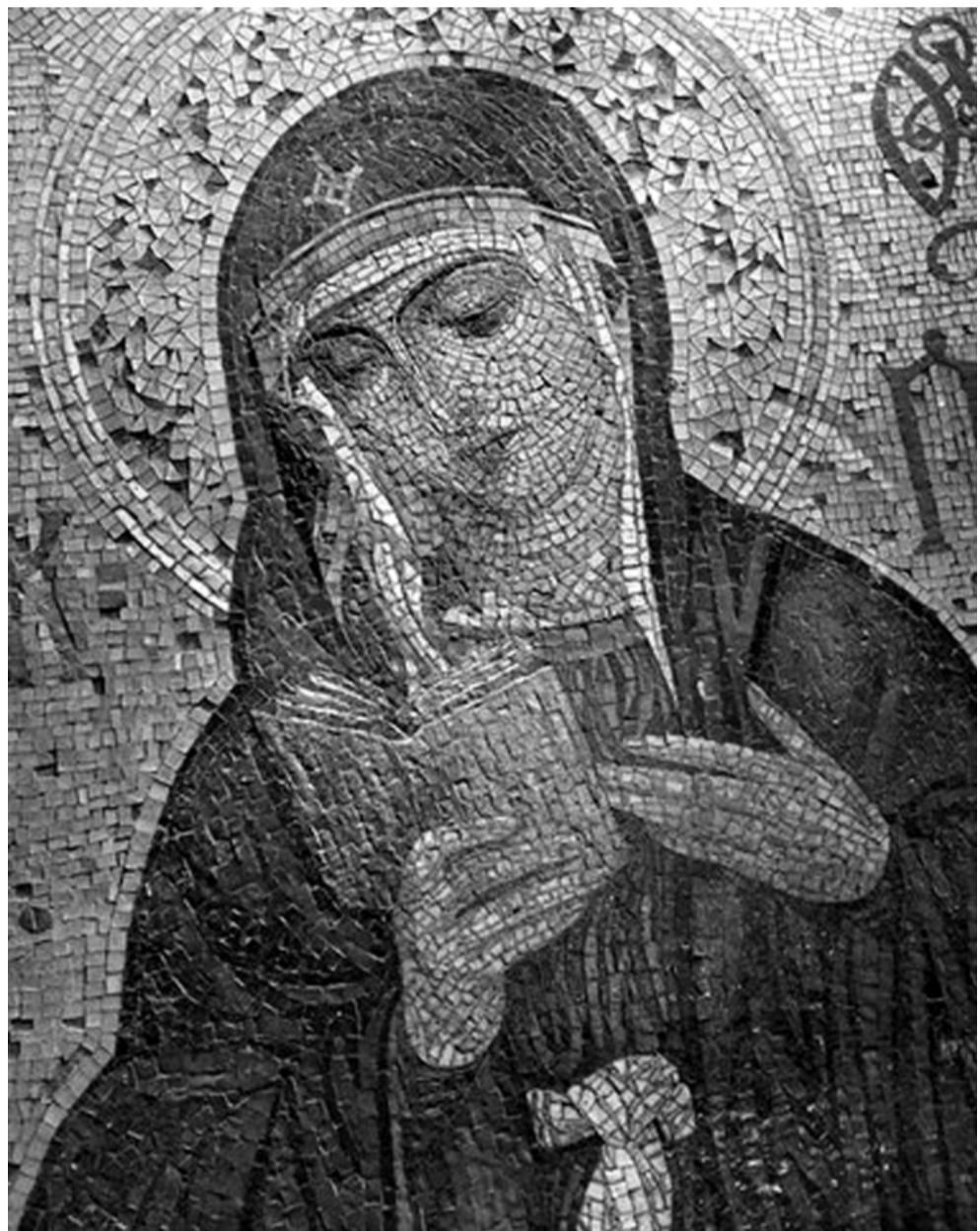
О подробностях, связанных с неожиданной находкой, читайте в фоторепортаже на стр. 2