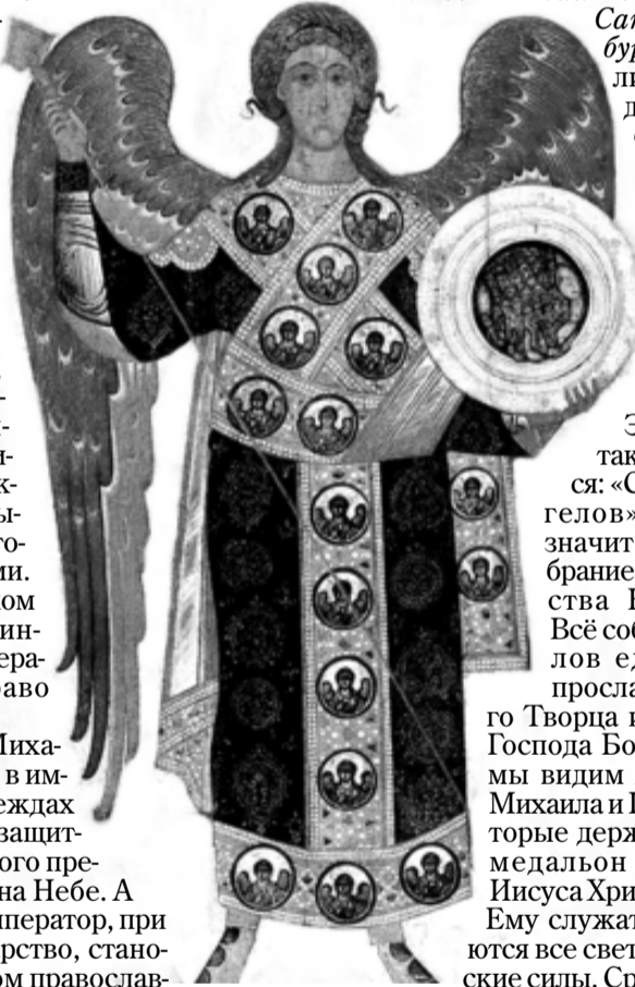
Архангел Михаил в императорских одеждах

В газете использованы материалы из православных интернет-ресурсов: www.patriarchia.ru , www.sedmitza.ru .