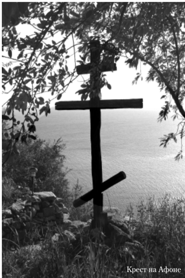
Крест на Афоне

– Нет. Господь действует так, как хочет в разных местах. В одних местах Он прославляет мощи святых нетлением, а в других, напротив, прославляет их истлением.