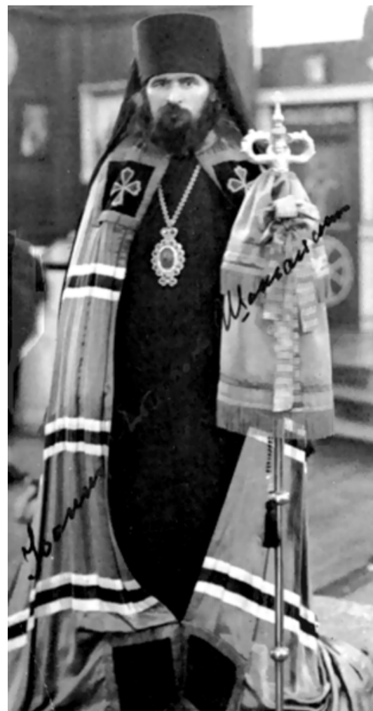
Епископ Иоанн по прибытии в Шанхай, 1934 г.

Дети, несмотря на обычную строгость владыки, были ему абсолютно преданы, а сам святитель подвизался за них перед Господом – так, когда во время войны в приюте не хватало продуктов для питания