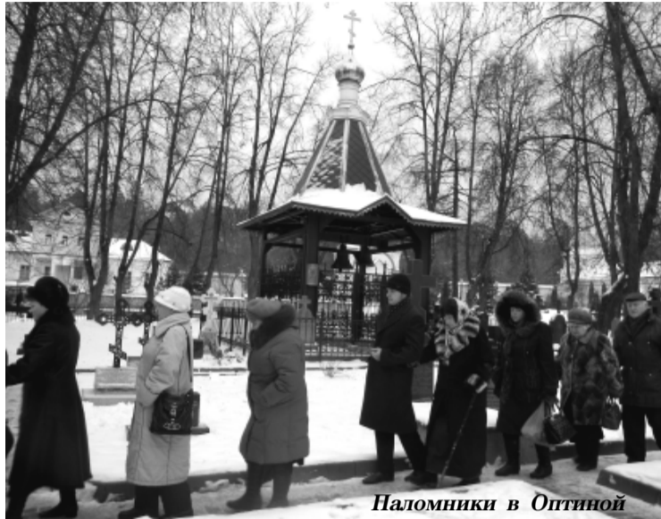
Паломники в Оптиной

В связи с этим председателю Нацкомиссии по вопросам защиты морали было направлено письмо с просьбой предпринять меры по исправлению ситуации.