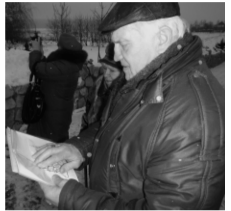
На фото: Наш паломник осматривает иконы и храмы «на ощупь» по специальной иллюстрации.

Во второй половине дня мы побывали у креста, установленного на месте бывшего Сергиева скита, скита, устроенного в начале XX века для тех, кто собирался отправиться в паломничество на Святую землю. Собственно Сергиев