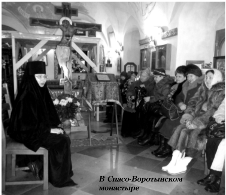
В Спасо-Воротынском монастыре

Марина УЛЫБЫШЕВА.