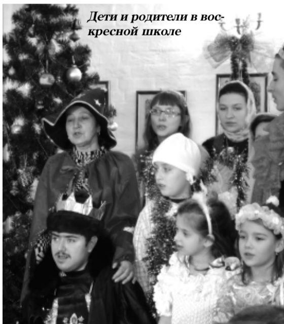
Дети и родители в воскресной школе

«Муромцево» и Калужской школы-интерната №2. Есть и храм в железнодорожной больнице, причём сёстры не только помогают там священнику при богослужении, но и пекут куличи для больных, раздают им подарки, устраивают для них концерты. А вспомнить организованный монахинями фестиваль детского творчества «Утра – Пояс Пресвятой Богородицы», в котором со своими рисунками, сочинениями, театральными номерами и песнями приняло участие более 1200 ребят!