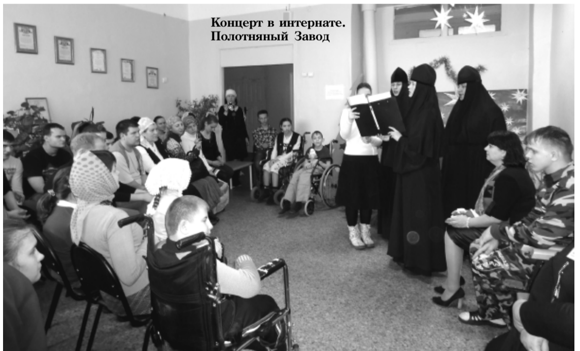
Концерт в интернате. Полотняный Завод

– Таких надо выслушать, понять, поддержать словами. Помню одну девушку, которая была тяжело больна, и её отвезли в больницу делать операцию. Несчастливая лежала в палате под конвоем. Тогда сёстры навестили её там в ту тяжёлую минуту, подняли ей дух. И девушка ожила: встав с больничной кровати, она стала ходить в храм. Так бывает со многими – в тюрьме они задумываются, переоценивают свои прежние ценности, начи-