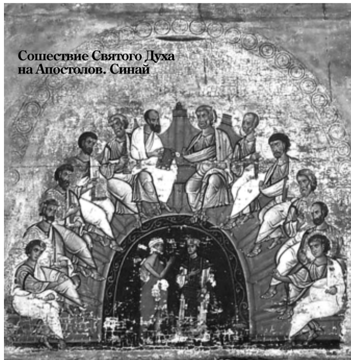
Сошествие Святого Духа на Апостолов. Синай

В XIV веке император и варвар уступают место образу «старца царя-Космоса», держащего в руках плат с двенадцатью свитками. Старец символизирует не Империю, и не какой-то конкретный народ, а весь мир – всю вселенную, принимающую слова Благовестия, которые и символизируются этими 12-ю свитками на плате. Позже идея «вселенского» характера Империи уже была изжита. Концепция политического универсализма, столь свойственная византийцам, ушла в небытие, но благодаря влиянию богословия исихастов на первый план вышла идея универсализма веры, подразумевавшая «кафолический» характер не какой-либо империи, но Православия. И возникновение в иконографии Пятидесятницы аллегории всего мира, внимающего апостольской проповеди, является частным подтверждением главных идей мировоззрения византийцев, стоящих за этим образом. Беседовала Юлия БЕЛКИНА.