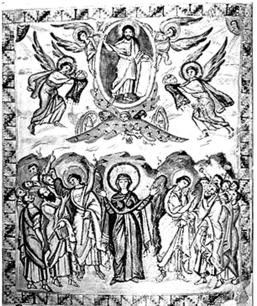
Миниатюра из «Евангелия Раввулы»