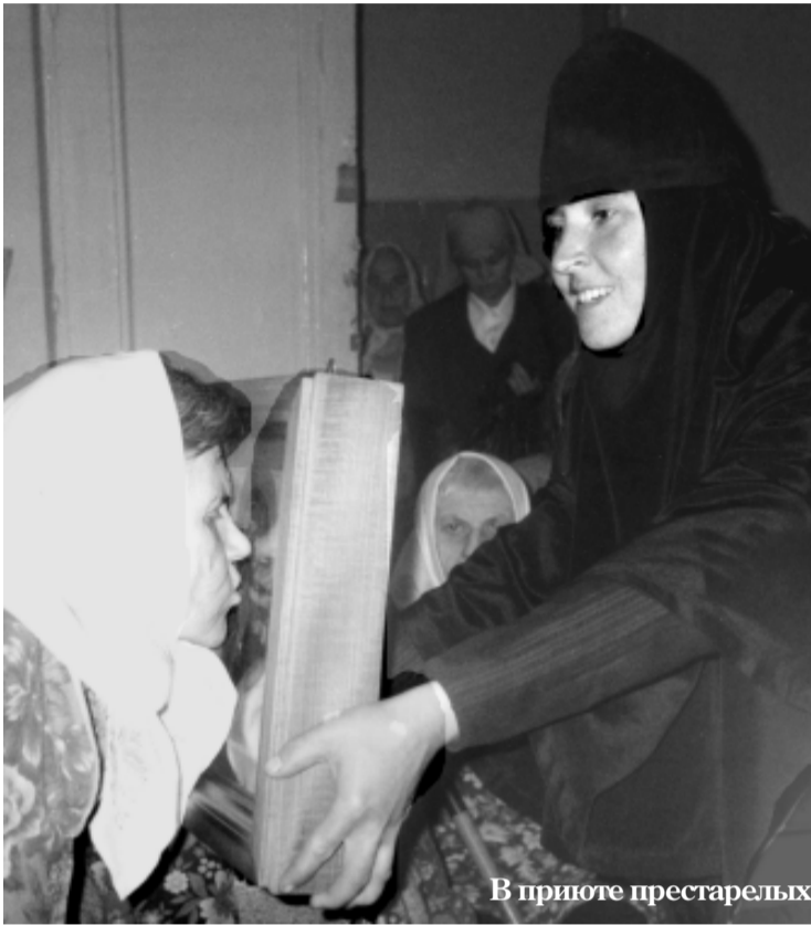
В приюте престарелых