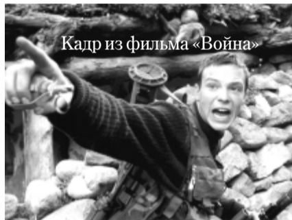
Кадр из фильма «Война»

Во всех историях рано или поздно наступает развязка. Наступила она и в «страшных мирах» Балабанова. Об этом – его фильм «Я тоже хочу», снятый режиссером, который уже знал о своей смертельной болезни. Алексей Балабанов понимал, что это его последняя работа, и в ней он как бы подвёл черту под делом своей жизни – вскрытии, выворачивании наружу темных сторон большой русской души.