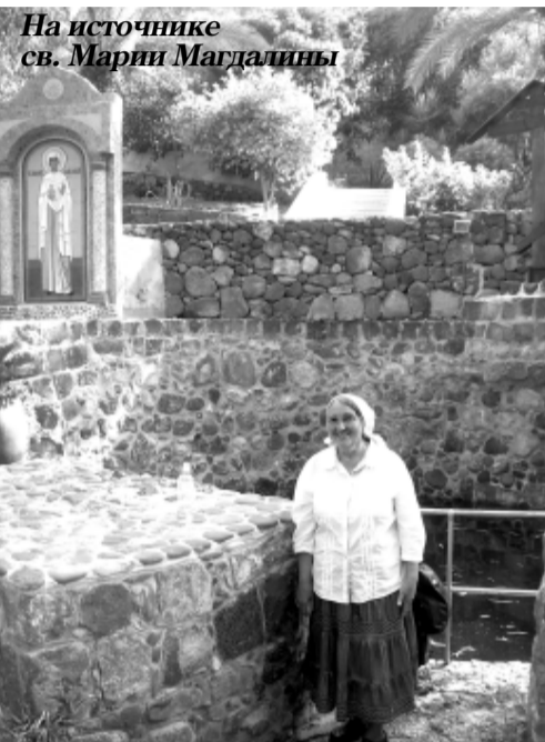
На источнике св. Марии Магдалины

– Я думаю, да. Хотелось бы. Потому что впереди ещё много работы. Беседовала Юлия БЕЛКИНА.