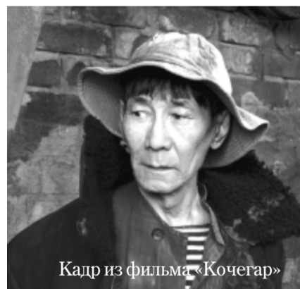
Кадр из фильма «Кочегар»

На фоне большинства остальных балабановских фильмов, построенных на сугубом мрачном реализме, «Я тоже хочу» сразу же привлёк моё внимание – в нём появляется мистика. Она воплощена в «Колокольне счастья», расположенной в заброшенном посёлке где-то между Петербургом и Угличем. В этом месте произошла непонятная