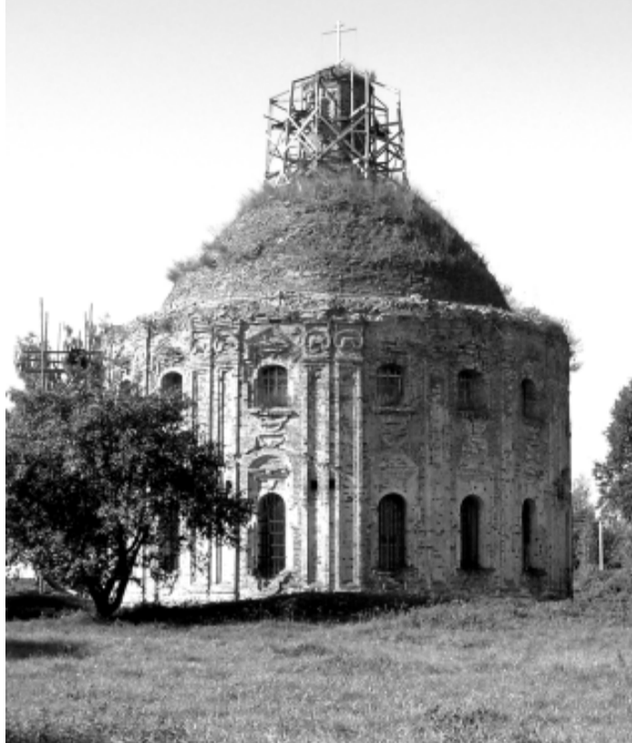
Храм святого Александра Невского в Мошонках