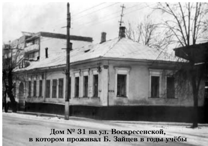
Дом № 31 на ул. Воскресенской, в котором проживал Б. Зайцев в годы учёбы

Но среди страшных воспоминаний, мирно, почти убаюкивающе звучали и другие слова: «Колокола звонят.