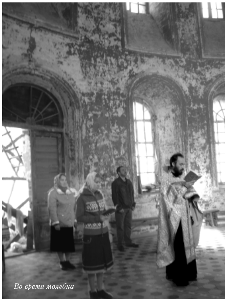
Во время молебна