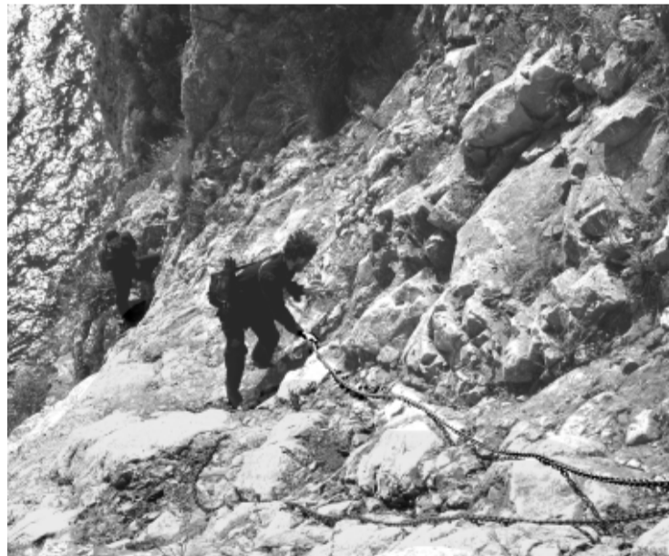
Разные способы передвижения по Афону

Подплываем к Пантелеимону монастырю, и я своим ребятами говорю: а что нас ждёт в Дафне? – Это следующая