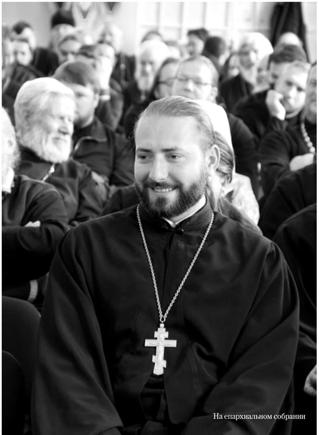
На епархиальном собрании

В Калужской области образованы три новые епархии