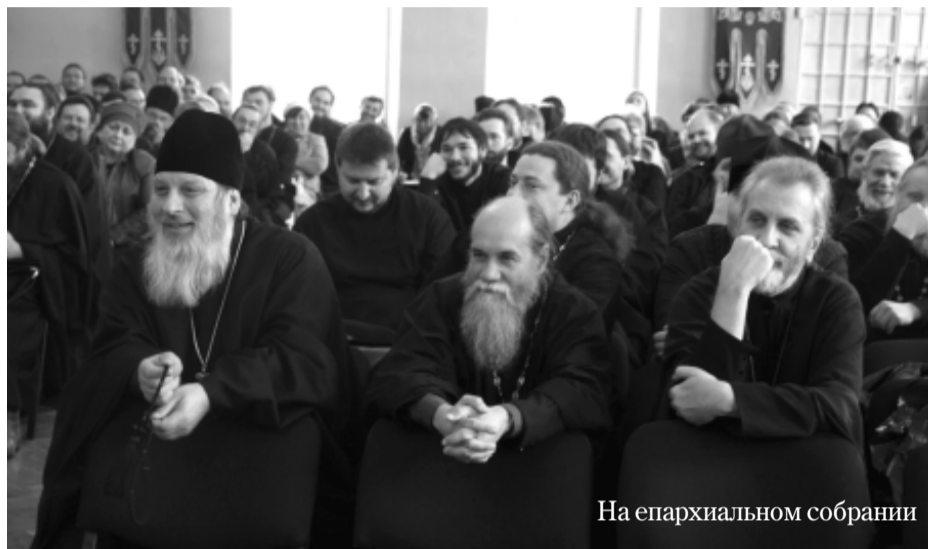
На епархиальном собрании

Владыка Никита призвал клириков своей епархии своими молитвами и трудами помочь в общем деле – организации нормальной жизнедеятельности молодой епархии, отметив, что «начинать любое дело всегда бывает не просто, но с Божией помощью, призывая на помощь опыт главы Митрополии, общими усилиями нам это под силу».