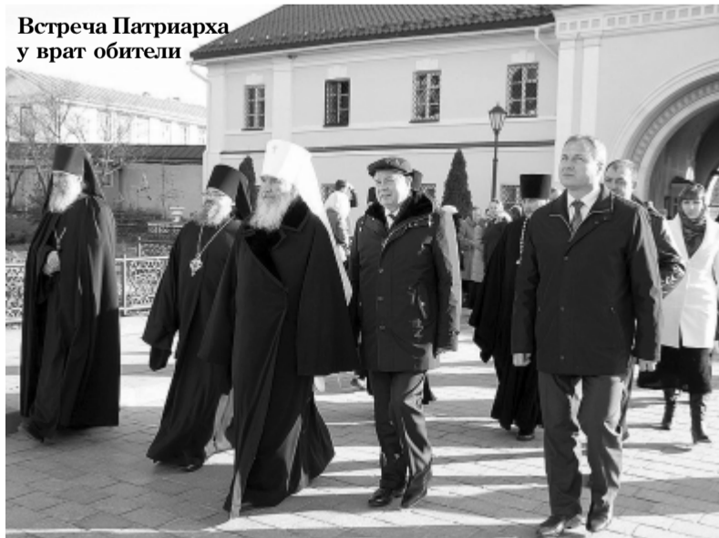
Встреча Патриарха у врат обители

его веры, частицу его терпения, его послушания, чтобы монашеская жизнь наша украсилась хотя бы, может быть, и в малой мере теми добродет-