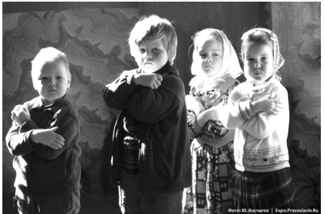
Фото: Ю. Костыров | Expo.Pравoslavie.Ru

это призыв к напряжению духовной жизни, призыв к покаянию, изменению своей жизни. Не надо нам сводить его лишь к частоте причащения. По мере покаяния будет возрастать потребность в причащении.