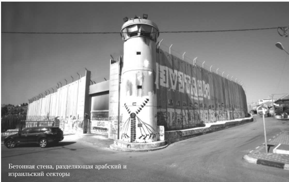
Бетонная стена, разделяющая арабский и израильский секторы