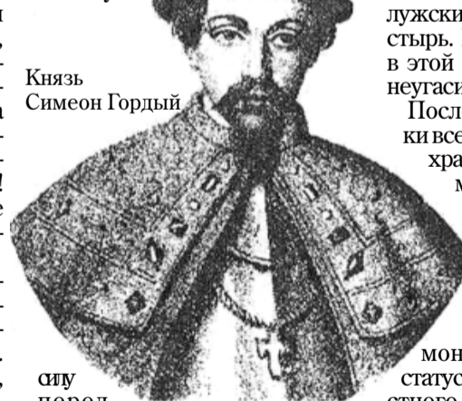
Князь Симеон Гордый

Чем же святой оказал помощь, да такую, что сказание о ней сохранилось на века в калужских летописях? Силой своей молитвы к Богу! Многие тогда иначе взглянули на неказистого человека, поняли, что он, оказывается, святой Божий человек, и молитва его имеет такую