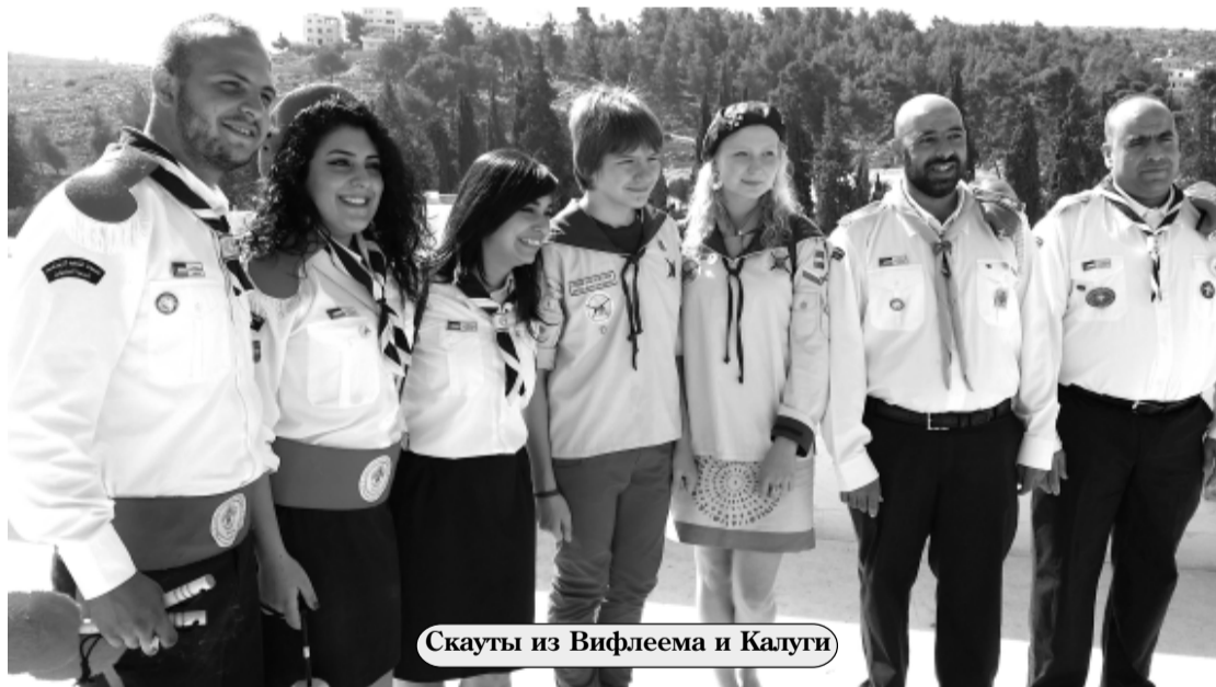
Скауты из Вифлеема и Калуги

дарство Израиль, королевство Иордания и Палестинская автономия, от которой Израиль отгорожен восьми-метровой стеной, поскольку не признаёт её. Эта стена в одночасье может передвинуться дальше на территорию Палестины – почему и возникают ответные реакции у Палестины. А они именно ответные!