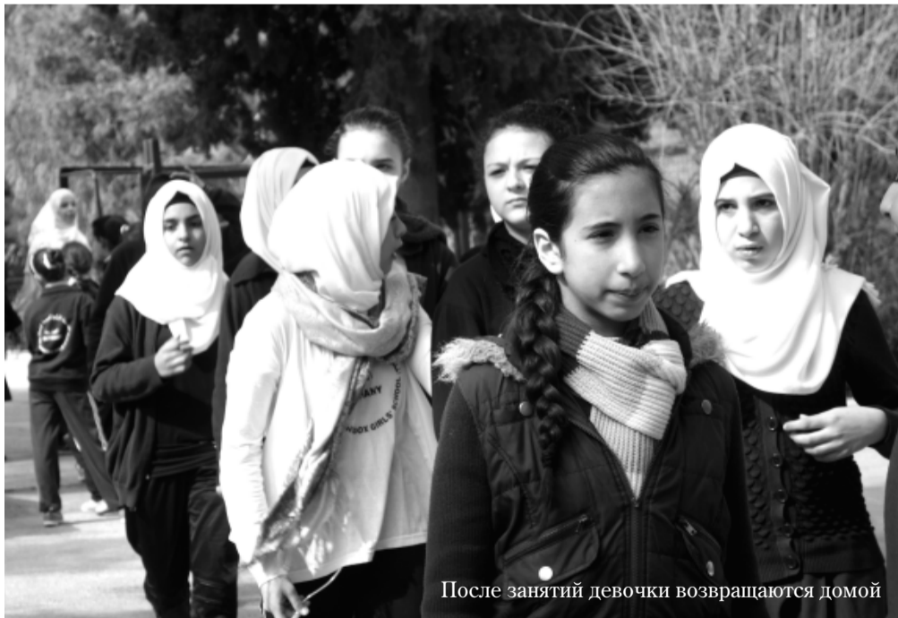
После занятий девочки возвращаются домой

Я говорю: «матушка, ну так откуда эта ваша жизнерадост-