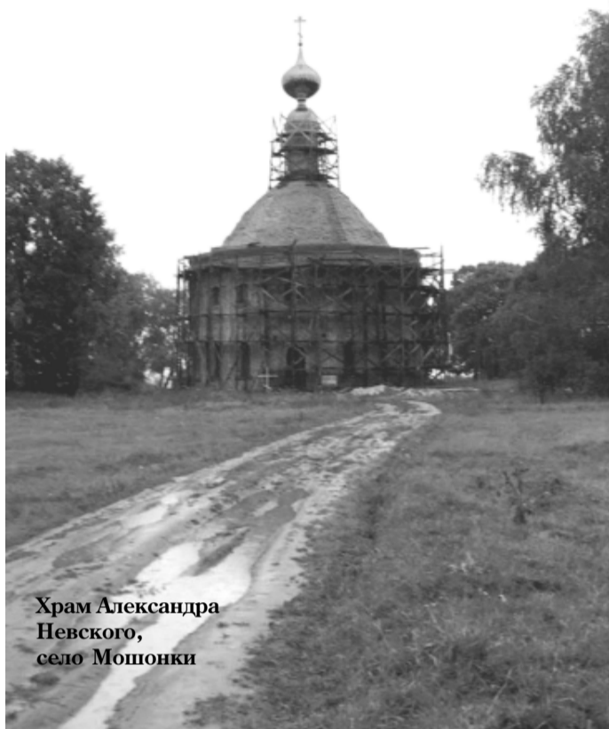
Храм Александра Невского, село Мошонки