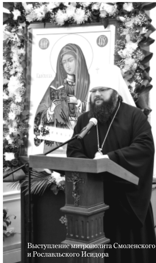
Выступление митрополита Смоленского и Рославльского Исидора

Основным её богатством являются кадры преподавателей. Окончание на стр. 8.