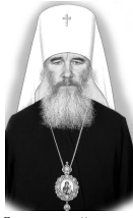
Современный ректор Калужской семинарии, митрополит Калужский и Боровский КЛИМЕНТ