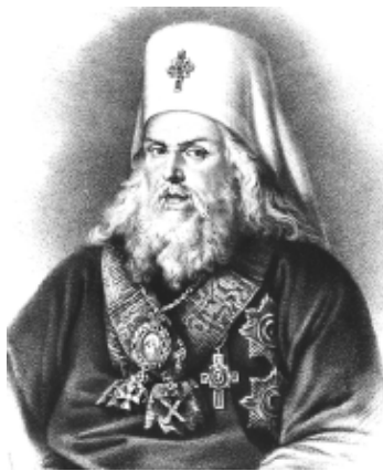
Основатель Калужской семинарии, митрополит ПЛАТОН (Левшин)

В 2016 году исполнилось 240 лет основания и 20 лет возрождения Калужской духовной семинарии