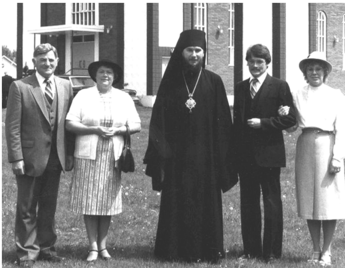
Канада, приход в честь Рождества Пресвятой Богородицы в Ниску (провинция Альберта)

жан бывало на службе в Гарфилде (штат Нью-Джерси), Филадельфии, Детройте.