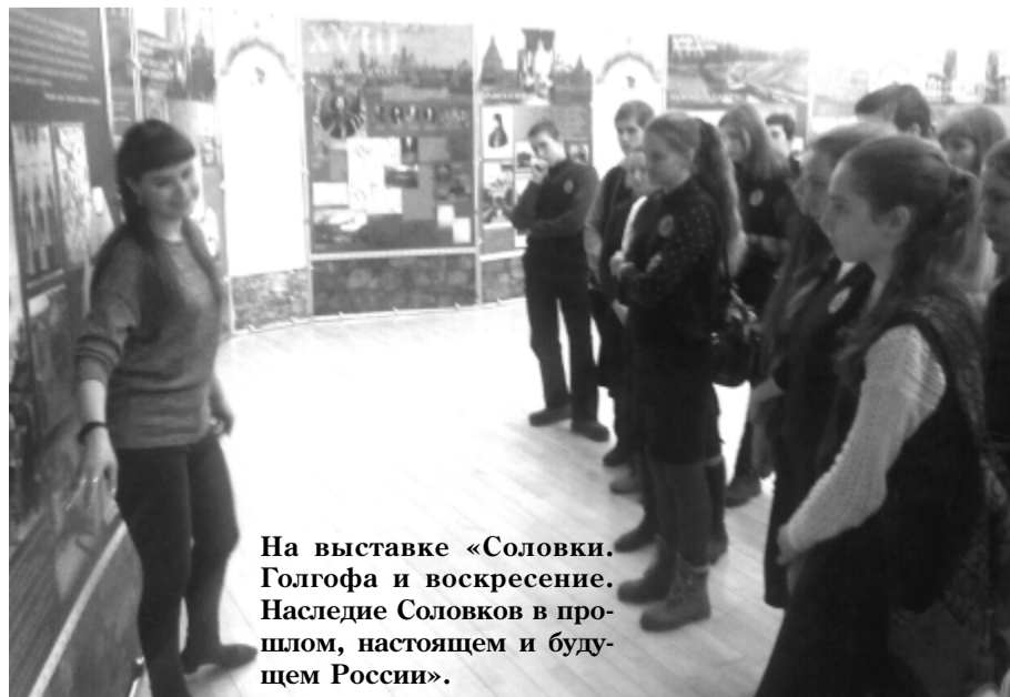
На выставке «Соловки. Голгофа и воскресение. Наследие Соловков в прошлом, настоящем и будущем России».