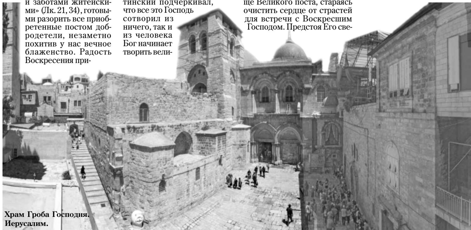
Храм Гроба Господня. Иерусалим.