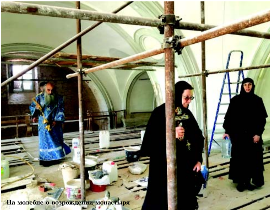
На молебне о возрождении монастыря

Православие.ru Продолжение в следующем номере.