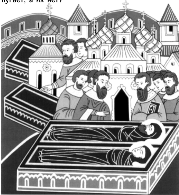
Святые Пётр и Феврония. Клеймо иконы.

Все мы люди, все из плоти и крови, с душой, жаждущей счастья, процветания и долголетия. Всех нас, можно предположить, страшит грядущая смерть. В то время как мы её боимся, святые желают поскорее перейти в вечность, не задерживаться здесь, на земле. Почему же нас смерть пугает, а их нет?