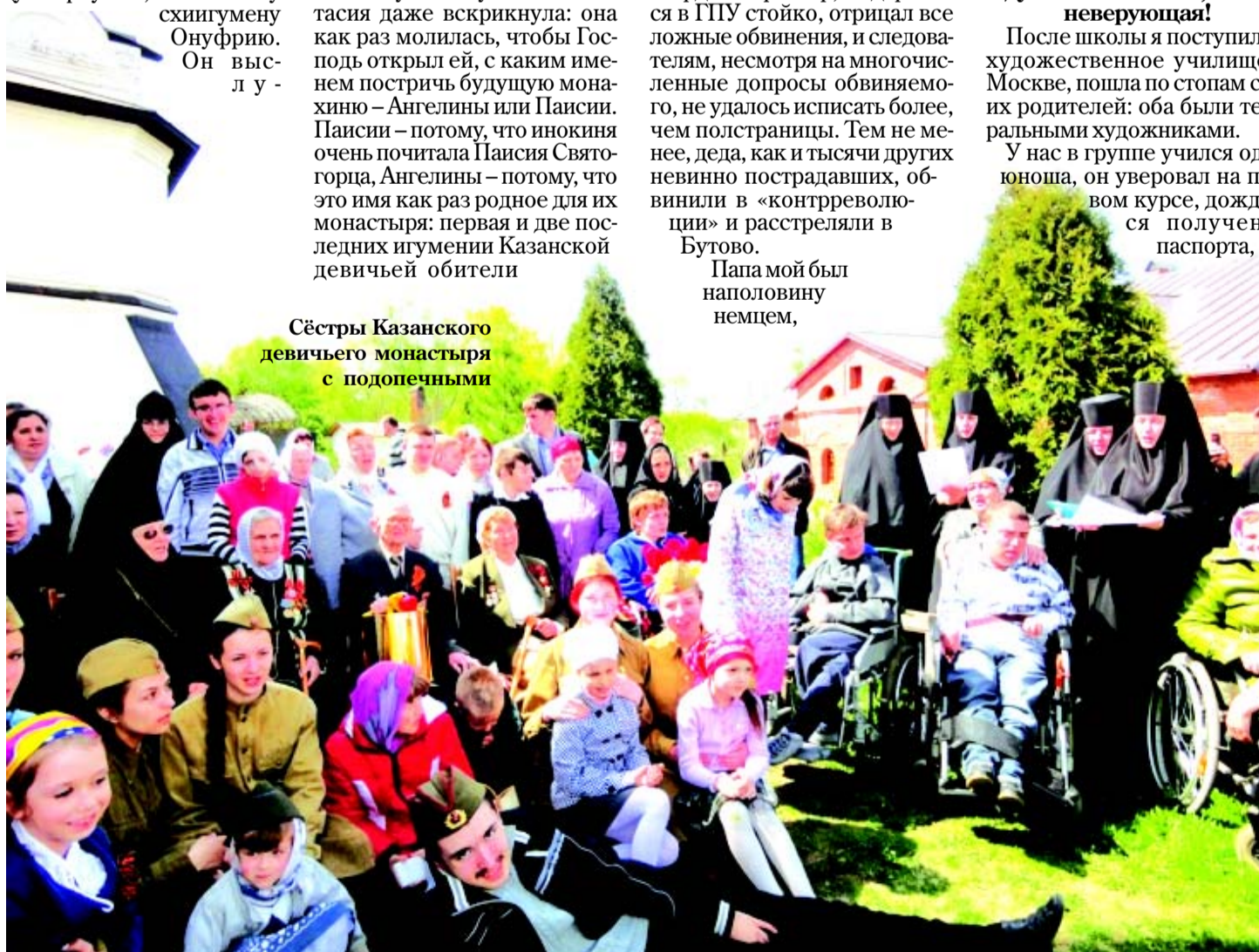
Сёстры Казанского девичьего монастыря с подопечными

У нас в группе учился один юноша, он уверовал на первом курсе, дождался получения паспорта, по-