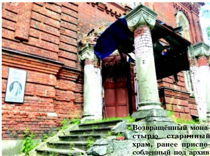
Возвращённый монастырь старинный храм, ранее приспособленный под архив