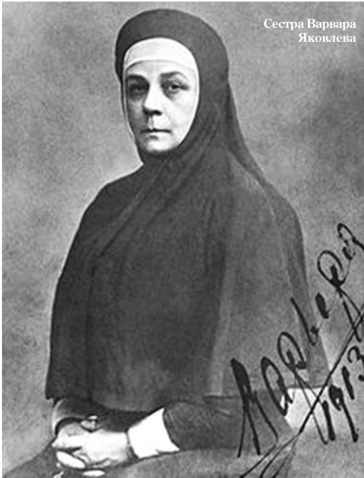
Сестра Варвара Яковлева

Источники и воспоминания – из книги: «Письма преподобномученицы великой княгини Елизаветы Феодоровны» М., 2011 г.