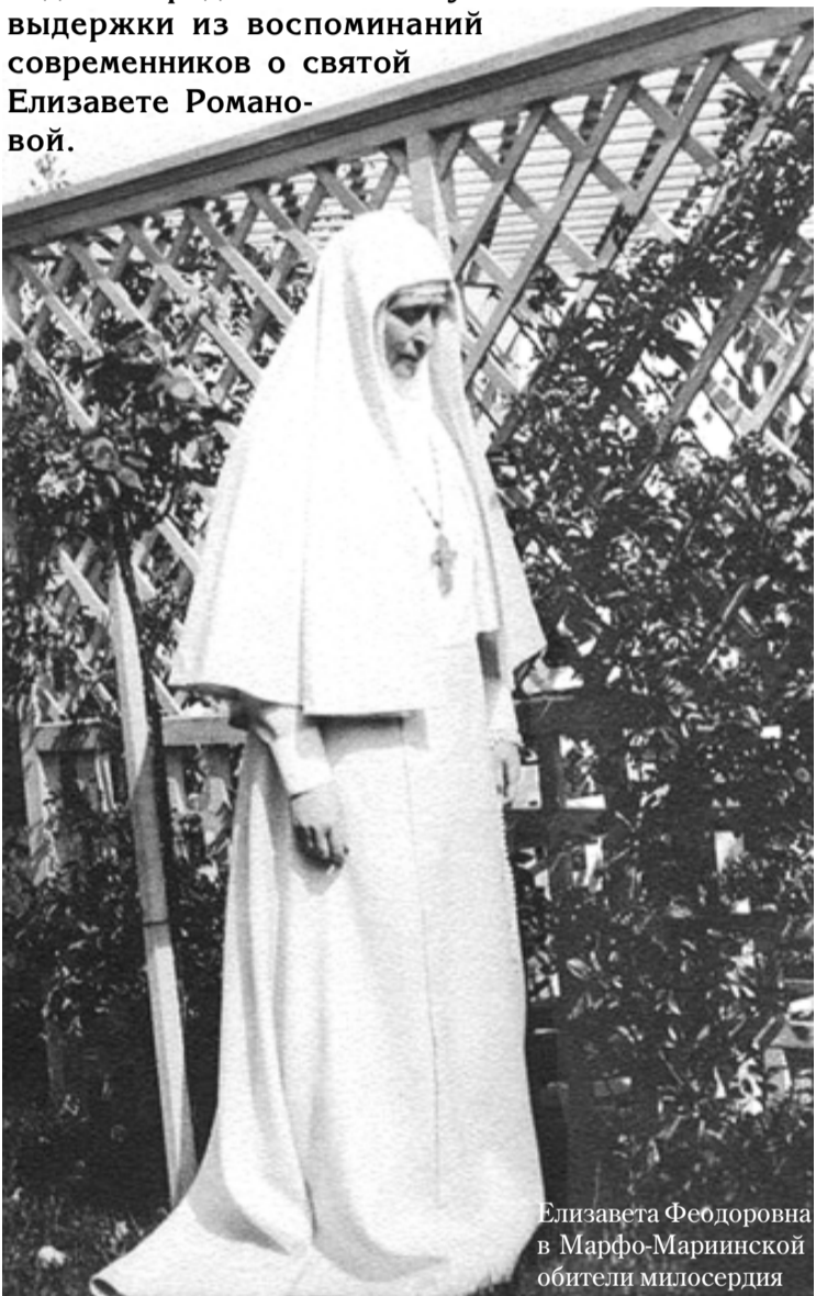
Елизавета Феодоровна в Марфо-Мариинской обители милосердия

Великая княгиня Елизавета Феодоровна называла Россию своей второй Родиной. Она категорически отказалась покинуть страну даже тогда, когда угроза её жизни стала явной. Вскоре после Октябрьского переворота эта трагедия свершилась: 18 июля 1918 года Елизавета Феодоровна «и иже с нею» приняли мученическую кончину под Алапаевском. В год столетия смерти преподобномученицы Елизаветы мы вновь и вновь всматриваемся в события её жизни, вникаем в образ её мыслей, учимся мужеству, любви к Богу и людям, стойкости в испытаниях, которыми она обладала. Предлагаем вашему вниманию выдержки из воспоминаний современников о святой Елизавете Романовой.