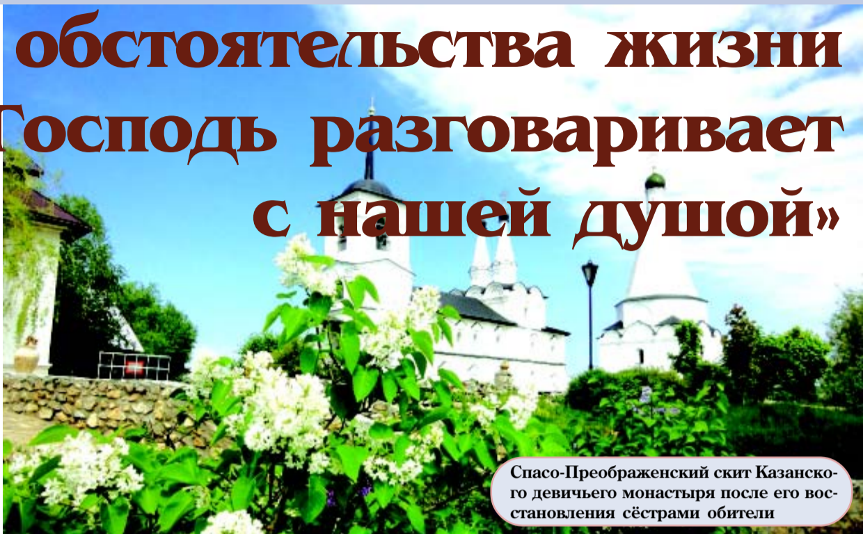
Спасо-Преображенский скит Казанского девичьего монастыря после его восстановления сёстрами обители