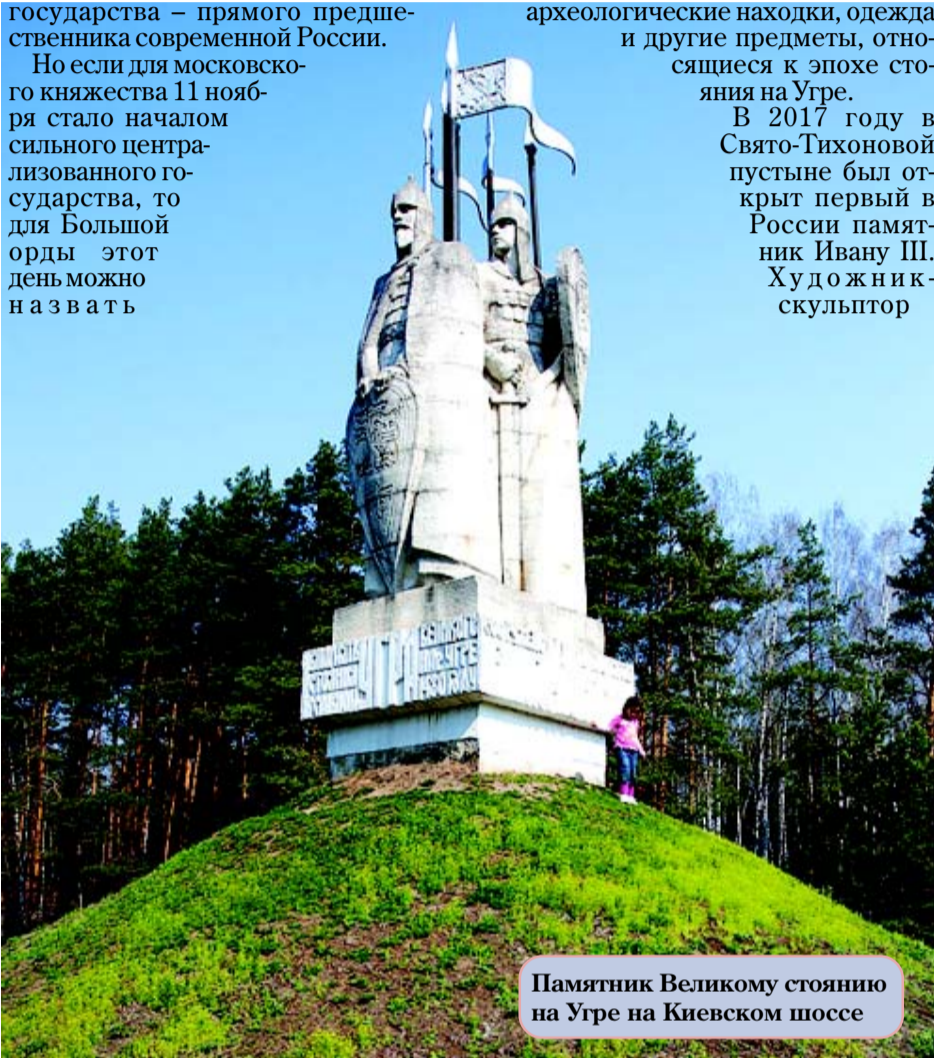
Памятник Великому стоянию на Угре на Киевском шоссе

В 2017 году в Свято-Тихоновой пустыне был открыт первый в России памятник Ивану III. Художник-скульптор