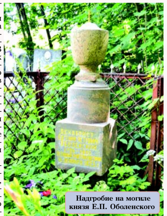
Надгробие на могиле князя Е.П. Оболенского