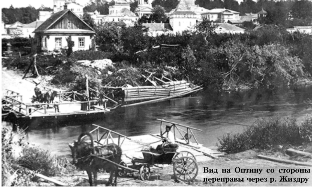
Вид на Оптину со стороны переправы через р. Жиздру