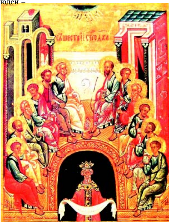
Сошествие Святого Духа на Апостолов. Великий Новгород. Рубеж XV-XVI вв.

В процессе развития иконографии, в средневизантийский период, «народы» изображались на иконах в виде двух фигур, помещённых внутри изогнутого профиля скамьи, на которой восседают апостолы. Причём, один из персонажей наделяется «варварскими» чертами (иногда это даже эфиоп), а другой – одет как византийский император. Это – персонификация «Нового Израиля» – народа православной Империи, которого символизируют