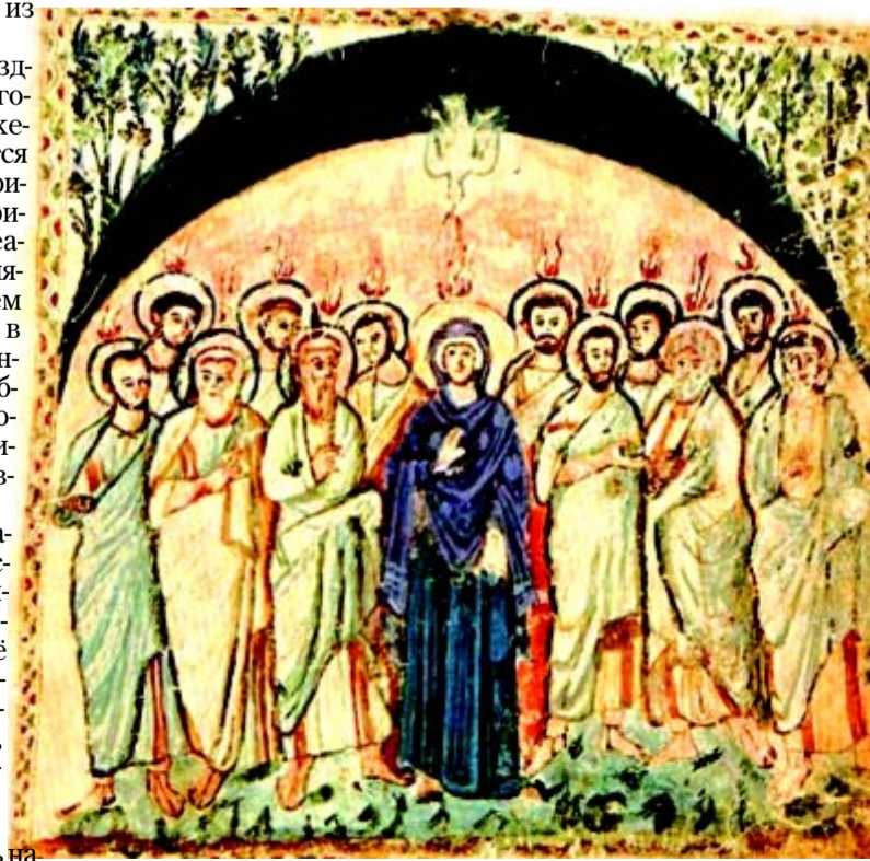
Евангелие Раввулы. Сошествие Святого Духа на Апостолов.

После VII века в восточно-христианском искусстве Богородицу сознательно не изображают на иконах Пятидесятницы, однако на Западе её образ продолжает присутствовать. В XVII веке русские мастера, опираясь на западные образцы, становившиеся всё более популярными на фоне процесса проникновения западного искусства, вновь начинают изображать Богородицу в сцене Сошествия Святого Духа.