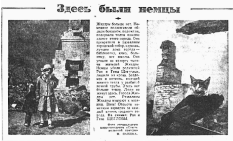
«...Развалины Жиздры взывают к отмщению. Воин! Отомсти немецким варварам за каждый камень родного города!» Комсомольская правда, август 1943 г.

Надеюсь, что этот День Победы станет прекрасным поводом для того, чтобы вспомнить историю своей семьи. Пусть дети гордятся и героями войны, и героями мирной жизни, узнают историю страны через судьбы близких.