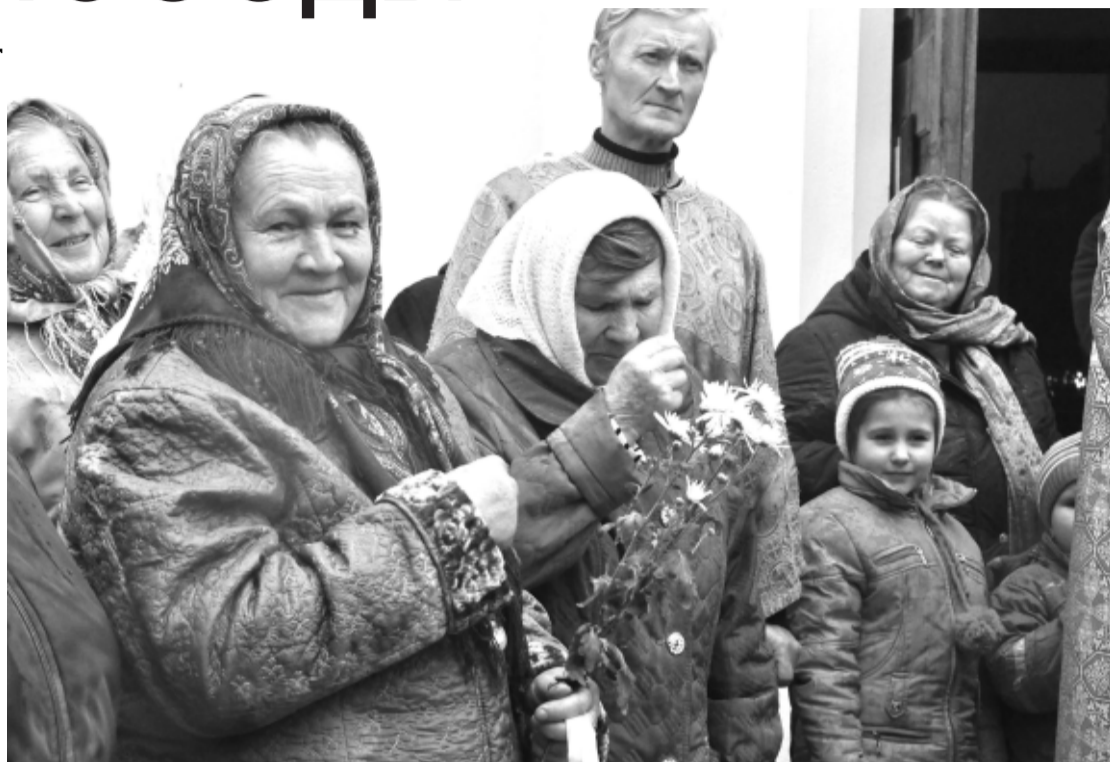
Прихожане Покровского храма г. Жиздры

Отношение к истории формируется в семье. Незнание биографий и имён близких родственников перерастает в незнание истории родного края, родной страны.