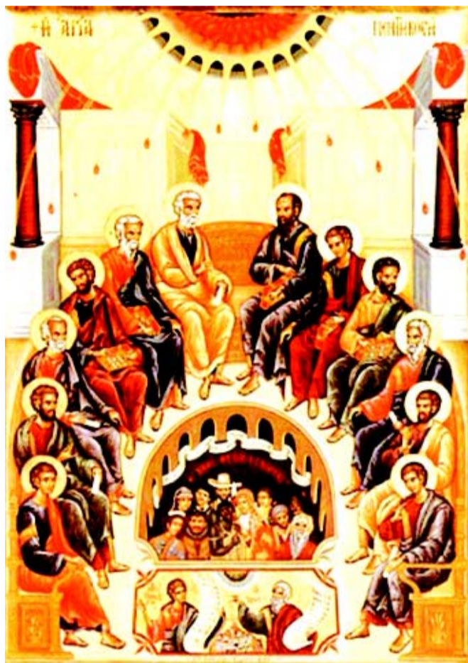
Пятидесятница. Современная греческая икона.

Пятидесятницы аллегории всего мира, внимающего апостольской проповеди, является частным подтверждением главных идей мировоззрения византийцев, стоящих за этим образом. Беседовала Юлия БЕЛКИНА.