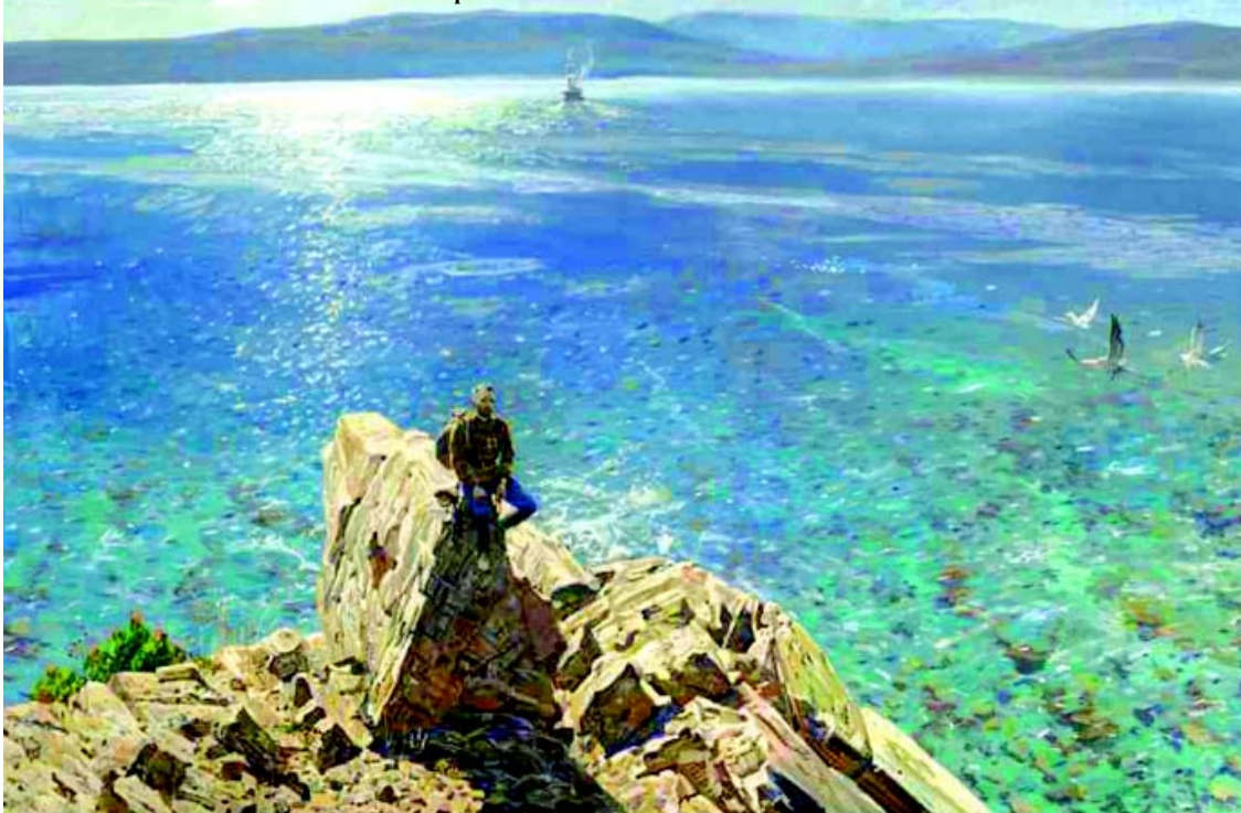
Павел Рыженко. Новая жизнь.Афон. 2008 г.

Около 6 часов утра колонна крестного хода достигла монастыря во имя святых Царственных страстотерпцев на Ганиной яме. Паломников и духовенство братия монастыря встречала колокольным звоном. По прибытии был совершен молебен святым Царственным страстотерпцам.