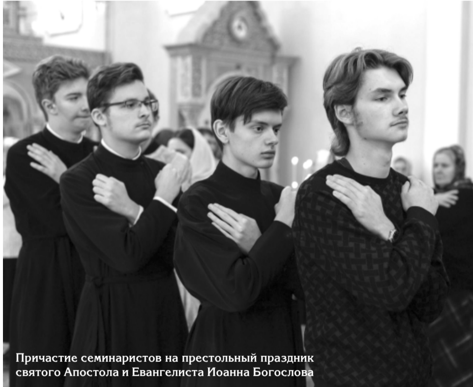
Причастие семинаристов на престольный праздник святого Апостола и Евангелиста Иоанна Богослова

Стоит идти тому, в ком есть призвание, кто чувствует, что это – его, что он хочет стать священнослужителем, что ему это интересно. Вплоть до того, что открываешь иногда служебник, видишь тайные молитвы, которые священники произносят во время службы, когда хор поёт, – и ты этим вдохновляешься, понимаешь, насколько это здорово – предстоять перед Престолом Божиим, произносить эти слова, молиться за всех и за вся, что твоими руками Господь совершает величайшие Таинства. Люди, которые чувствуют, что это их вдохновляет, кому это нравится и для кого это важно – таким можно поступать смело.