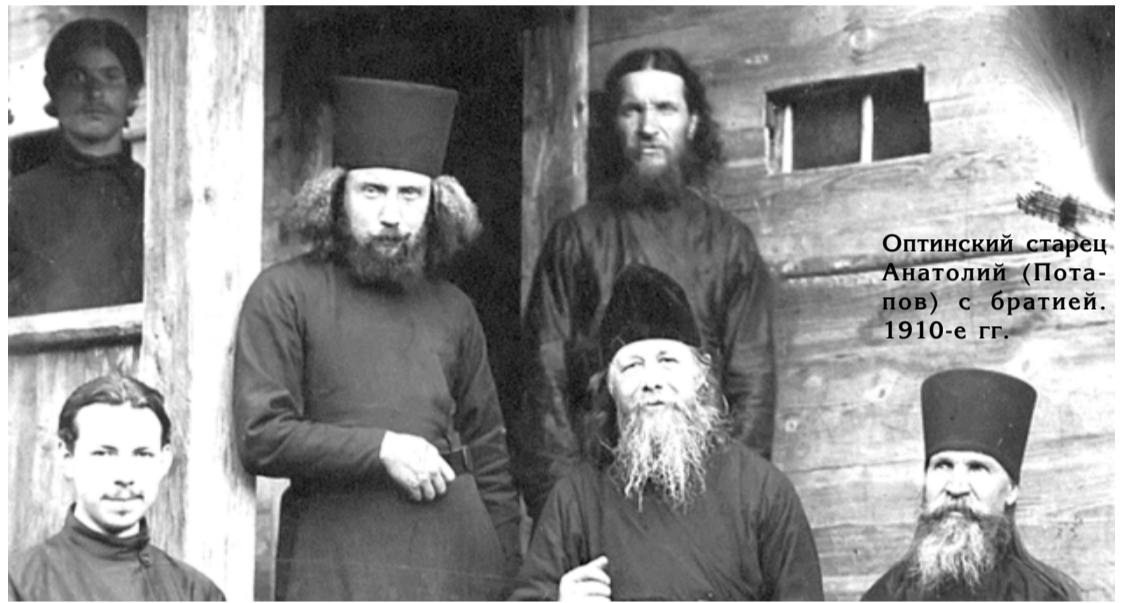
Оптинский старец Анатолий (Потапов) с братией. 1910-е гг.

лом Первой мировой войны, он был снова призван в армию, служил в лазарете и попал в плен. По окончании войны в 1918 году он вернулся в Оптину, но монастырь вскоре был закрыт и превращён в му-