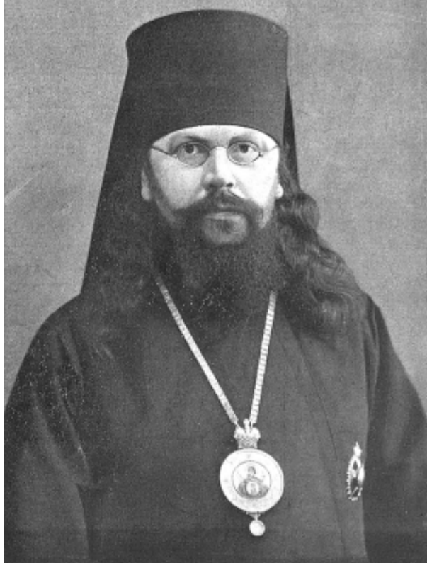
Архиепископ Смоленский Серафим (Остроумов)

зей, в котором он проработал до 1920 года, а затем поселился в городе Козельске, выполняя различные работы.