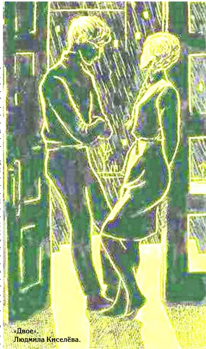
«Двое» Людмила Киселёва.

С этого момента робко пробилось новое самоощущение Людмилы: «Я могу!». Неизвестно, закрепилось бы это чувство, или растворилось в череде но-