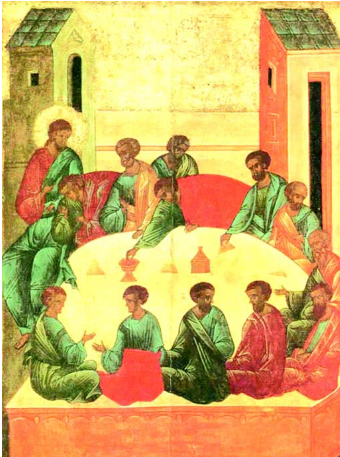
Тайная вечеря. Средник иконы праздничного ряда иконостаса Успенского собора Кирилло-Белозерского монастыря. 1497 г. Государственный Русский музей, Санкт-Петербург

Икону «Тайная вечеря» из иконостаса Кирилло-Белозерского монастыря писал мастер. Его икона отличается необыкновенной мастеровитостью и изяществом рисунка, свойственной представителям московской иконописной традиции, и при этом сохраняет декоративность в отношении цвета, отличающую новгородскую школу. В XVI веке Кирилло-Белозерский монастырь был одной из крупнейших древнерусских обителей, наряду с Троице-Сергиевой Лаврой или Соловецким монастырем. Сюда приглашались лучшие мастера, о чем, в частности, свидетельствует живопись Кирилло-Белозерского иконостаса конца XV века. Рассмотрим подробнее образ «Тайной вечера»: сюжет иконы и приёмы её исполнения.