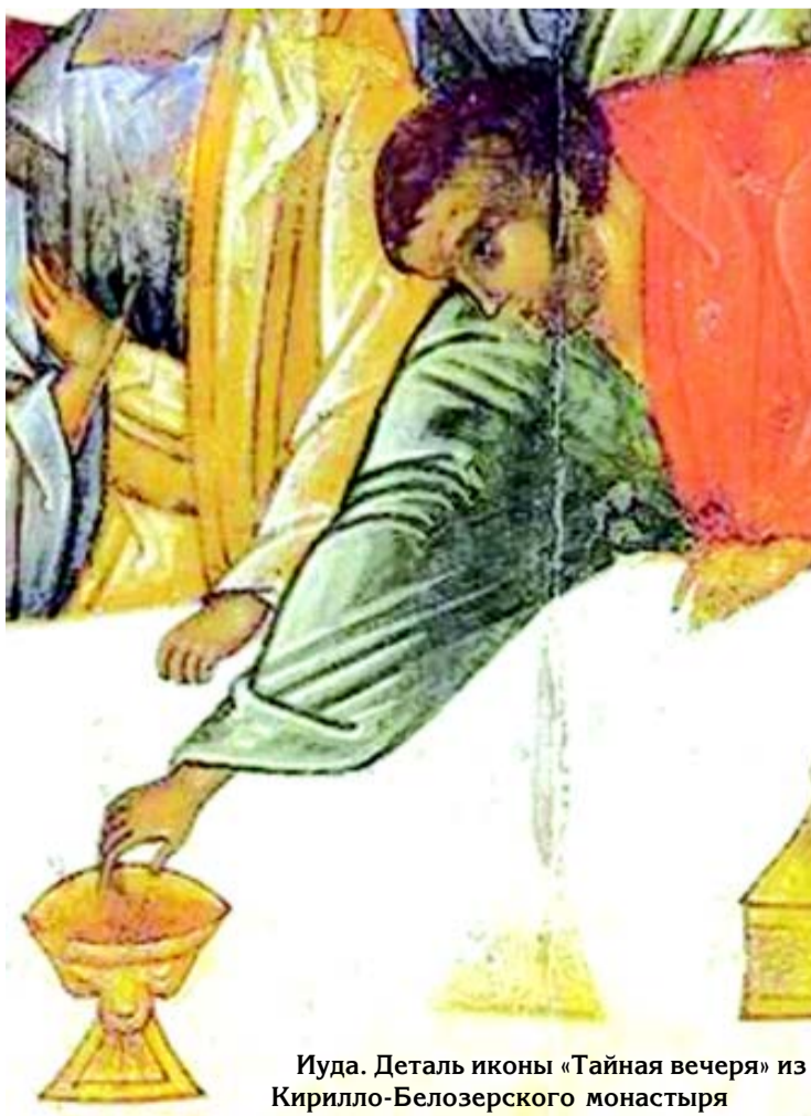
Иуда. Деталь иконы «Тайная вечеря» из Кирилло-Белозерского монастыря