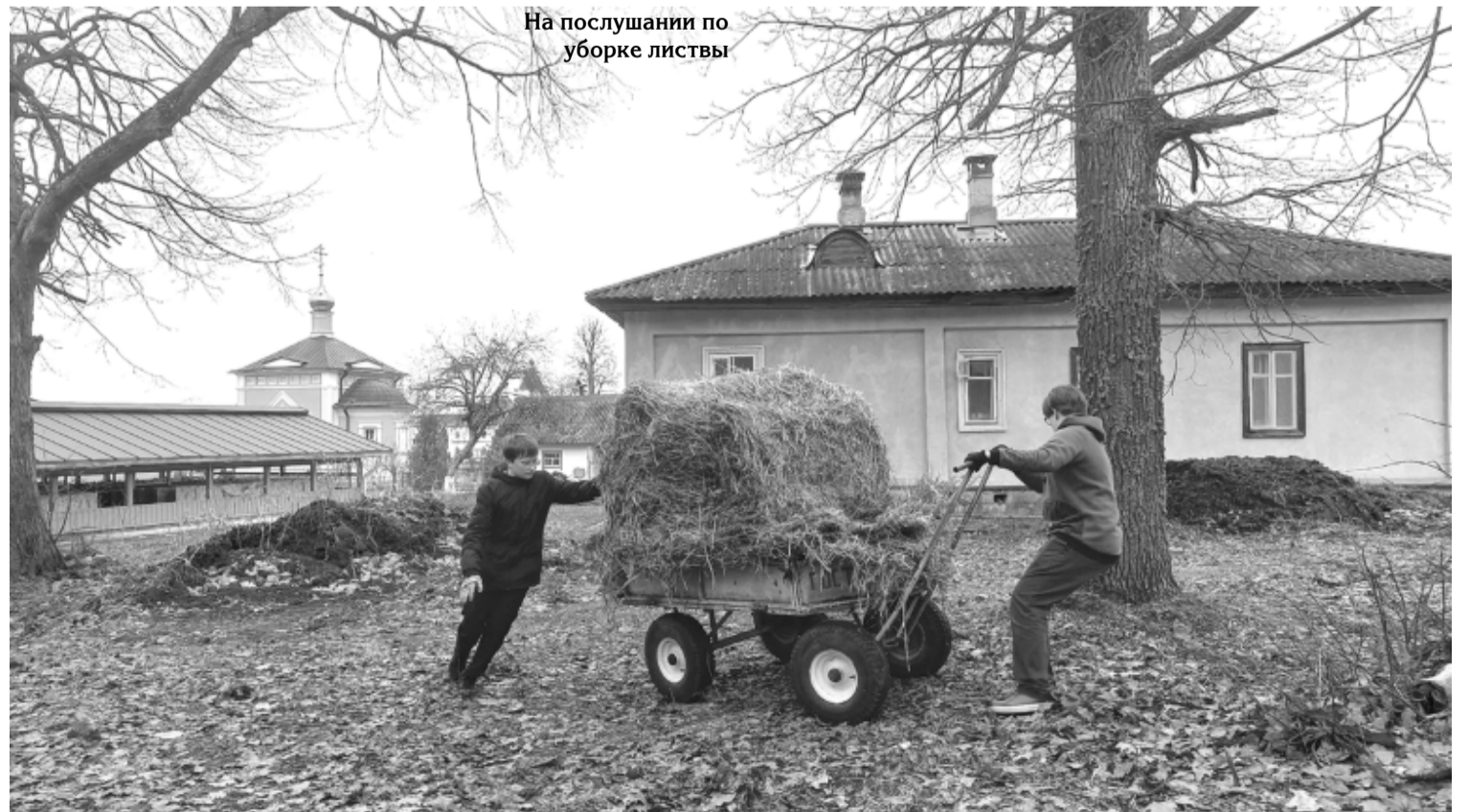
На послушании по уборке листьев