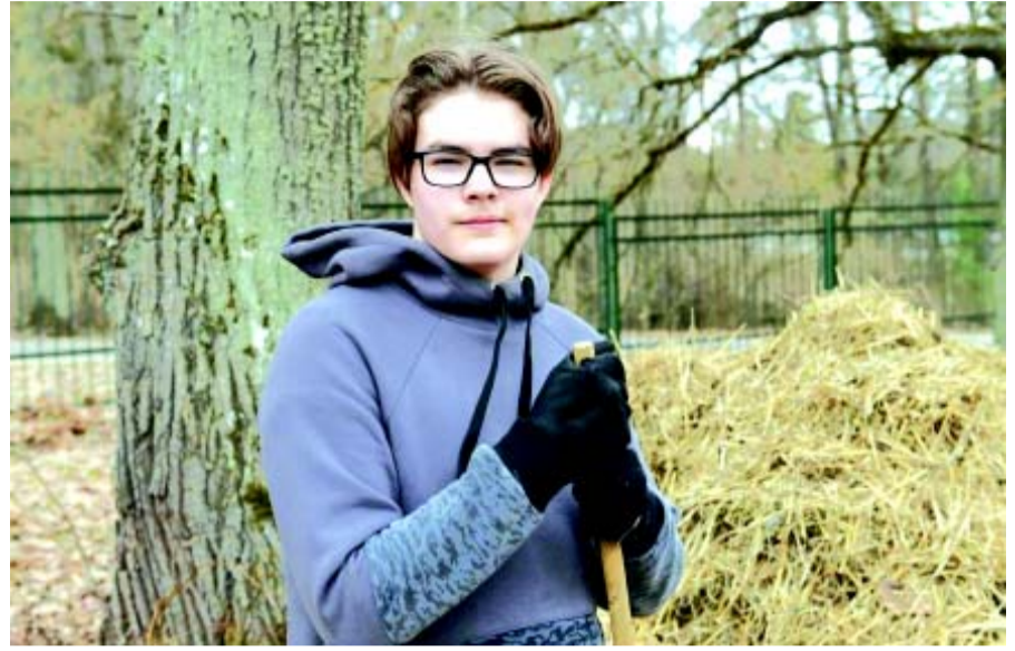
На хоз дворе