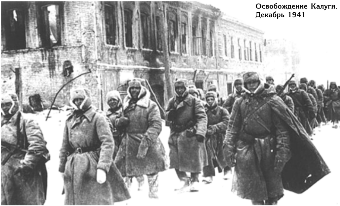
Освобождение Калуги. Декабрь 1941

К 80-летию Великой Победы, в нескольких номерах нашего издания, мы будем помещать воспоминания очевидцев о войне. Они – свидетели тех страшных событий. А мы, их потомки, не станем иванами, не помнящими родства. Мы прочтём их воспоминания, помолимся о них, живых и ушедших от нас и помянем добрым словом. И ещё, может быть, крепко подумаем, что мы, в свою очередь, можем сделать доброго для нашей многострадальной Родины.