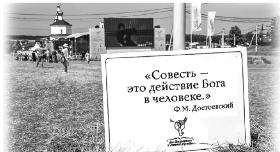
Щиты с цитатами из Достоевского - на площадках фестиваля

Человеку, по-настоящему любящему литературу, я бы предложил: попробуйте какое-то время почитать именно то, что когда-то читал Достоевский. Знакомство с прочитанным им поможет лучше понять и то, что он создал.