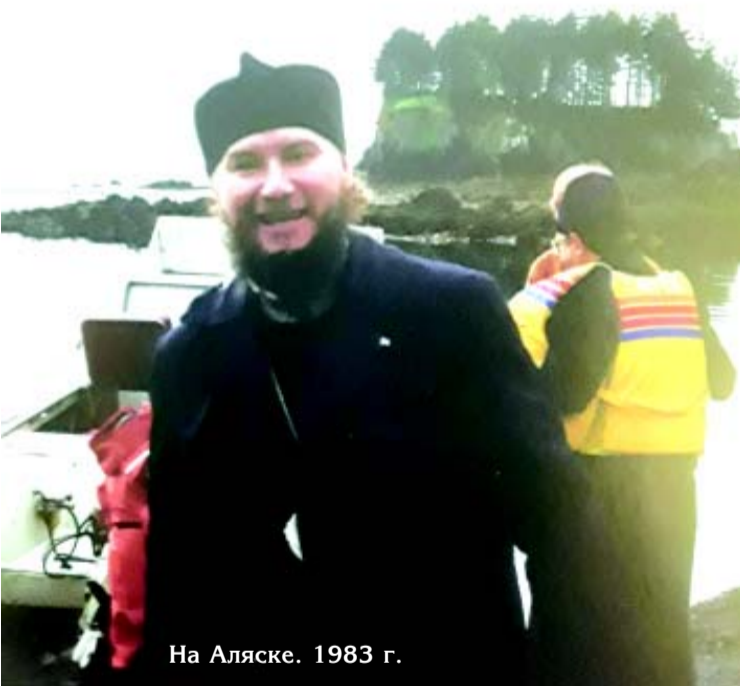
На Аляске. 1983 г.