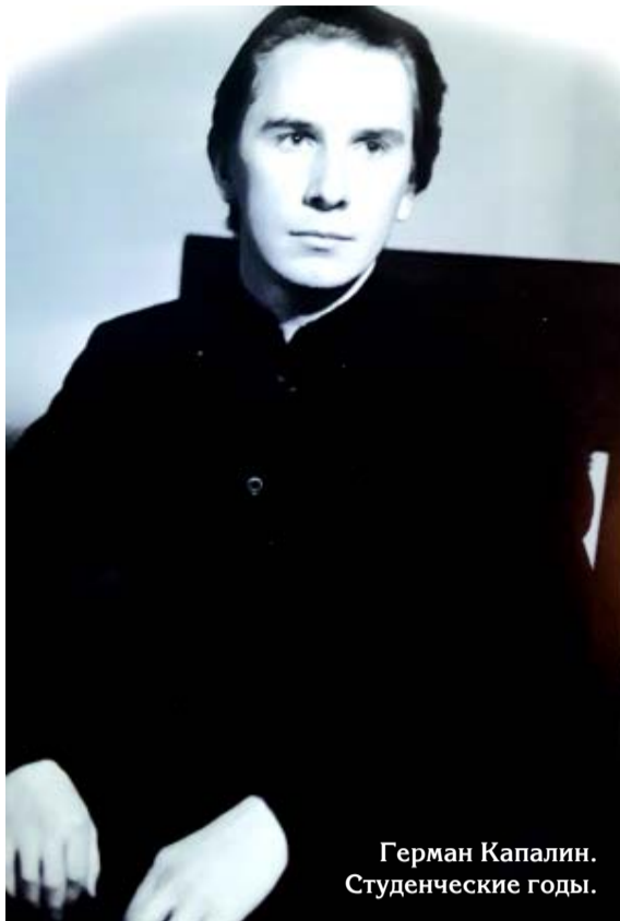
Герман Капалин. Студенческие годы.

«В 1982 году Господь призвал меня на архиерейское служение. Моя жизнь изменилась настолько неожиданно, что сначала даже было чувство страха из-за принятия этой большой ответственности перед Богом. С детства я воспринимал епископство как великое служение в Церкви. Это – высота духовности, особый дар молитвенности, постоянное предстояние за народ перед Богом и попечение о людях. Сердце епископа должно быть исполнено любовью, и он сам должен являть чистоту сердечную и пример терпения в несении жизненного креста. «Кто я, чтобы мне быть на такой великой свещнице», – проносилось в голове. Но пути Господни неисповедимы, и в новом назначении я видел промыслительное водительство Божие. Вопрос о моем избрании епископом в Америку возник после визита туда Святейшего Патриарха Пимена в июне 1982 года. Когда он находился в Нью-Йорке, к нему обратился управляющий Патриаршими приходами в Канаде и США архиепископ Ириней с просьбой о возвращении на Родину. Подбором нового епископа занимался митрополит Минский Филарет, являвшийся в то время председателем