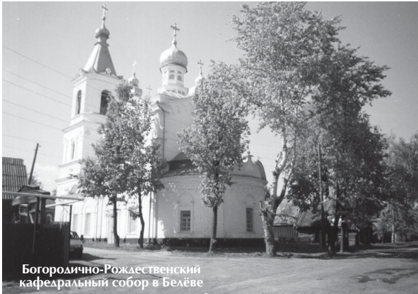
Богородично-Рождественский кафедральный собор в Белёве