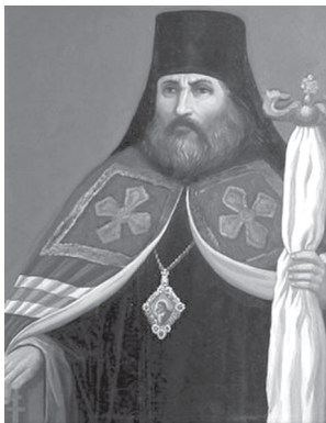
Архиепископ Астраханский Тихон (Малинин) (1745 – 1793)

Калужская земля дала России и Русской Православной Церкви немало известных церковных деятелей: священников и архипастырей. В этой статье мы познакомим вас с биографиями уроженцев и выходцев из Калужской губернии, возшедших на степень архиерея.