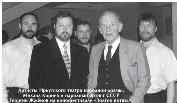
Артисты Иркутского театра народной драмы, Михаил Корнев и народный артист СССР Георгий Жжёнов на кинофестивале «Золотой витязь».

Подробнее об Иркутском театре народной драмы можно узнать на сайте igtnd.ru