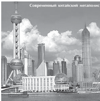
Современный китайский мегаполис

Но затем военные успехи прекратились и через 15 лет восстание было подавлено. Хун Сю-цзоань покончил жизнь самоубийством.