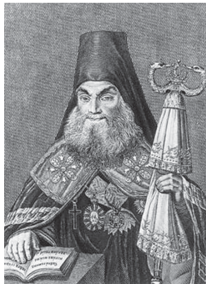
Архиепископ Ярославский и Ростовский Авраам (Шумилин) (1761 – 1844)

Письмо к митр. Платону (Ист. Моск. акад. М., 1855).