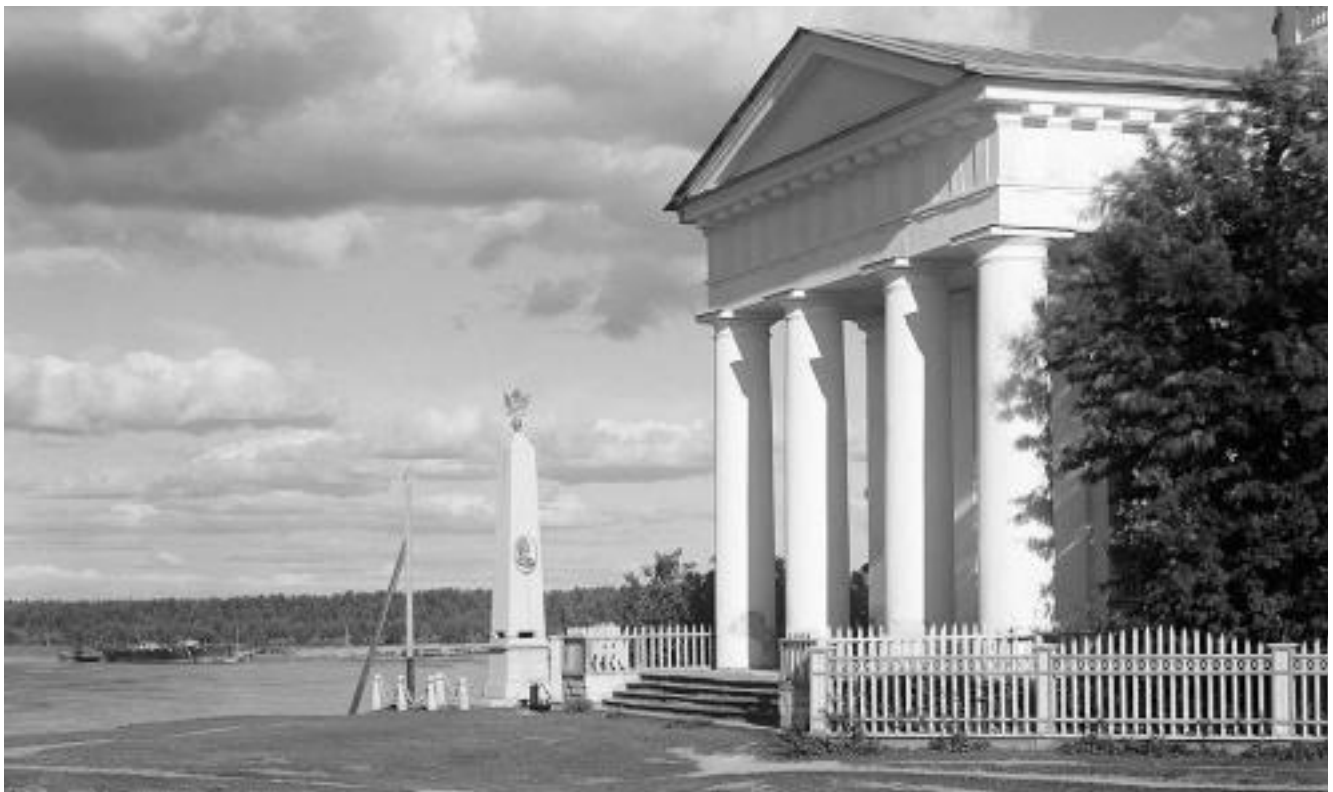
Памятник у собора