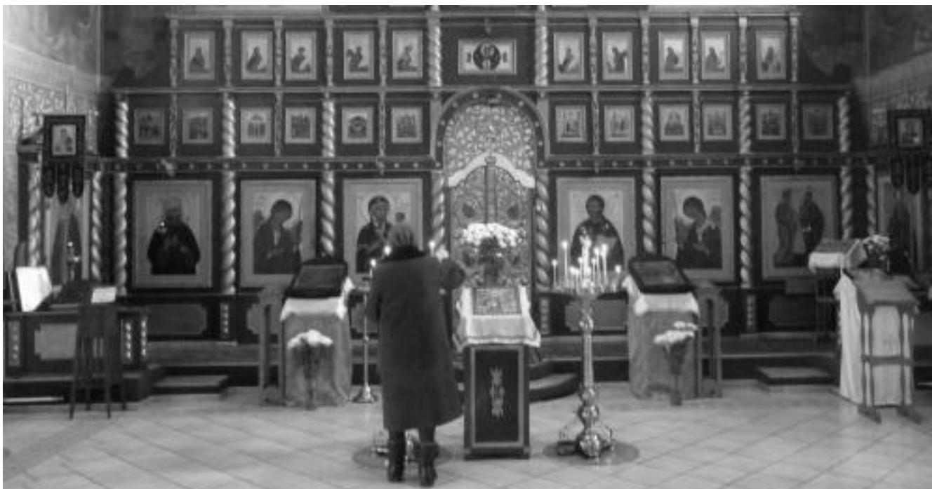
Внутреннее убранство храма Первоверховных Апостолов Петра и Павла в городе Ладейное поле

Вообще городок выглядит тихим, спокойным и уютным. На улицах – как в центре, так и на окраине, приятная глазу чистота. Урны на каждом шагу, на тротуарах нет мусора, все дорожки заботливо и добросовестно подметены. В идеальном состоянии скверы, парк Свирской Победы, аллеи. Незатейливые клумбы еще хранят напоминание о летней пестроте и заботе о том, чтобы любимые места прогулок и