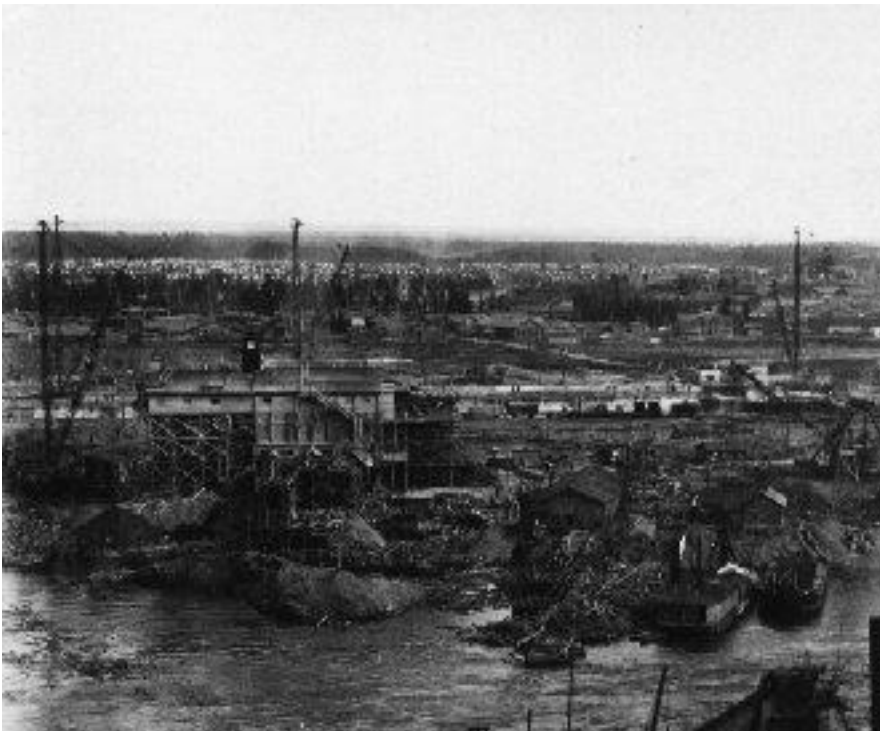
Строительство Свирьской ГЭС