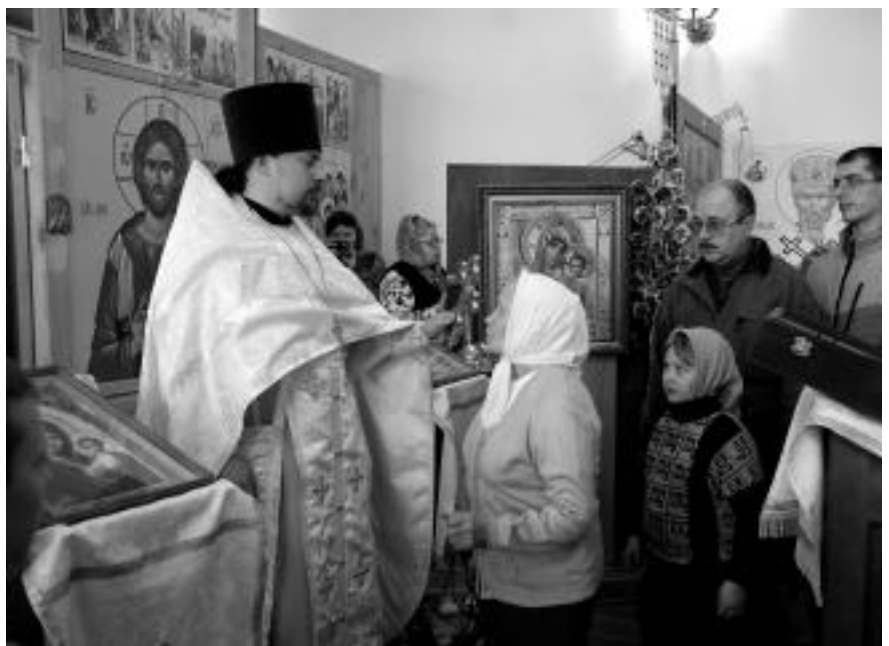
На праздничной литургии в храме в честь архистратига Божия Михаила

23 ноября. В калужской епархии молитвенно отметили память святого священномученика Августина и всех новомучеников в Земле Калужской