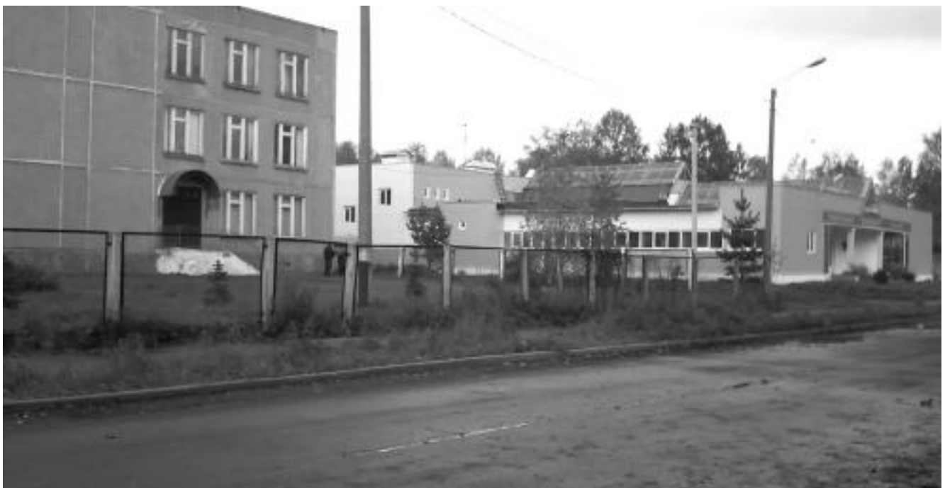
Школа и бассейн, построенные на месте зданий Управления Свирлага