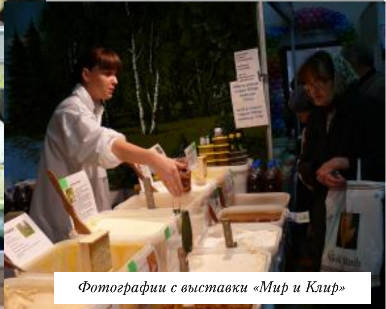
Фотографии с выставки «Мир и Клер»