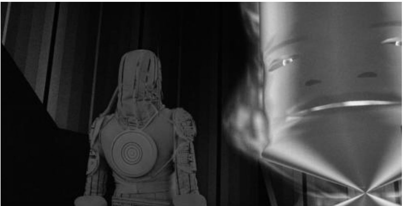
Кадр из фильма «Трон», который в 1982 году впервые рассказал зрителям историю проникновения человека в виртуальную реальность

Но суть и задача виртуальной реальности (в частности компьютерных игр) не в том, чтобы навязать реципиенту свой внутренний мир, а в том, чтобы создать атмосферу, условия для проявления своих фантазий и мечтаний, заставить стать не только зрителем и посторонним наблюдателем этого мира, но и его активным участником, не только соперником, но и творцом событий этого мира. С точки зрения восприятия и переживания человека, этот мнимый мир настолько же реален, а по силе переживаний даже и более чувственен, чем существующий мир. Человек входит в новый, технологенно созданный мир, и его сознание как бы отделяется от реального мира и переходит в новый мир. Причем этот мир - мир не только мечтаний, но мир реальных переживаний и поступков. Человек-мечтатель, в своих мечтаниях и грезах выдумывающий себе не существующий реально мир, может настолько сильно войти в этот мир, что он становится его собственным «я». Постепенно