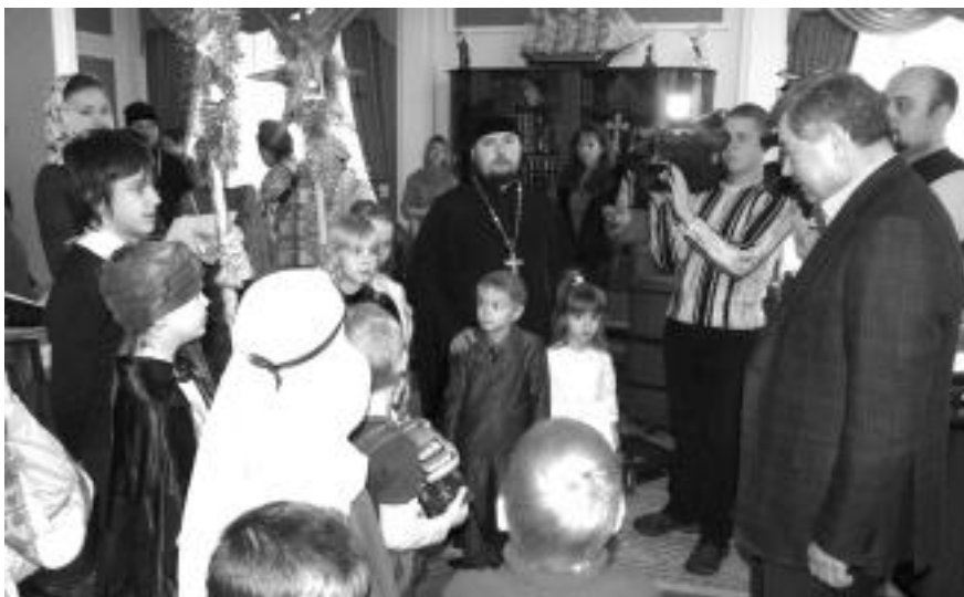
Колядки у губернатора Калужской области

В дома престарелых, как правило, попадают люди обездоленные, брошенные, больные, оказавшиеся в тяжелых жизненных ситуациях, которым не хватает простого человеческого общения. Поэтому такие визиты оказывают позитивное воздействие. Очень отраднo видеть, как у людей, переживших много горя, вдруг на лице появляется улыбка.