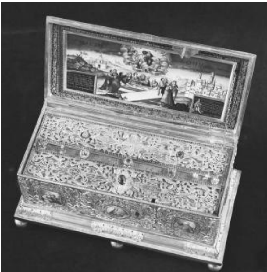
Честной пояс Пресвятой Богородицы

Таким же образом поступают и супруги, прибавляя к этому пост и супружеское воздержание – по возможности и по взаимному согласию. При этом необходимо помнить, что искреннее покаяние и участие в Таинствах Церкви должны продолжаться в течение всей нашей жизни, поскольку это является единственным способом общения и единения с Богом как в настоящем, так и в будущем веке.