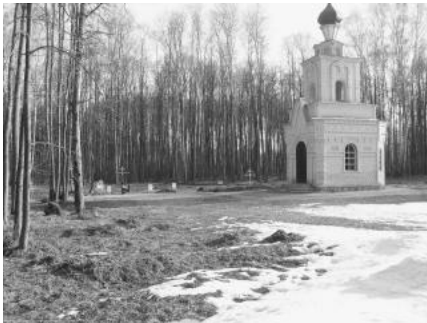
Место захоронения убиенных. Тула