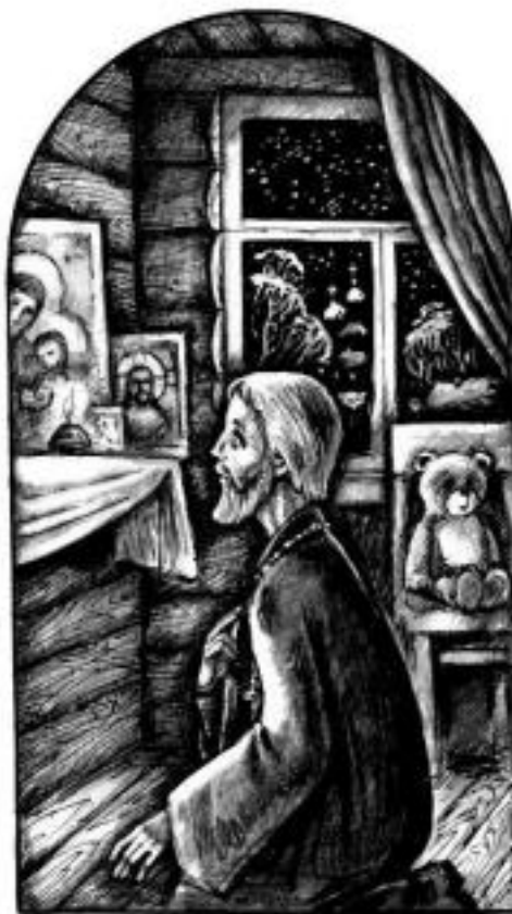
Рисунок Евгения Смирнова

Люди в городке много работали, жили небогато, и летом, в свободное время, предпочи-