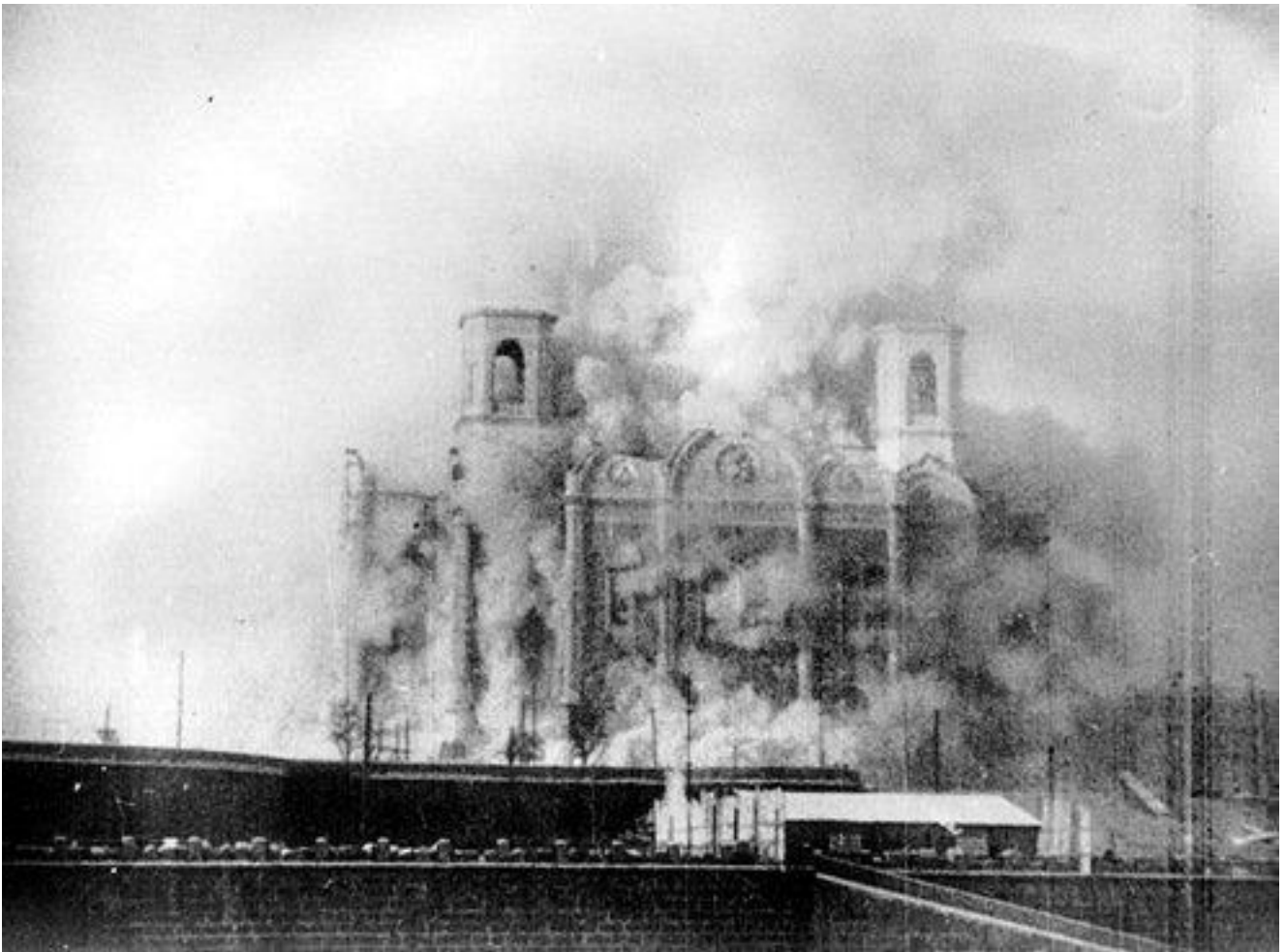
Кадр из кинохроники, запечатлевшей уничтожение храма Христа Спасителя

В 1832 г. император Николай I утвердил новый проект храма Христа Спасителя. Проект был представлен архитектором К. Тоном. Закладка нового храма по второму проекту была совершена в 1839 г. на том месте (на Пречистенской набережной), которое выбрал государь. Он присутствовал на освящении закладки храма, которое было проведено святителем Филаре-