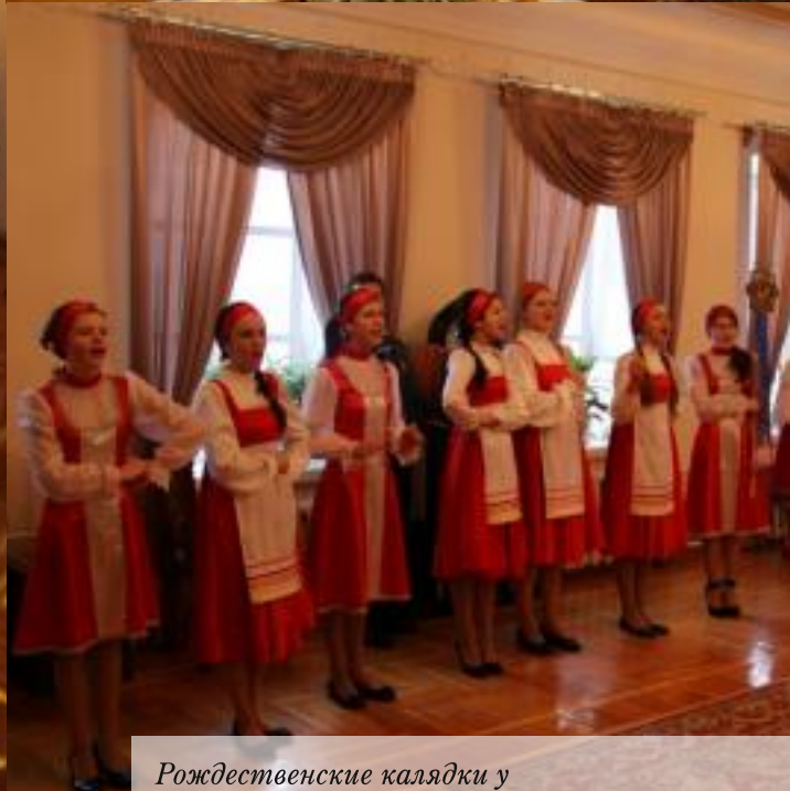
Рождественские калядки у митрополита Климента