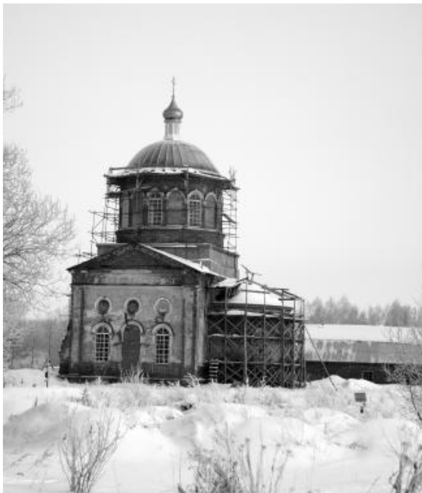
Храм Рождества Христова в с. Карамышево