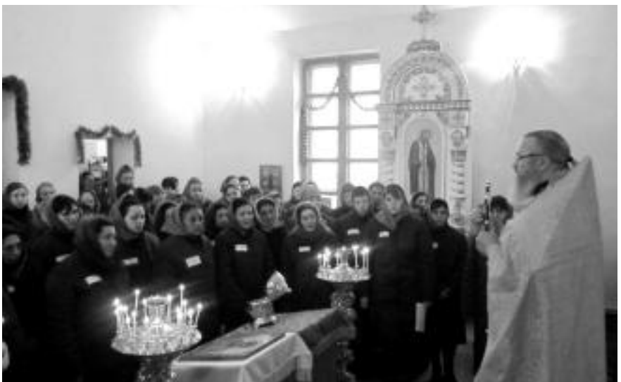
Молебен в женской колонии

Его хранительницы — сёстры Спасо—Преображен-