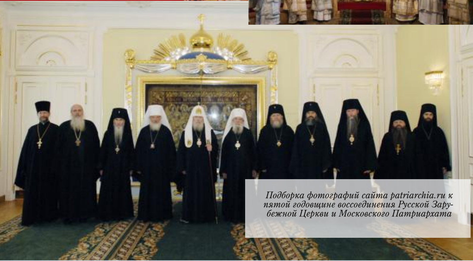
Подборка фотографий сайта patriarchia.ru к пятой годовщине воссоединения Русской Зарубежной Церкви и Московского Патриархата