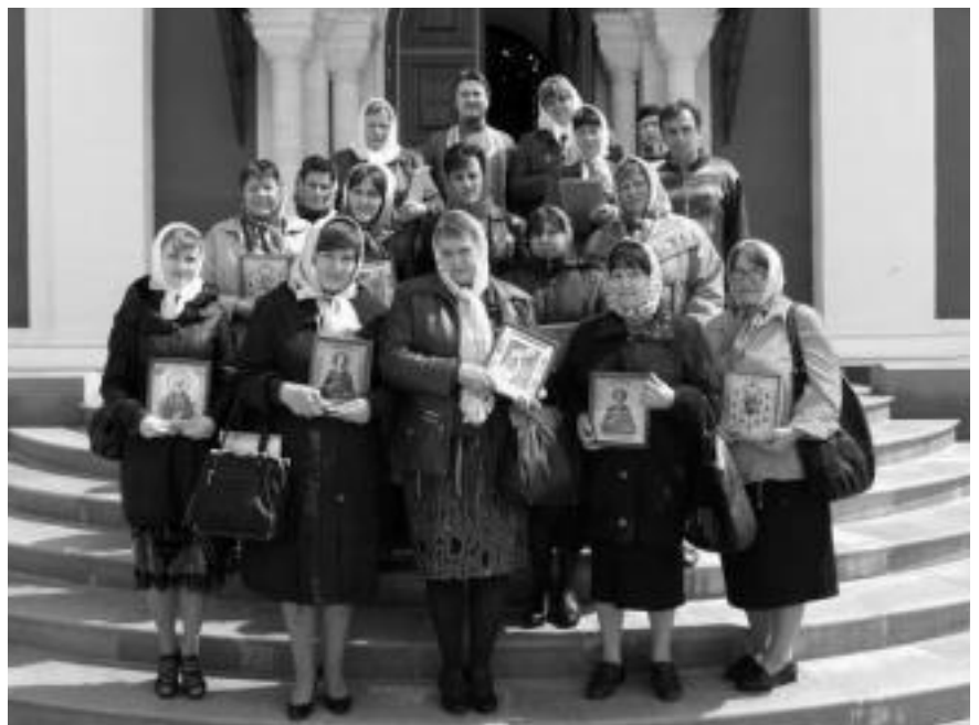
Преподаватели курса ОПК у храма Георгия Победоносца

Священник изложил основные моменты православного учения об этой христианской добродетели. «Сама молитва — это воссоединение и преодоление того разрыва между Богом и человеком, который произошел во время