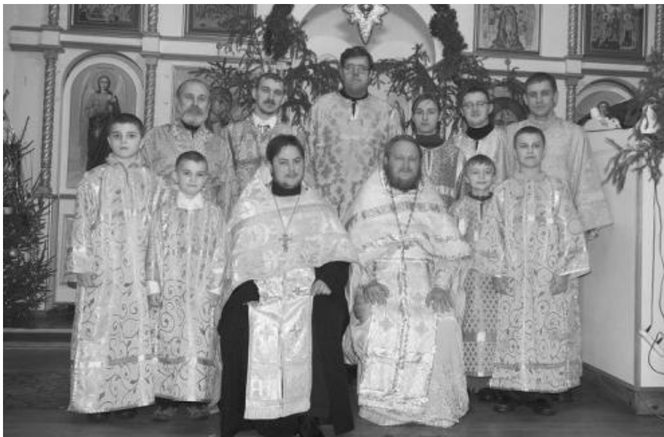
Клир и причт храма 2009 г.

Так из года в год храм становился красивее, что показывало внимательное отношение причта и прихожан к своей святыне, постоянное их дея-