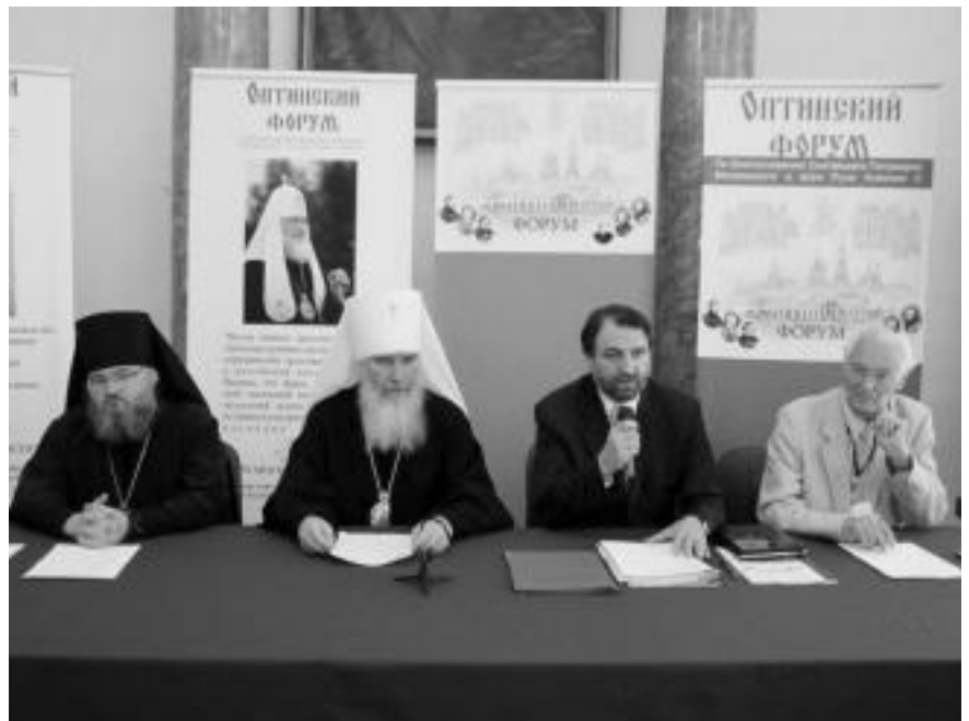
Открытие Оптинского форума