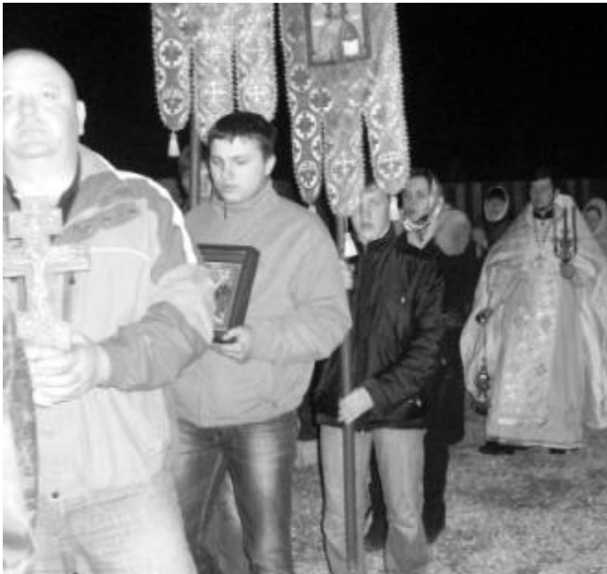
Крестный ход на Пасху

Разные. Есть люди, которые приходят с детьми. Конечно, на праздники собирается побольше народа. На Пасху было больше ста человек, в течение дня в Великую Субботу приходили освещать куличи человек