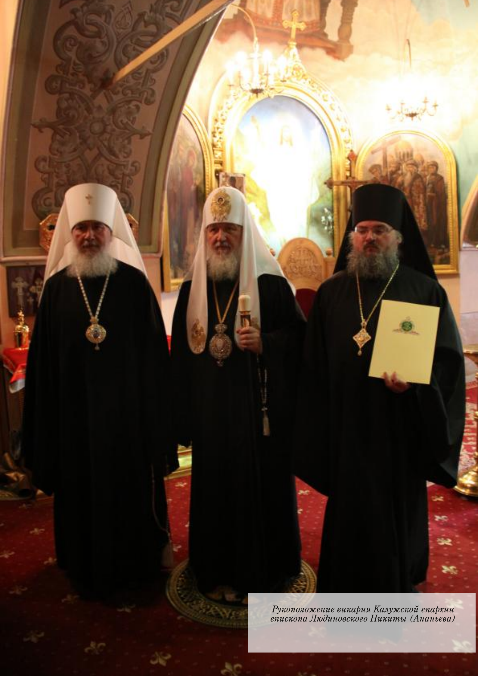
Рукоположение викария Калужской епархии епископа Людиновского Никиты (Ананьева)