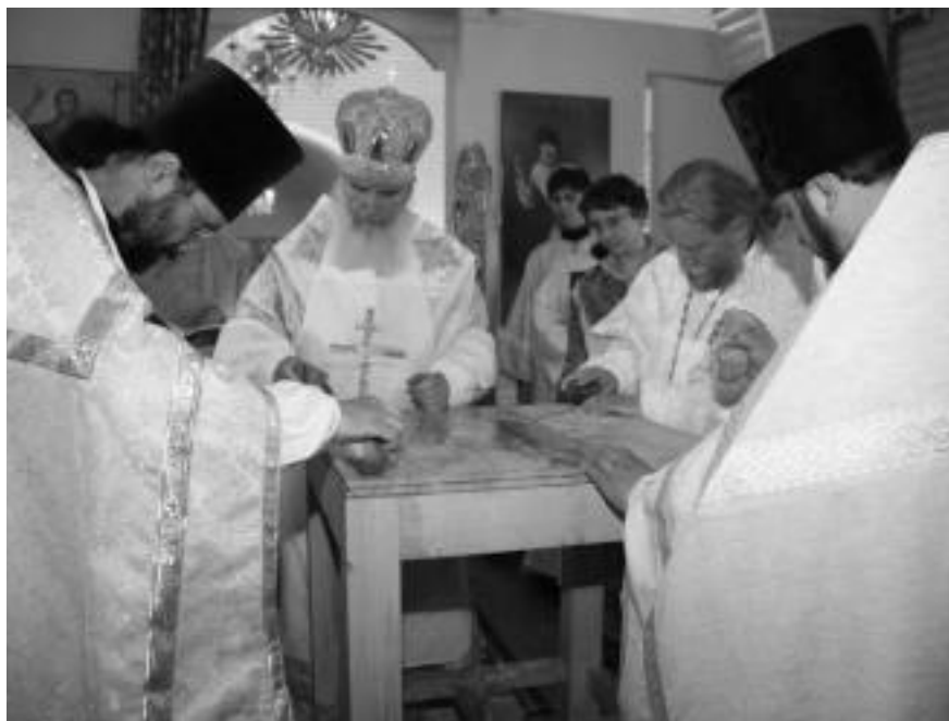
Освящение храма в честь Калужской иконы Божией Матери