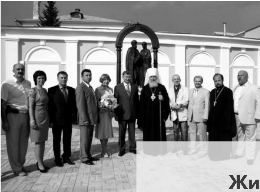
Открытие памятника святым благоверным князьям Петру и Февронии в г. Калуге