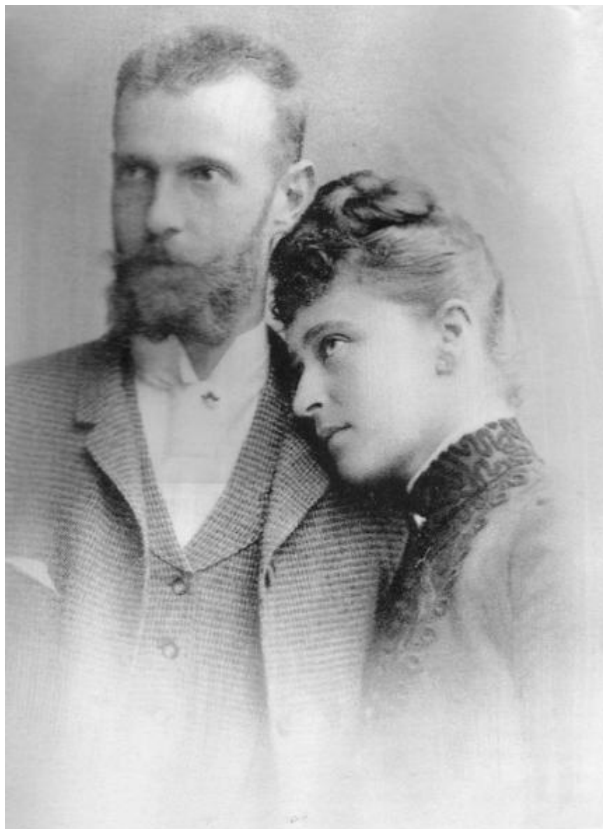
Елизавета Фёдоровна с супругом Сергеем Александровичем

Было приобретено собственное здание не в Москве, но недалеко от первопрестольной – в селе Всехсвятском. «Новому убежищу присвоено имя покойного Великого князя Сергея Александровича, еще при жизни завещавшего особь, пожертвованный ему капитал для обеспечения увечных и его супруги Великой