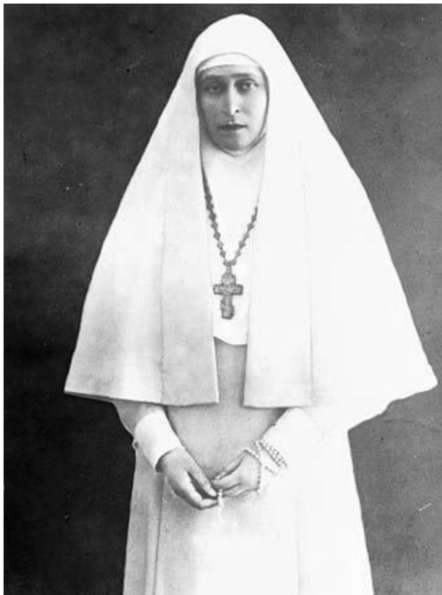
Елизавета Фёдоровна в одежде сестры Марфо-Мариинской обители

Как следует из сохранившихся документов, «для лучшего устройства убежища, некоторыми частными лицами, фирмами и подрядчиками от личного их усердия, без всякого на то вознаграждения были выполнены различные работы и пожертвованы некоторые предметы и деньги на следующие