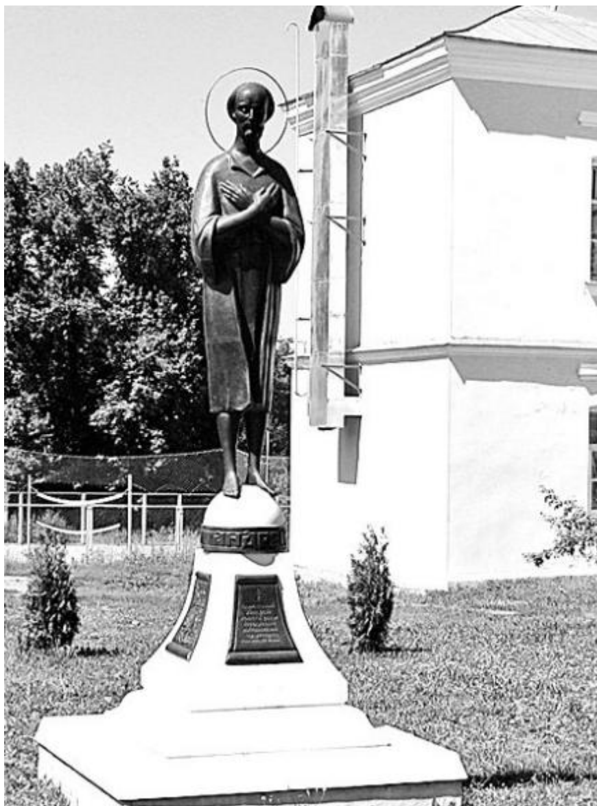
Памятник блаженному во дворе Центра «Воспитание», установленный в 2007 году в день памяти подвижника

Почитание блаженного не ослабевало после его кончины, а наоборот стало распространяться. На могиле часто служили панихиды, брали с нее песок и воду, «с топорика спущенную». По молитвам к юродивому люди получали исцеления, особенно часто это случилось с детьми. В 1840 году Мещовский край был избавлен от голода, а в 1848 году – от эпидемии холеры, что местные жители также связывали с именем блаженного Андрея. Позже глубокое почитание его памяти проявили воспитанники Мещовского духовного училища, которые регулярно посещали его могилу. В возрожденном Мещовском монастыре в наши дни память подвижника чтится 28 июня (по новому стилю – 11 июля).