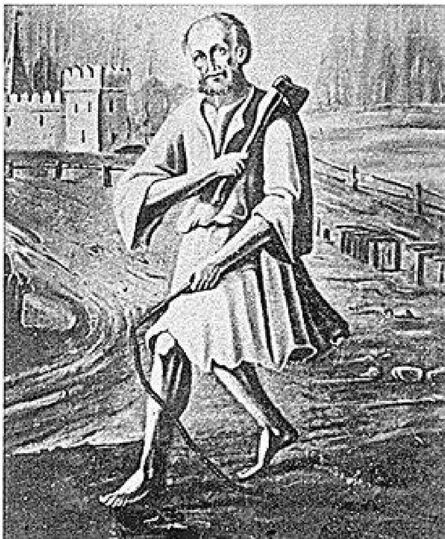
Прообраз иконы Андрея Мещовского

выводили из себя. Говорили, что он живет против уставов природы, нарушает житейские обязанности и обычаи. Андрею приходилось терпеть оскорбления и побои от крестьян и особенно от крестьянских детей. Последние называли его «Андрей топора», кидали в него камни. Но всё это блаженный переносил с кротостью и лишь старался удаляться от тех мест, где его обижали. Вскоре люди увидели его с другой стороны. Однажды юродивый пришел в деревню Староселье в тот момент, когда крестьяне сеяли рожь. Один крестьянин в насмешку предложил ему засеять полосу. Андрей согласился и стал сеять, повторяя при этом: «Пропало, замёрзло!» Попросил о