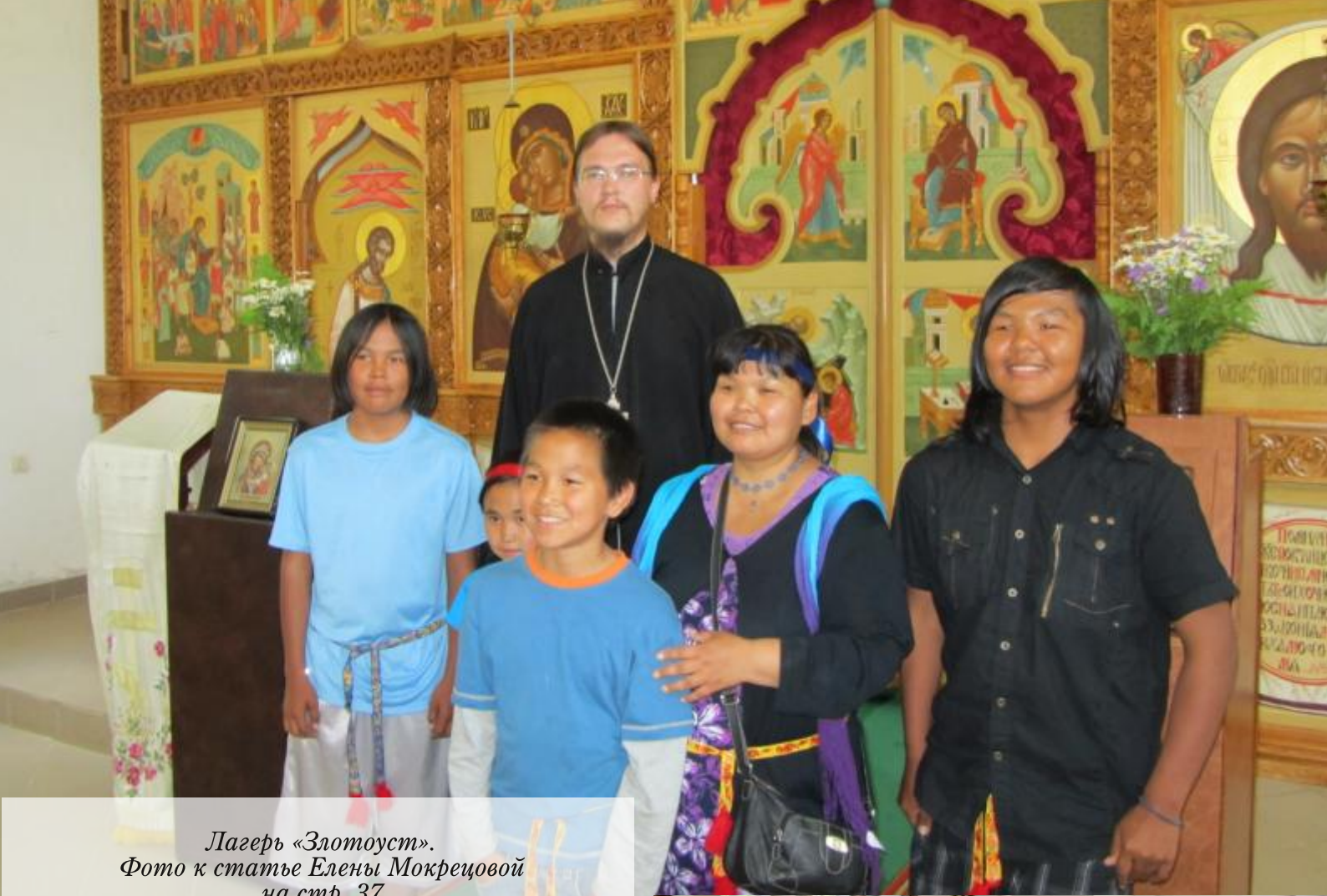
Лагерь «Златоуст». Фото к статье Елены Мокрецовой на стр. 37