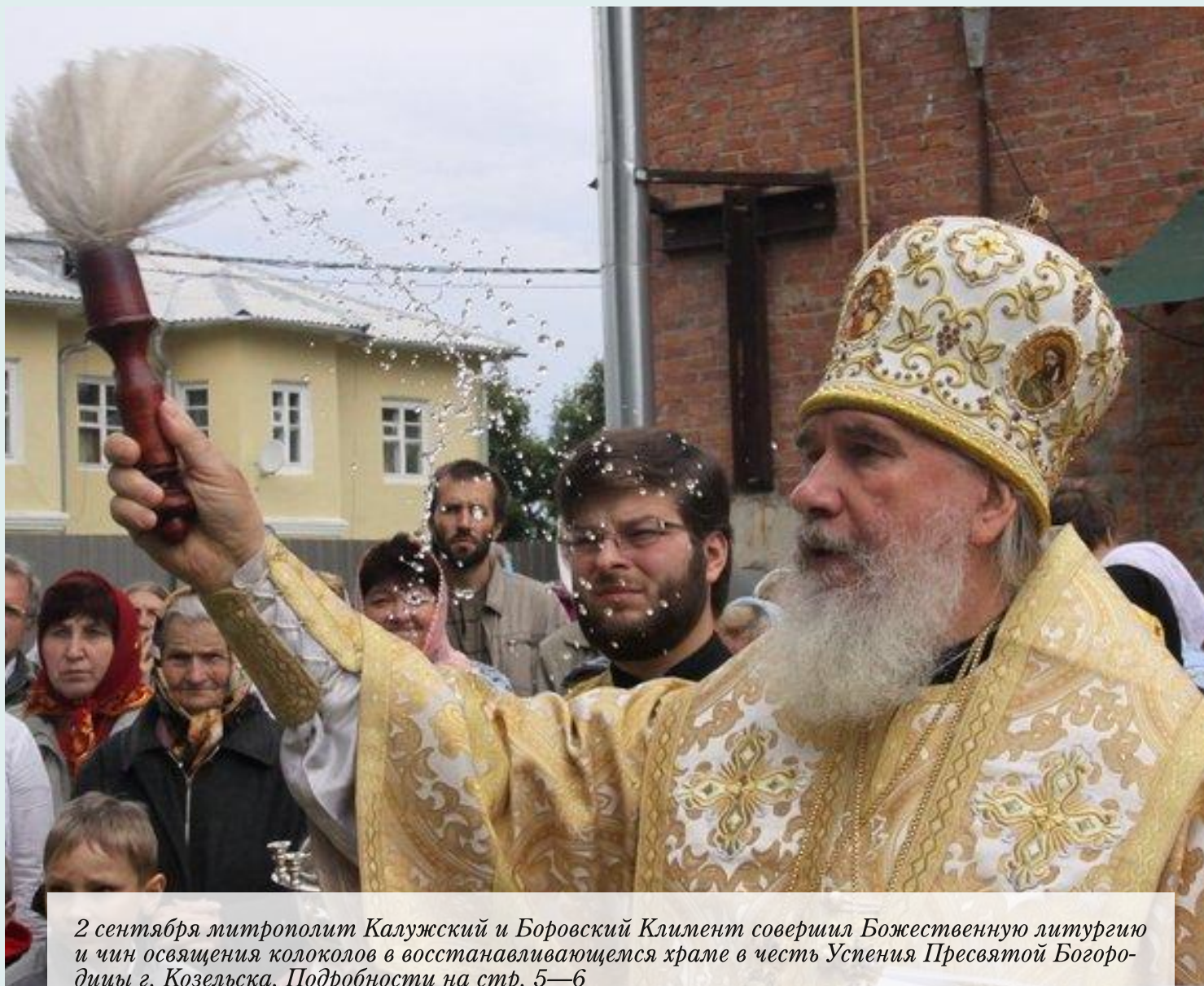
2 сентября митрополит Калужский и Боровский Климент совершил Божественную литургию и чин освящения колоколов в восстанавливаемом храме в честь Успения Пресвятой Богородицы г. Козельска. Подробности на стр. 5—6