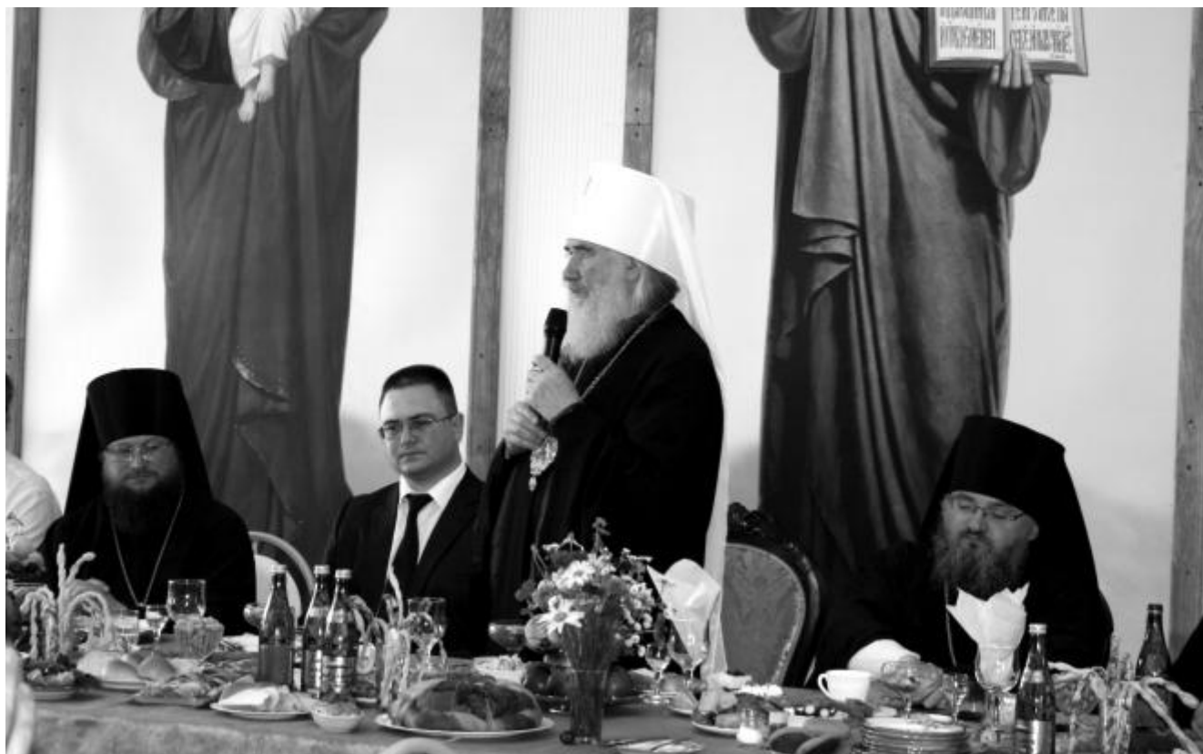
Слово владыки к собравшимся