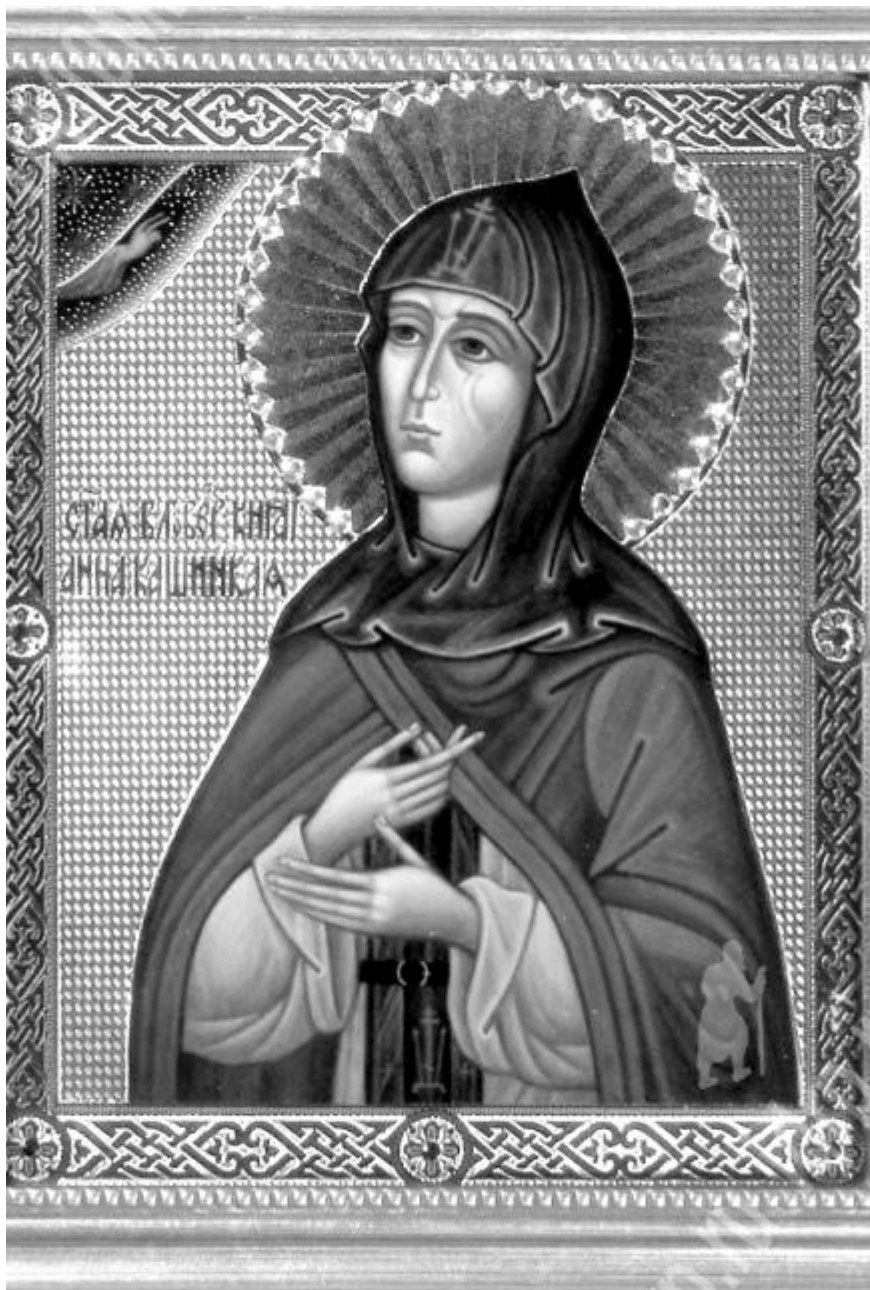
Святая благоверная княгиня Анна Каши́нская

Церковь признает его законным, но Таинство Венчания освящает этот брак, благословляет его, он становится благодатным. В нем мы получаем Божье благословение на брак и по молитвам Таинства Господь его укрепляет, подает супругам именно помощь в преодолении вот этих испытаний, которые могут ожидать людей в совместной жизни. Конечно, и венчанные браки распадаются, но именно потому, что человек имеет свободу выбора: совершать добро или зло, совершать грех или ис-