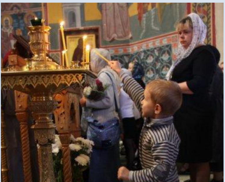
В Калужской духовной семинарии и Калужской православной гимназии начался учебный год.