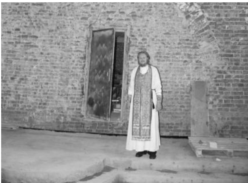
Начало восстановления храма