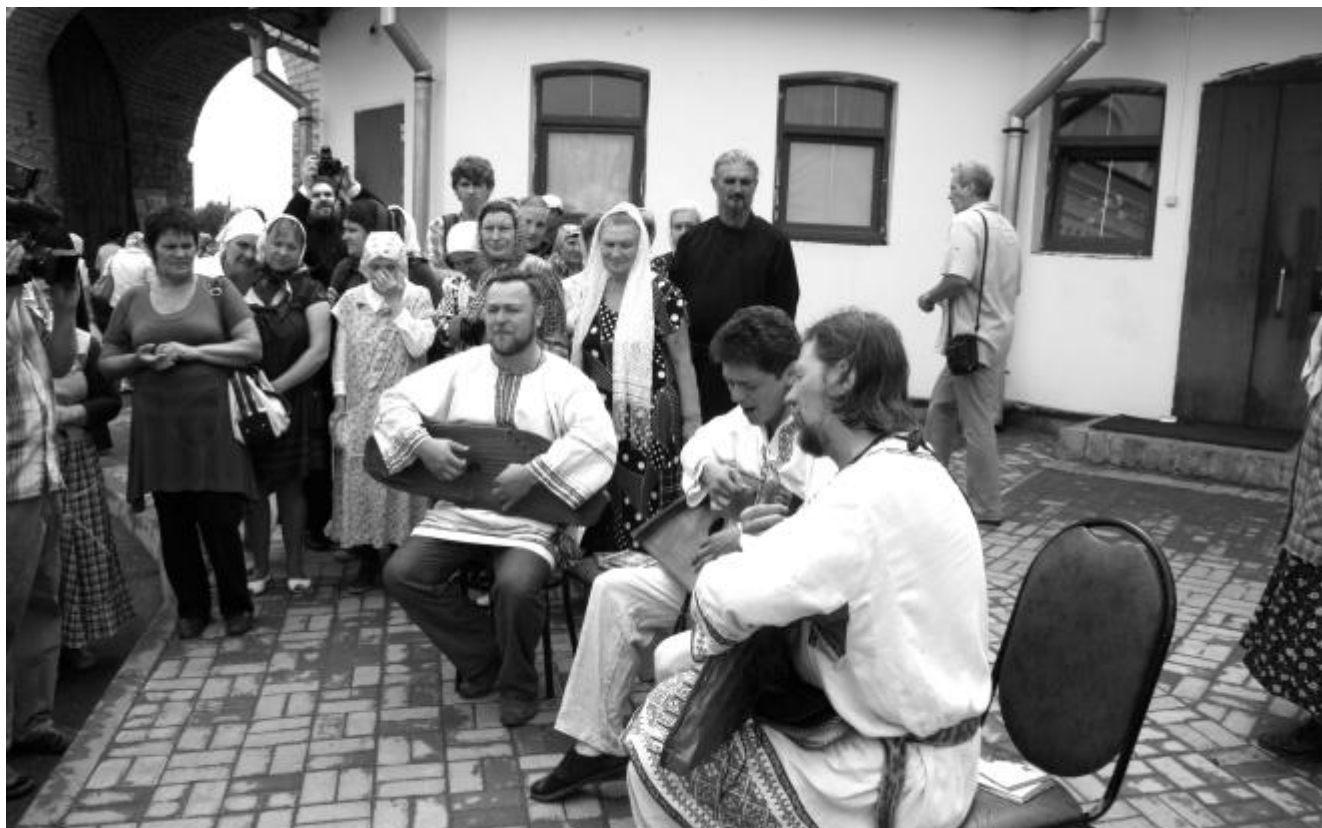
Выступление ансамбля гуслей

Место почитания блаженного ещё будет благоукрашаться, со временем здесь планируется постоянное моление — Параклис: ежедневное поочередное дежурство насельников в часовне. Читая Псалтирь, акафисты, каноны, каждый из них вознесёт свои молитвы вместе с блаженным Андреем и обо всех нас.