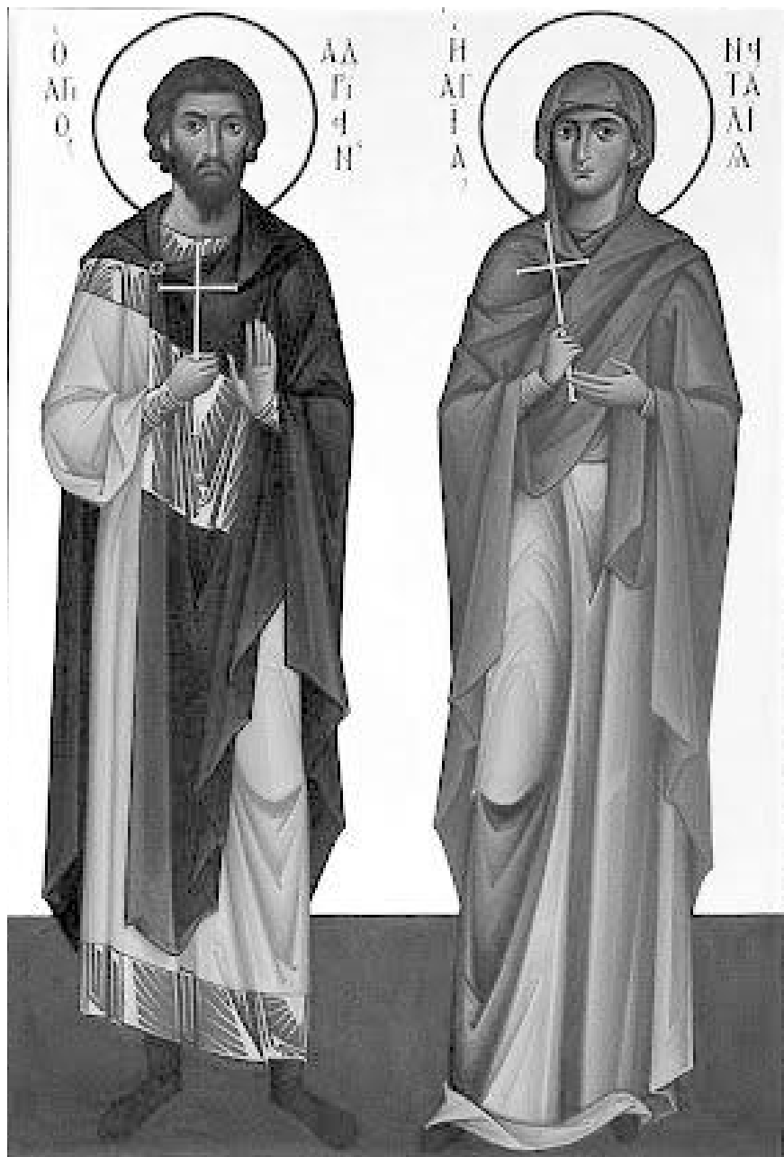
Мученики Адриан и Наталья

В связи с этим несколько слов о венчании. Вот я недавно подвозил человека, он узнал, что я священник, и спрашивает: «Батюшка, можно вам вопрос задать? Вот мы с женой любим друг друга, хотим повенчаться. Как нам быть, мы не расписаны». Я говорю: «Как. Пойти в загс и расписаться». Он говорит: «Да вы что. Разве для церкви важен штамп в паспорте?» Я говорю: «Нет. Но живя в светском обществе, Церковь должна придерживаться тех законов, которые установлены в государстве. И государство признает супружеский союз только при его законной регистрации. И только при этом церковь может венчать супругов. Почему вы не регистрируете свои отношения?