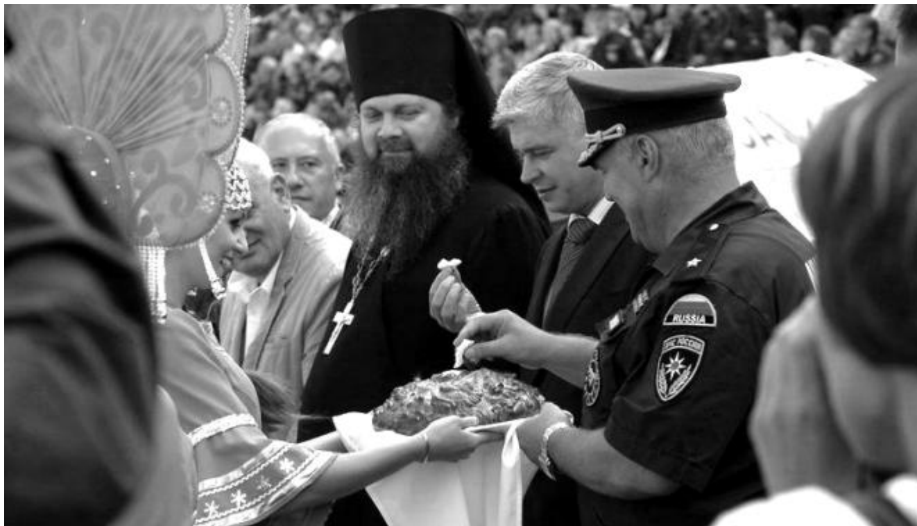
Открытию Всероссийских открытых соревнований на Кубок МЧС России по пожарно-прикладному спорту