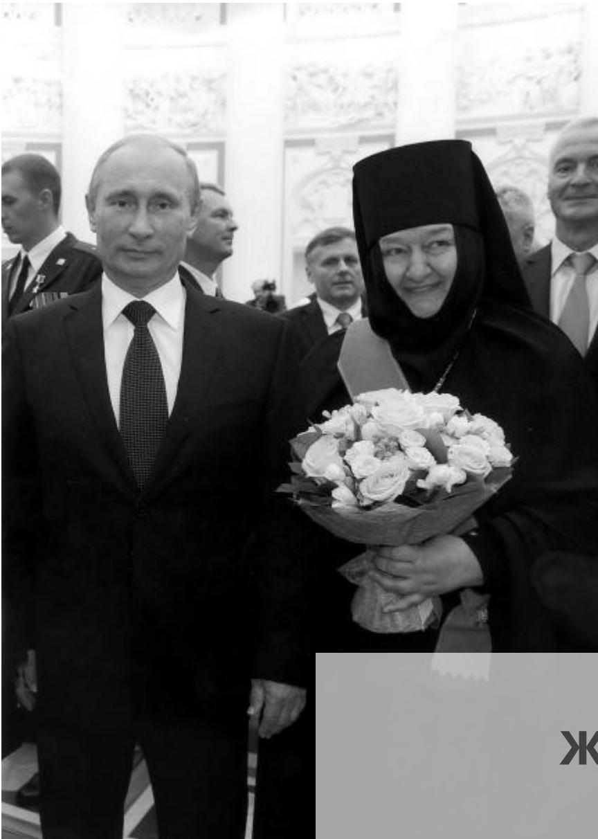
В.В. Путин и игуменья Николая (Ильина)