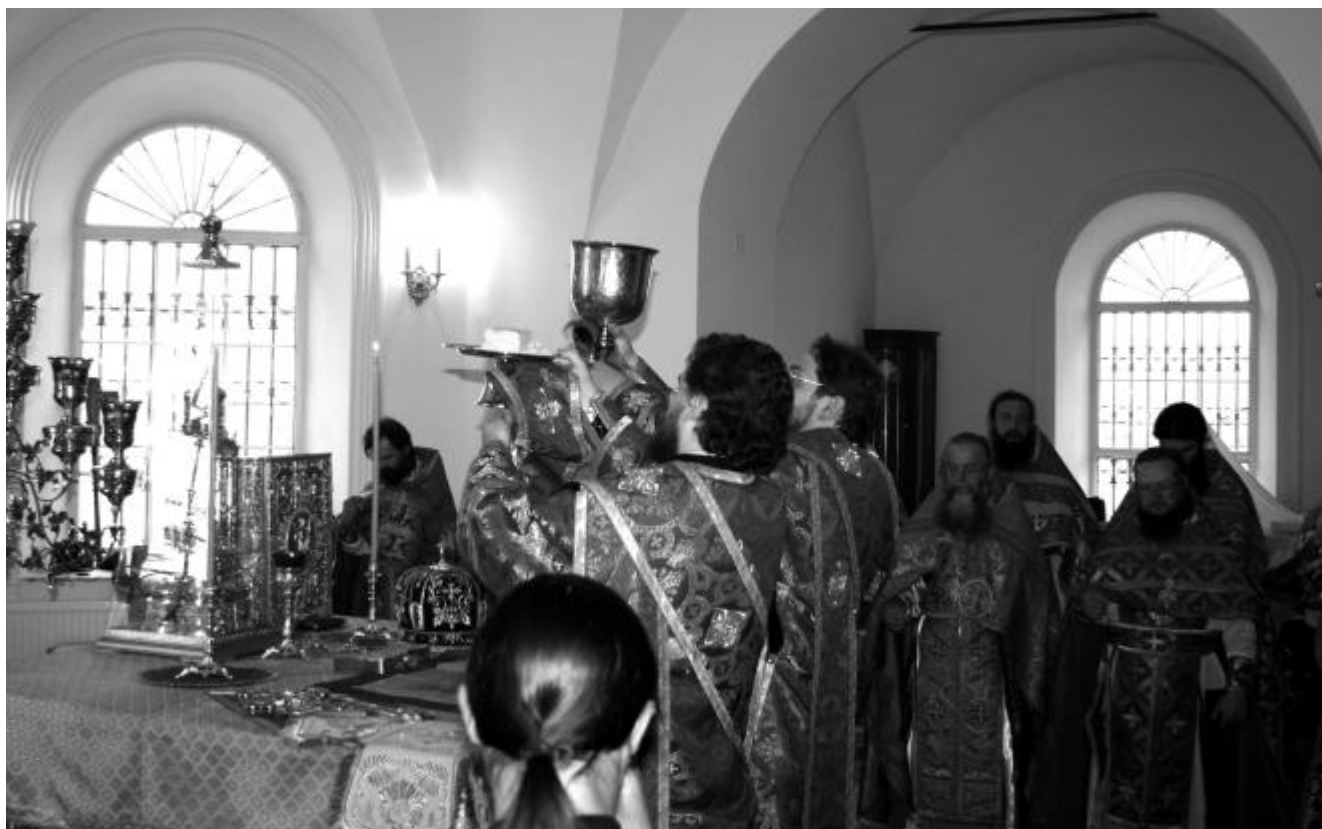
Литургия в храме анн. Петра и Павла

зать, сколько метаний и страстей пришлось здесь пережить, тем не менее нас внутренне это стало преображать. Объединение власть предержащих, работников культуры, журналистов, сотрудников педагогического сообщества состоялось на генетическом уровне. Все мы вместе с братией монастыря стали едины в неосязаемом пространстве, в глубинах нашего коллективного начала. Очень бы хотелось, чтобы та модель взаимоотношений, которая выстроилась в Мещовске, состоялась во всей России. Почему? Да потому что нам этого остро не хватает в масштабах нашей огромной страны. В глубине русского народа сейчас происходит раздвоение сознания. В душе разделены Церковь, общество, государство. Любые потрясения, которые посылает нам Господь, в частности, недавняя трагедия в Краснодарском крае, показывают, что народ не доверяет власти, а власть не знает, как это объяснить народу. Внутрен-