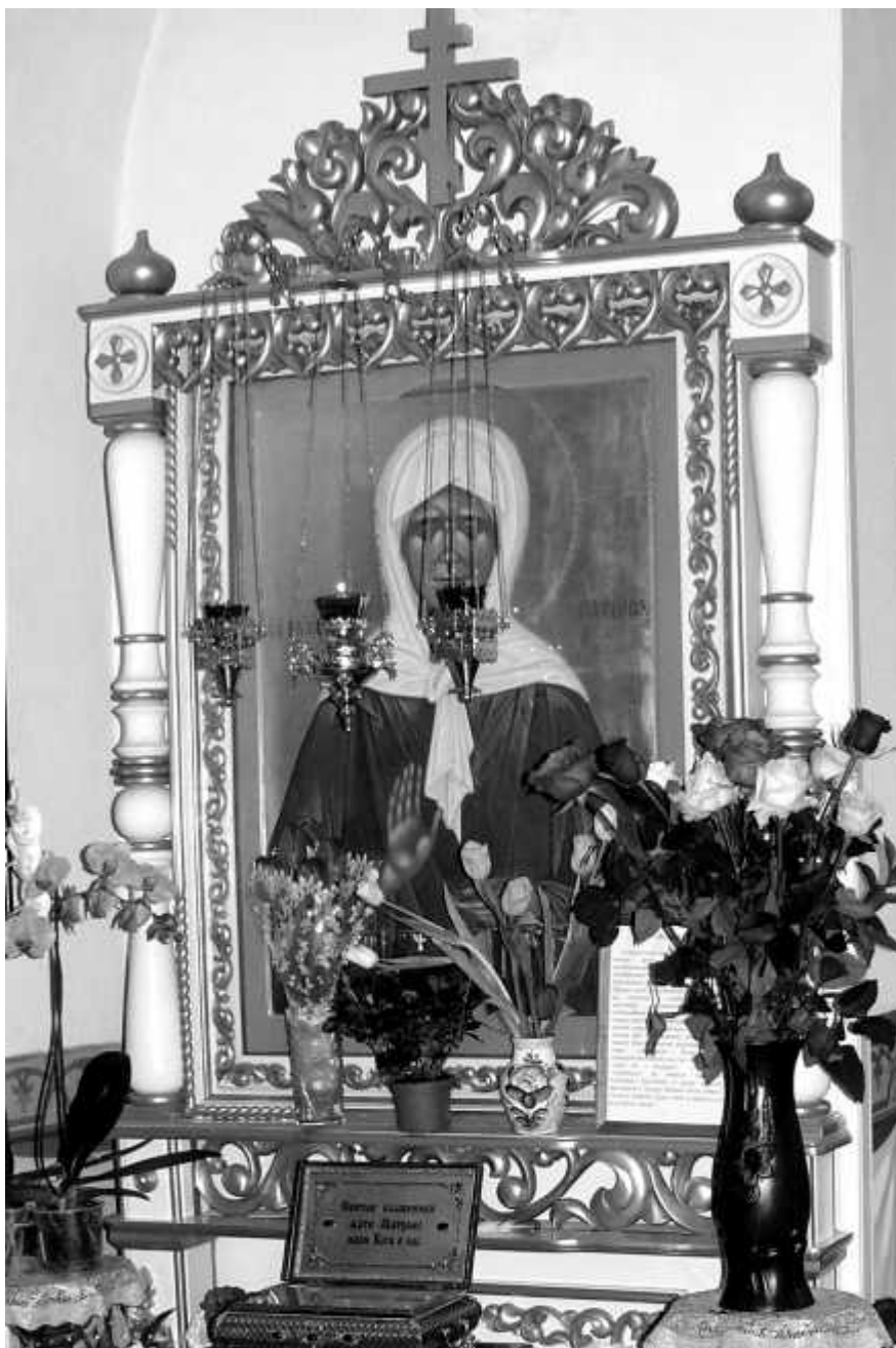
Икона блаженной Матроны Московской и частица мощей святой

прежнему благодаря заботам причта, в первую очередь, настоятелей, церковных старост и пожертвованиям прихожан отличался великолепием и ухоженностью. Во время обозрения калужских церквей Его Преосвященством. Преосвященнейшим епископом Виталием в 1891 году отмечалось, что Никитский храм посещают не только постоянные прихожане, приписанные к приходу. Обозревая Никитскую церковь Преосвященнейший