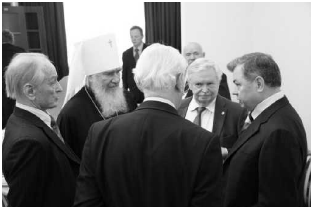
Во время работы XIV съезда Союза писателей России

В завершение встречи Предстоятель Русской Церкви благословил учащихся гимназии и верующих.