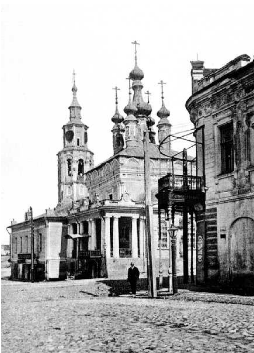
Храм в XIX веке

Церковные службы собирают в обновленном храме много прихожан, объединенных молитвенной радостью и преклонением перед возрожденным из забвения домом Божьим. Да, и во внеслужебный период храм не пустует: идут стар и мал, чтобы заказать требы, поставить свечу — свой малый дар Богу. По-прежнему храм освящен в честь Рождества Пресвятой Богородицы, а правый придел в честь великомученика Никиты. Но, как в былые времена, чаще храм называют Никитским, ведь так повелось издавна. Даже в документах (духовных росписях, метрических