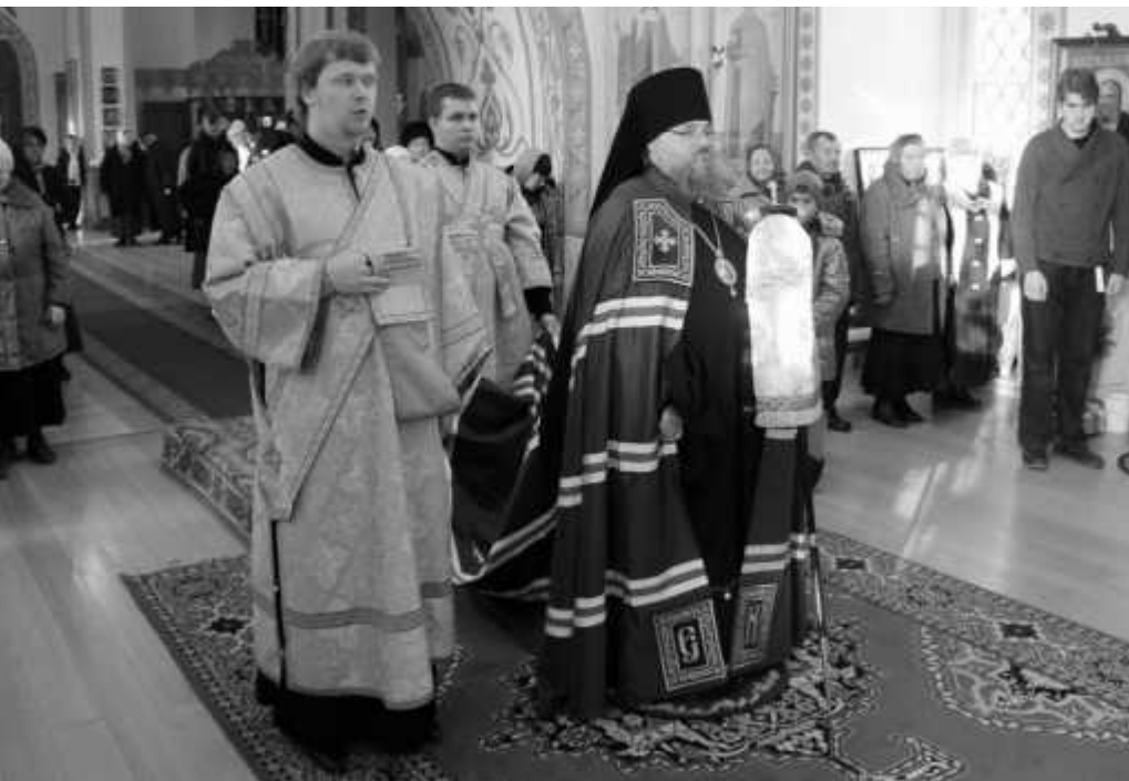
Всенощное бдение в храме Сошествия Святого Духа города Козельска