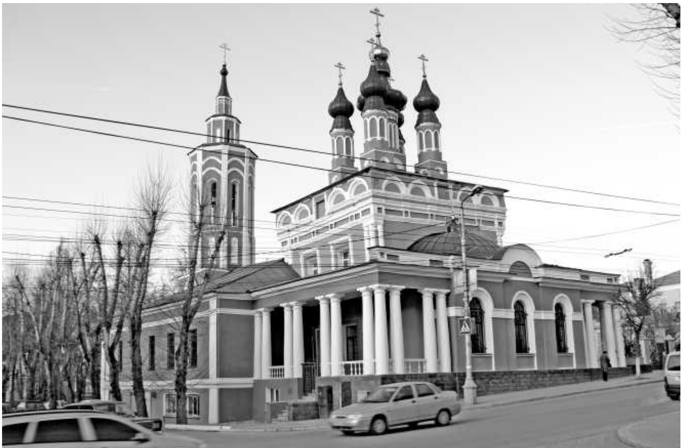
Никитский храм сегодня

Мы в праздники и в будни не устаем повторять: «Святой великомученик Никита, моли Бога о нас».