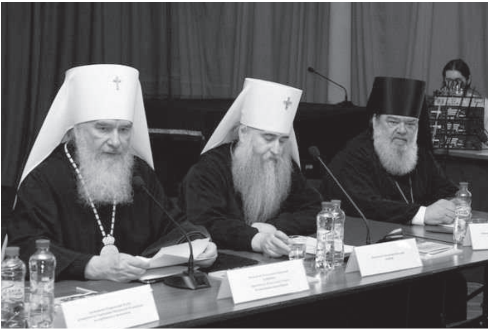
Заседание общего собрания членов Издательского Совета Русской Православной Церкви