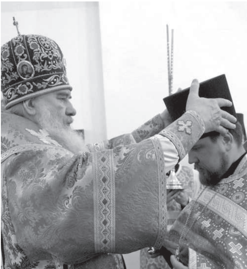
Литургия в храме в честь Преображения Господня подворья Свято-Пафнутьева Боровского монастыря