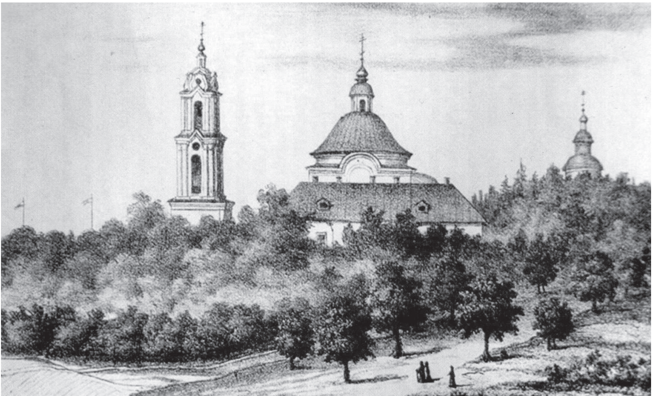
Калужский Свято-Лаврентьевский монастырь

Митрополит Иона (в миру Иван Семенович Васильевский) родился 1 марта 1763 года в Калуге в бедной семье причетника-иконописца церкви св. Василия Блаженного. В 15 лет определен в Калужскую семинарию, в которой учился в течение четырех лет (1777–1781), по другим данным, с 1779-го по 1782-й. Как круглый сирота, находился на государственном обеспечении. Со слов самого Ионы, его биограф записал, какие тот испытывал лишения во время учебы в Калужской семинарии. «Шесть дней в неделю Васильевский проводил в семинарии, не скидая с плеч ни зимой, ни летом, ни днем, ни ночью овчинной шубы, данной ему бабушкой; по субботам же, когда отпускали его к слепой старушке, жившей при церкви в богадельне, горемычный мальчик вынужден был водить убогую старицу с сумою за плечами по городу,