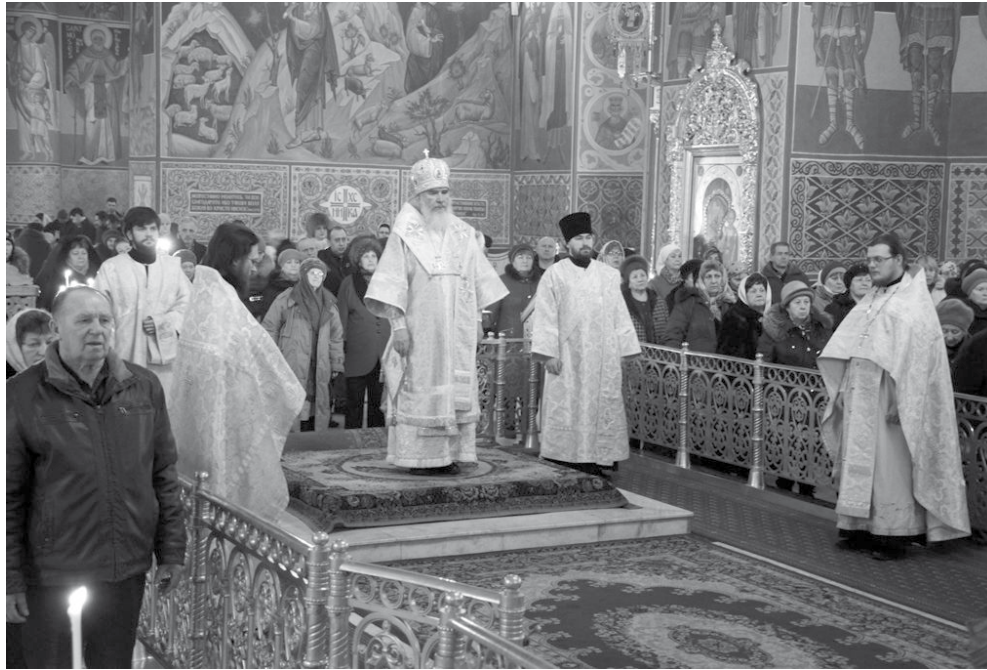
Праздничная Божественная литургия в Свято-Троицком кафедральном соборе