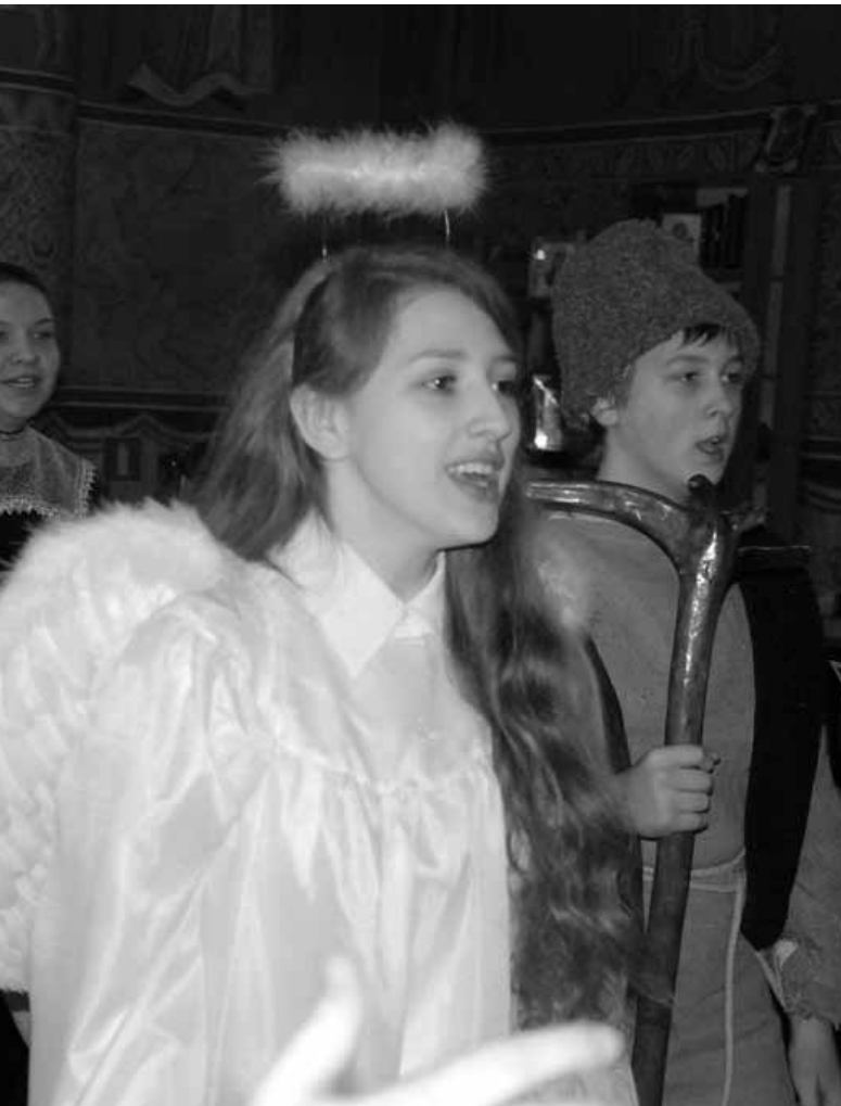
Выступление детского хора «Веснянка»

Губернатор рассказал о планах регионального правительства на предстоящий период и положительно оценил деятельность Общественной па-