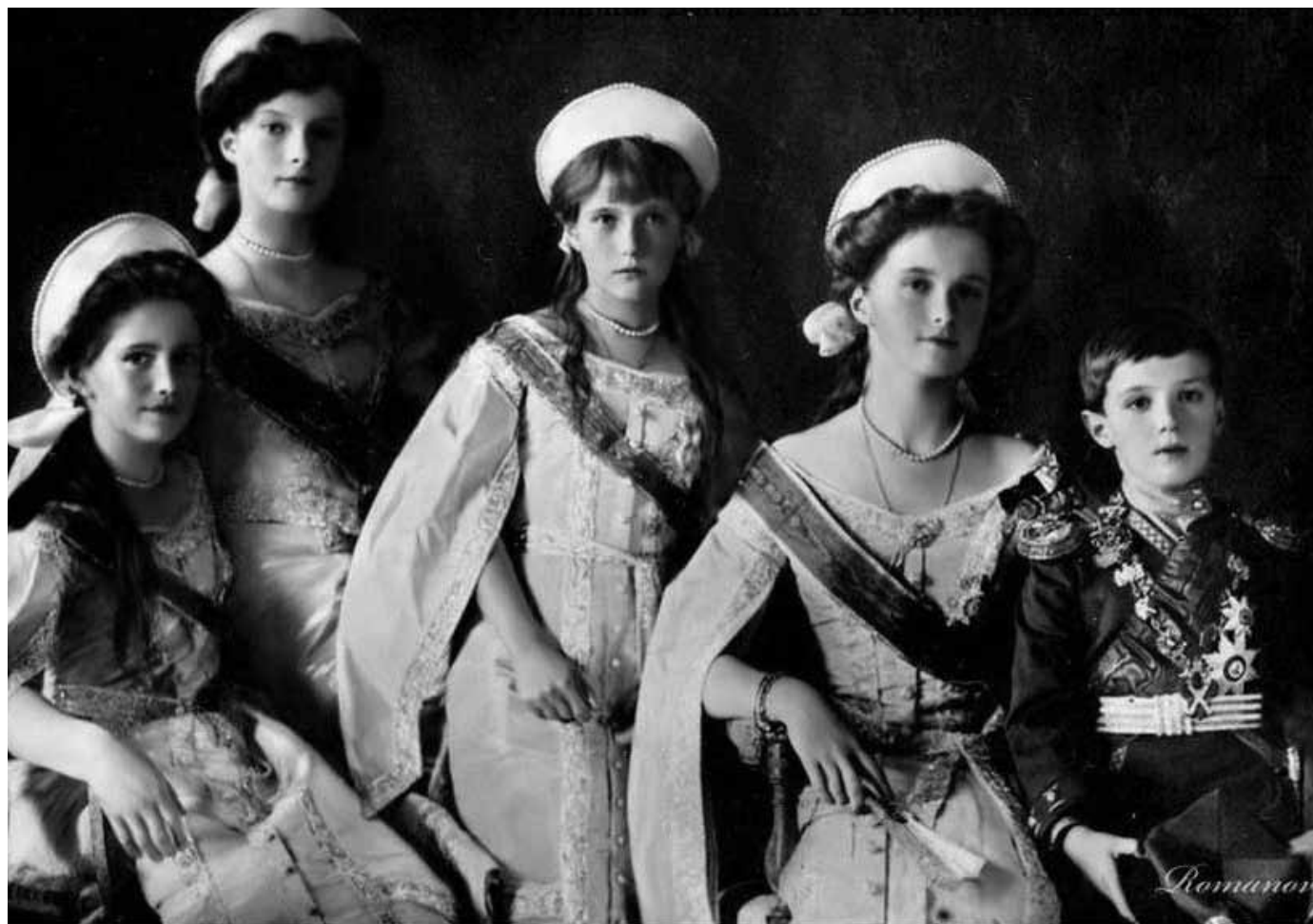
Дети императорской семьи, великие княжны Мария, Татьяна, Анастасия, Ольга и цесаревич Алексей

Родители иногда грешат чрезмерным беспокойством или неумными и постоянно раздражающими увещаниями, но сыновья и дочери должны согласиться с тем, что в основе всей этой чрезмерной заботливости лежит глубокая тревога за них.