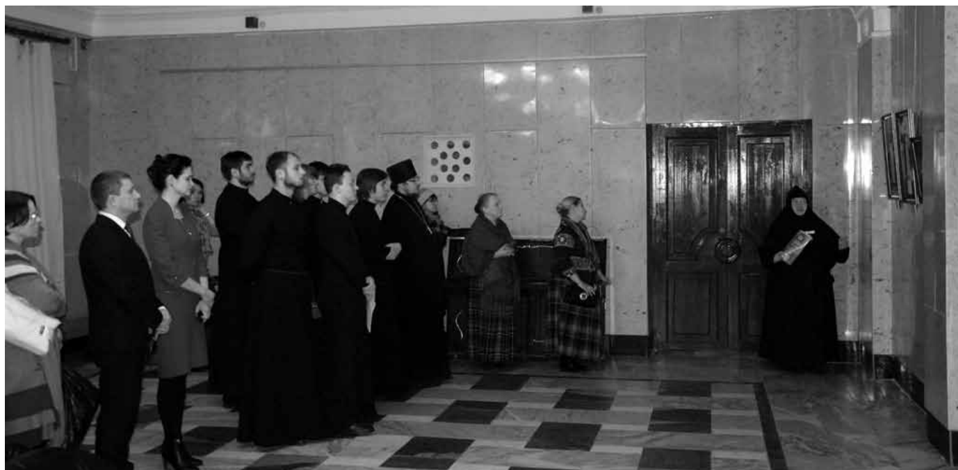
Открытие передвижной выставки, посвященной святому равноапостольному князю Владимиру и Крещению Руси