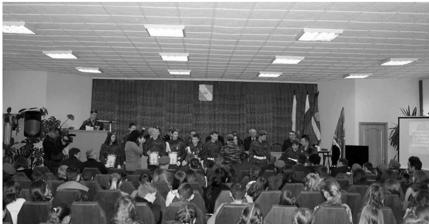
Торжественное закрытие «Вахты памяти-2014»

В завершении все участники мероприятия возложили цветы к памятнику «Танк» в честь павших при обороне и освобождении Медынского района в годы ВОВ.