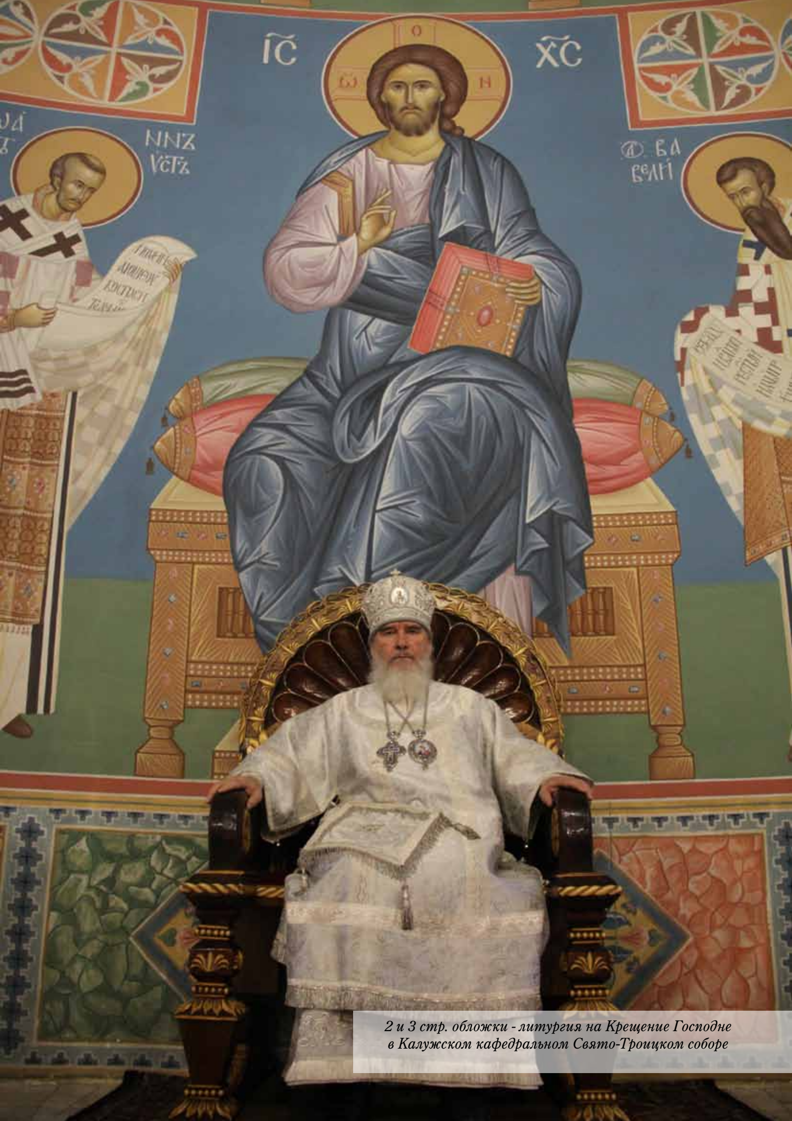
2 и 3 стр. обложки - литургия на Крещение Господне в Калужском кафедральном Свято-Троицком соборе