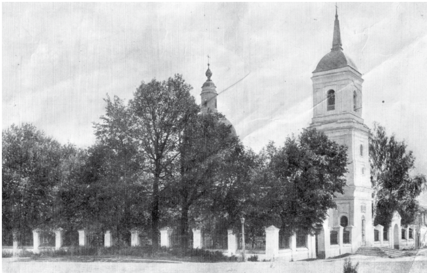
Преображенский храм села Нижние Прыски в 1911 г.