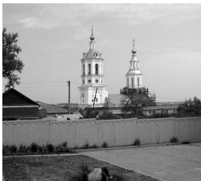
Никольский храм г. Козельска

В 1895 году были пожертвования в сумме 100 рублей в храм с. Покровского Козельского уезда (второе по счету пожертвование в этот дом Божий), 100 рублей на благоустройство храма с. Стрельня Мещовского уезда. Нужно отметить, что пожертвования повторялись не только в церковь в честь Покрова Пресвятой Богородицы