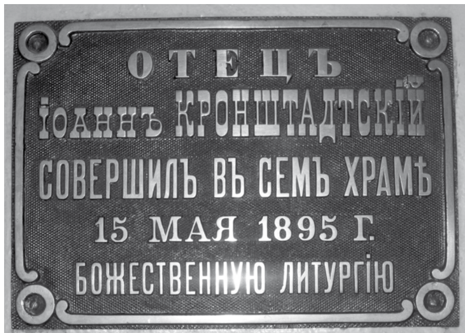
Памятная доска а алтаре храма Георгия (за верхом) г. Калуги