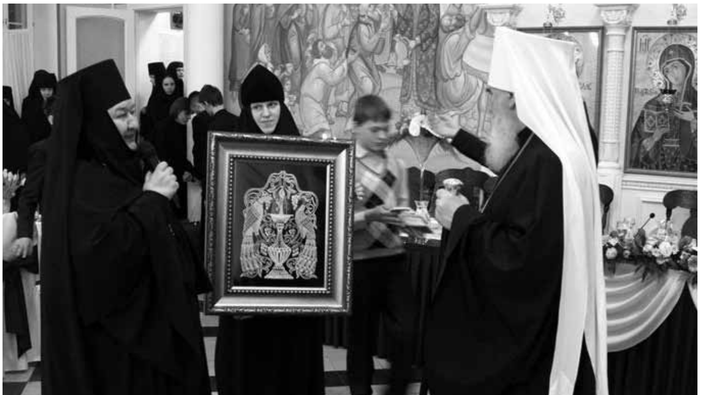
Визит митрополита Калужского и Боровского Климента в Свято-Никольский Черноостровский монастырь города Малоярославца

Митрополит Климент к празднику Святой Пасхи наградил правом служения Божественной литургии с открытыми цар-