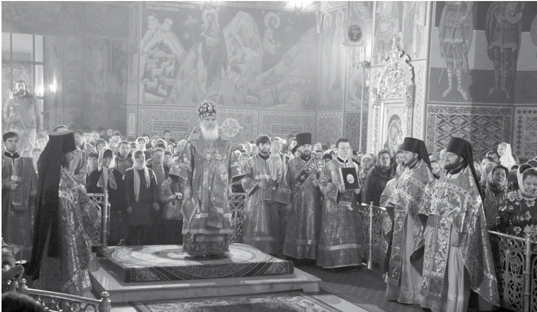
Пасхальное богослужение в Свято-Троицком кафедральном соборе