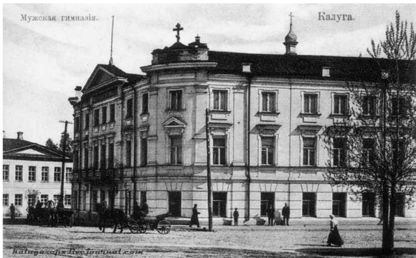
Домовый храм Николаевской гимназии