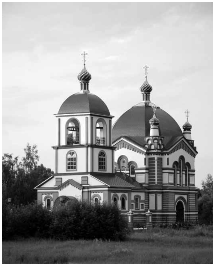
Храм в честь Рождества Христова п. Товарково

Уже 15 июля КЕВ помещают рапорт отца благочинного о пожертвованиях на построение нового каменного храма вместо сгоревшего. Данный рапорт за № 366 был заслушан 8 июня в КДК. К большой радости жителей с. Кременского первый