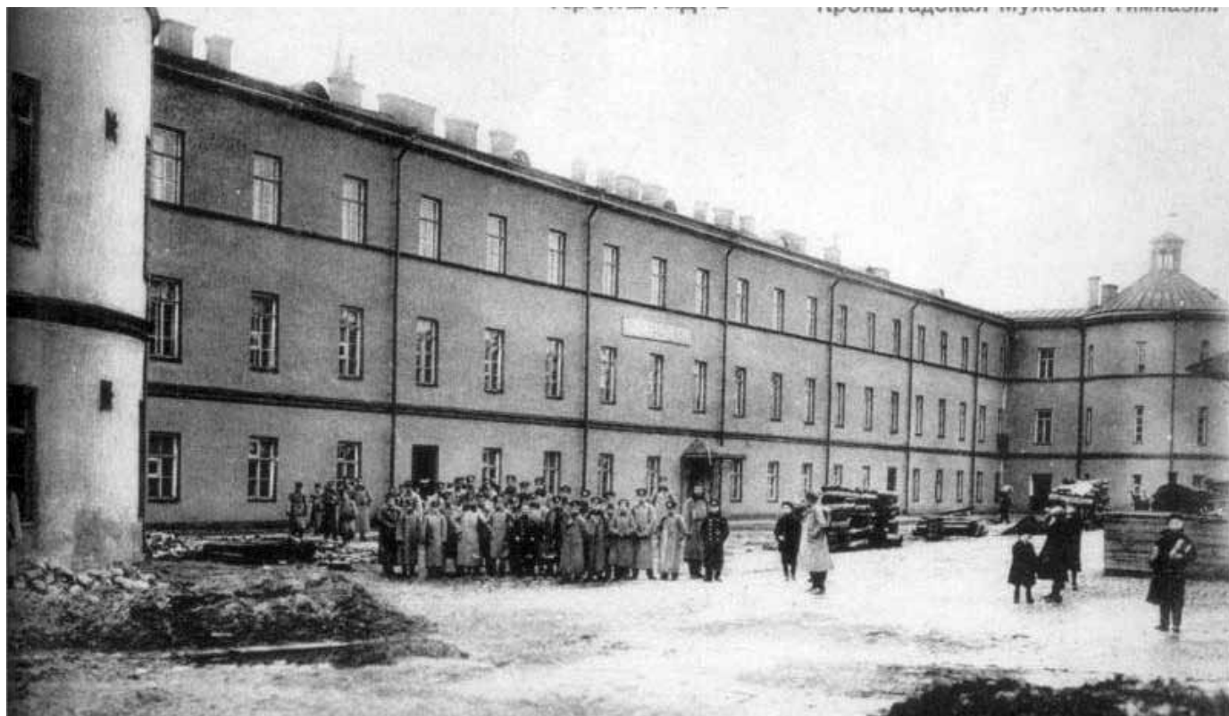
Кронштадтская мужская гимназия

Не случайно во всех своих поездках по необъятным просторам России, о. Иоанн не уставал посещать учебные заведения и встречаться с семинаристами, студентами различных учебных заведений, гимназистами. География мест, которые посетил отец Иоанн в своем окормлении пра-