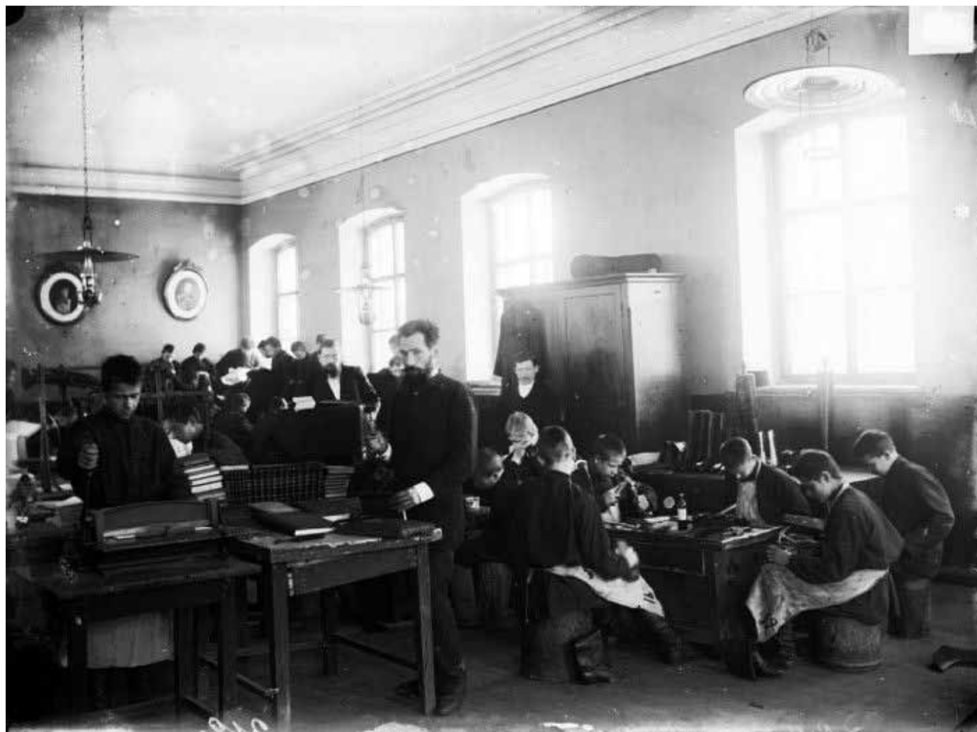
Обучение подростков в мастерской дома трудолюбия