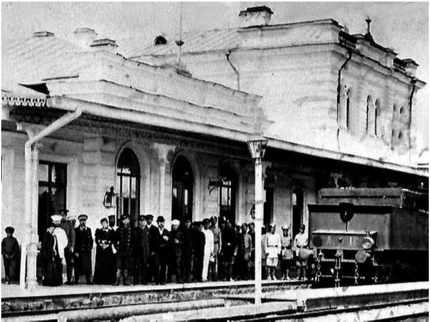
На этом вокзале калужане встречали о. Иоанна Сергеева

принося исцеление, даря здоровье физическое и духовное всем без исключения: тем, кто мог вознаградить богатыми пожертвованиями, и нищим, которые сами пребывали в бедности.