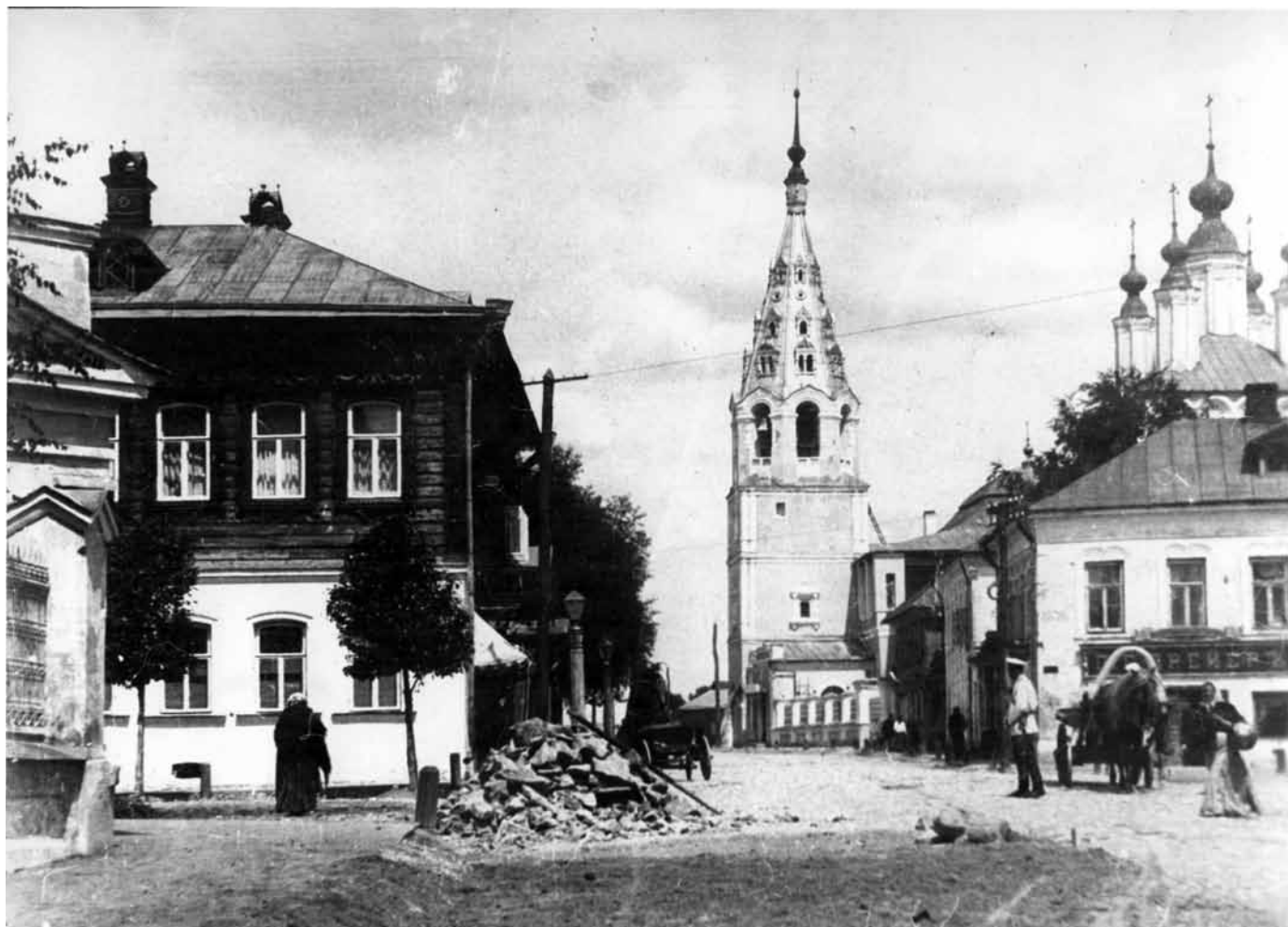
Церковь Георгия (за верхом), г. Калуга

Таким образом, калужане знали о благотворительной и молитвенной помощи кронштадтского пастыря не только со слов паломников, которые побывали в Кронштадте, но и по публикациям в местной прессе. И, как явствует из уже приведенных примеров, каждый, кто был знаком с этой информацией, был поражен тем, как в разных жизненных, иногда чисто бытовых ситуациях, отец Иоанн всегда был готов прийти на помощь людям, не разделяя их на богатых и бедных,