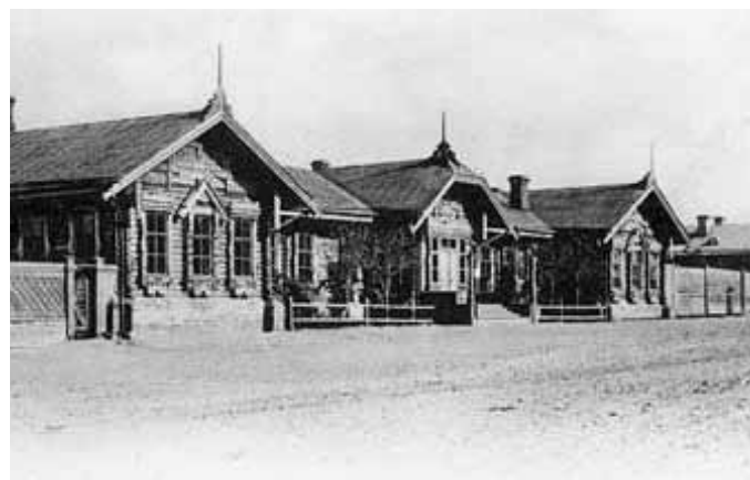
Работный дом в Калуге