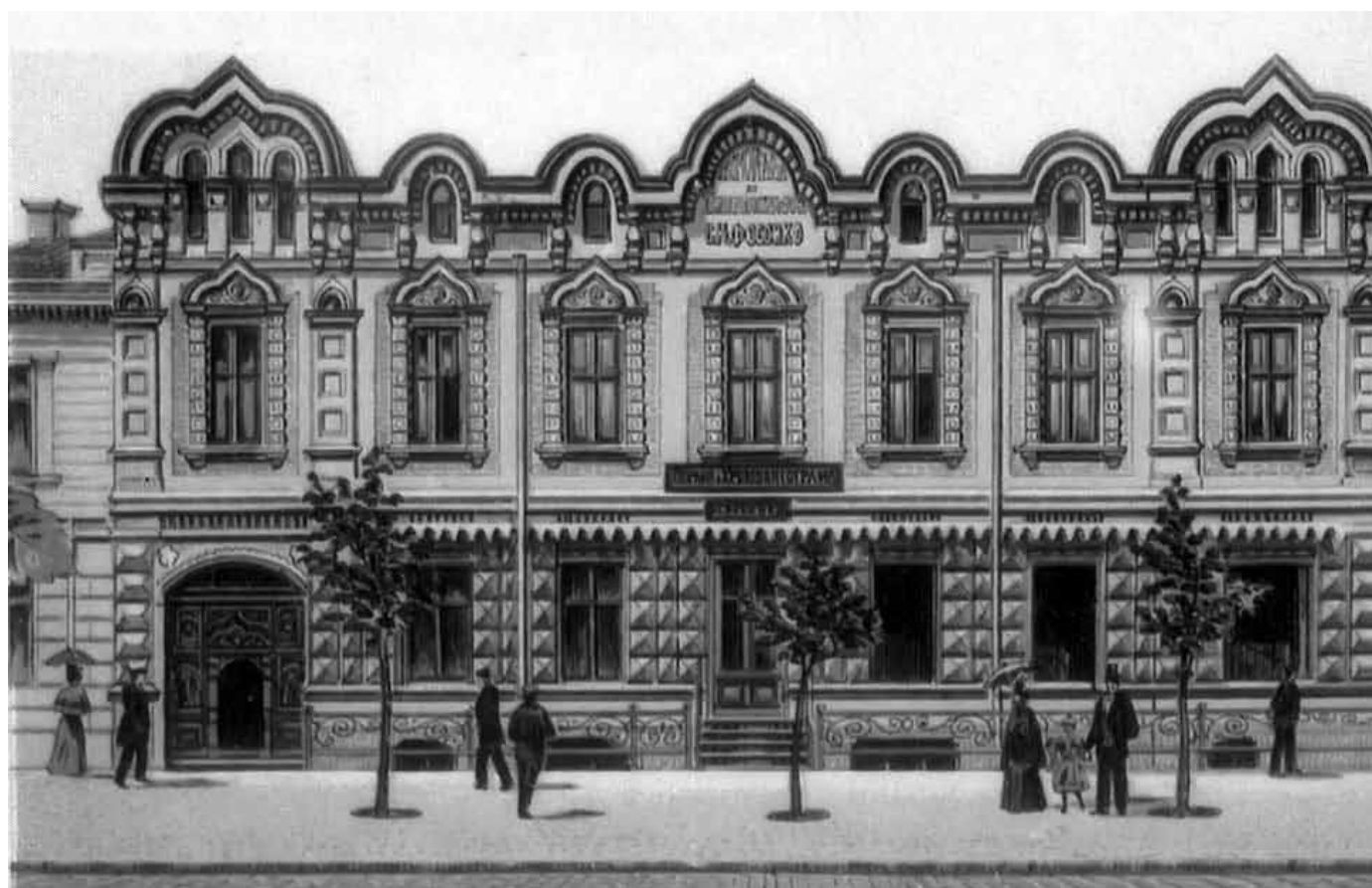
Здание книгоиздательства в Одессе