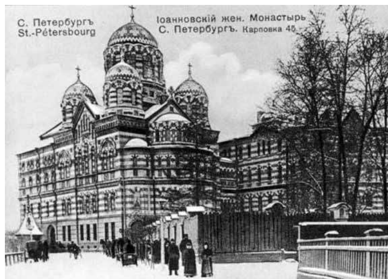
Иоанновский женский монастырь. Санкт-Петербург

На смену девятнадцатому веку пришел полный событиями двадцатый. Многое менялось, но традиции благотворительности отца Иоанна Кронштадтского и его благородное стремление помогать сельским храмам Калужской епархии сохранились. В 1901 году кронштадтский пастырь жертвует средства на строительство нового ка-