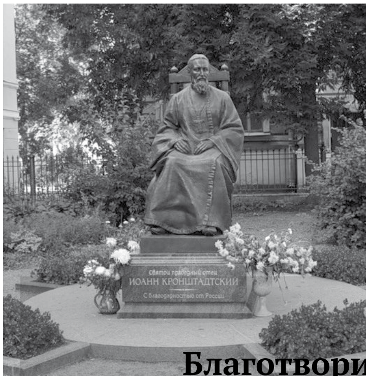
Памятник св. праведному Иоанну Кронштадтскому в Кронштадте