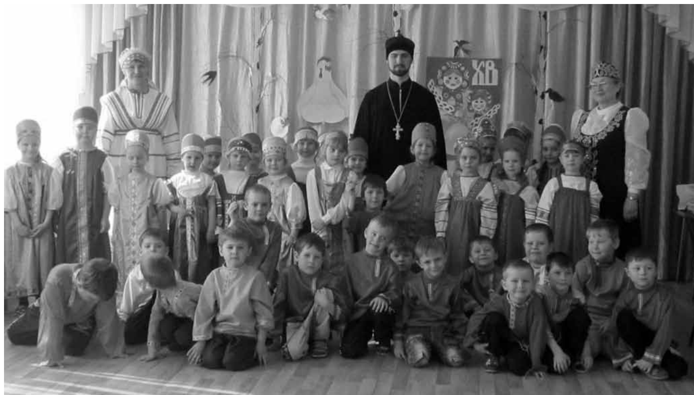
Пасхальный утренник в МКДОУ «Детский сад «Аленький цветочек» п. Полотняный Завод

Документы, постановления Правительства РФ, решения Оргкомитета, обращения и поздравления официальных лиц опубликованы в разделе «Документы».