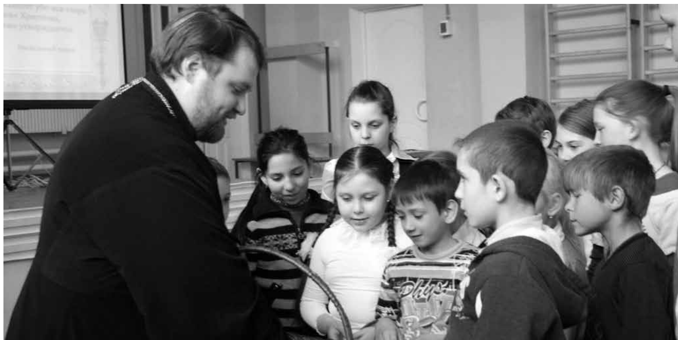
Среда Светлой седмицы в Дугнинской средней школе

В завершение торжества для учащихся и педагогов был показан фильм «Пеликан» (реж. О. Орле) по роману французского писателя Э. Бусе «Никостратос». Фильм рассказывает о приключениях греческого подростка Яниса, его удивительной дружбе с розовым пеликаном Никостратосом, который помог ему и всем жи-