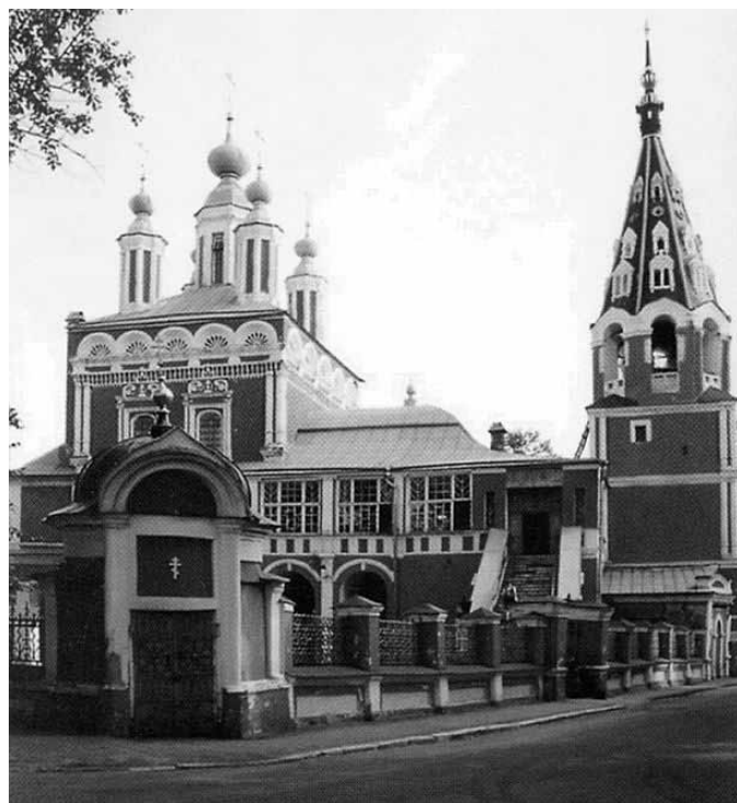
Храм Георгия (за верхом), г. Калуга

Если и сегодня эта информация поражает нас, то, как же были удивлены такими суммами благотворительности отца Иоанна Кронштадтского наши предки! Тем более поток подобной инфор-