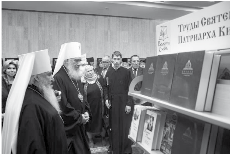
На выставке «Радость Слова» в Казани