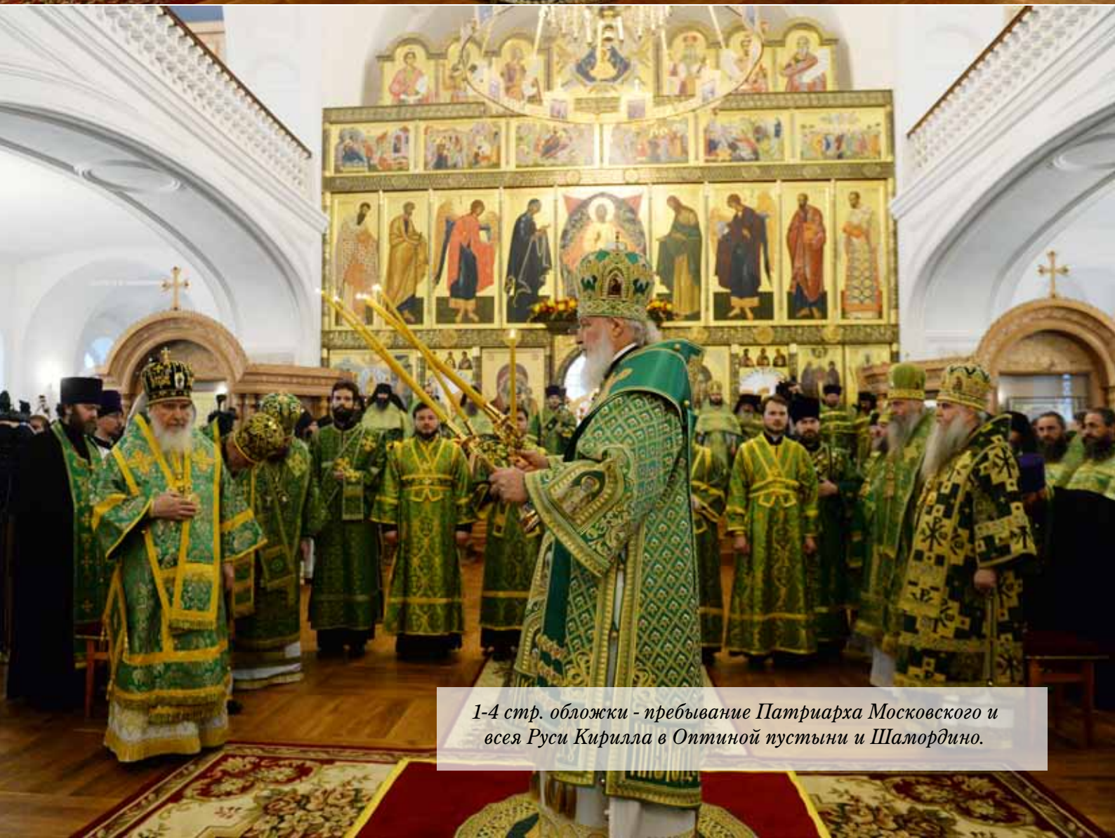
1-4 стр. обложки - пребывание Патриарха Московского и всех Руси Кирилла в Оптиной пустыни и Шамордино.