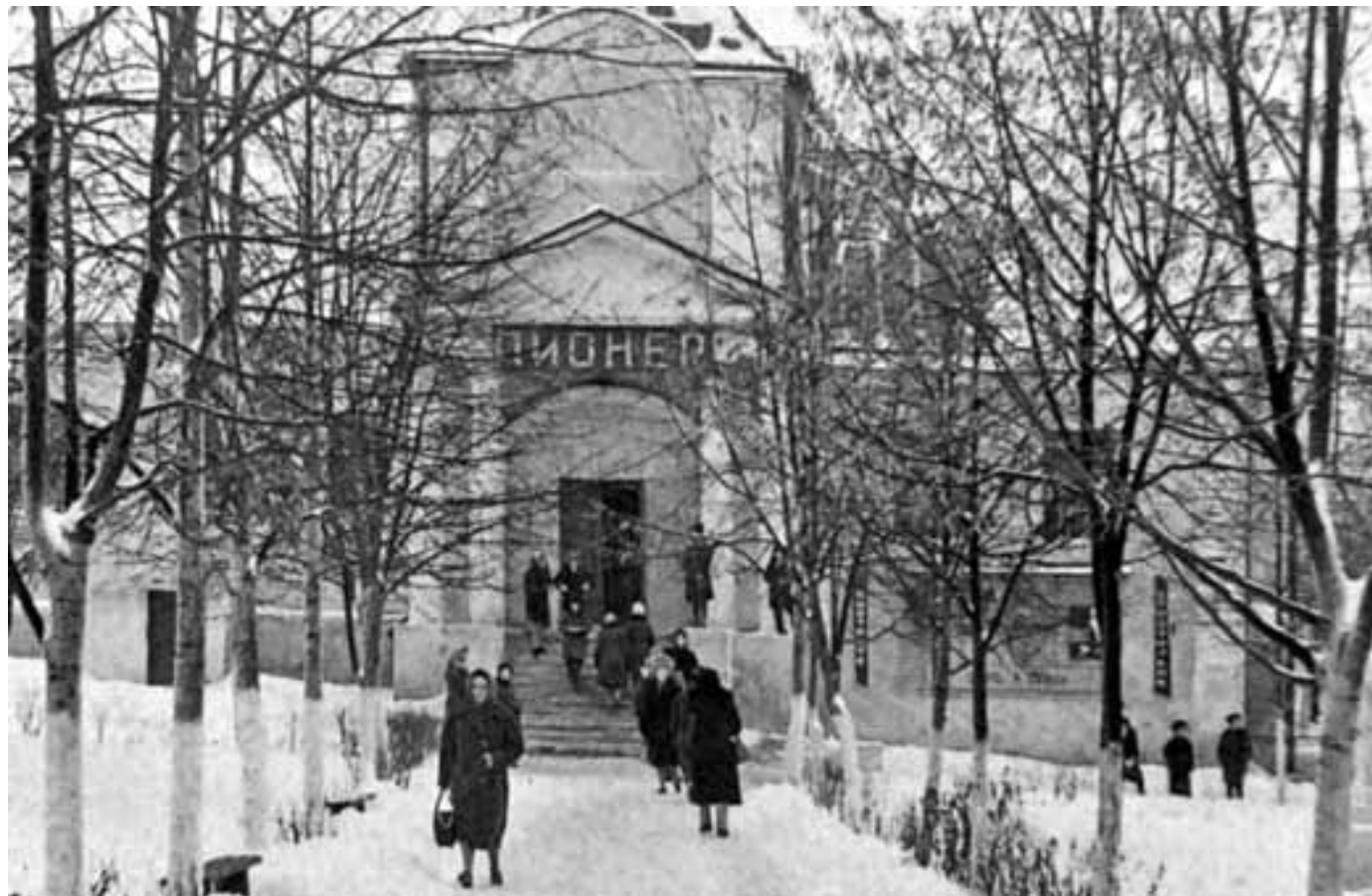
Храм в годы советской власти. Одна из иллюстраций книги

Любознательный читатель от главы к главе узнает все о любимом калужанами храме, получит ответы на многочисленные вопросы. Приглашаем всех присоединиться к путешествию, которое можно совершить, не выходя из дома и даже не вставая с любимого дивана или кресла. Отправная точка путешествия затерялась в глубине веков. Затерялась, но не пропала окончательно, поэтому маршрут, поэтапно проложенный от седой старины до сегодняшнего дня, позволит каждому осуществить передвижение во времени, которое обогатит его знаниями и поможет еще больше полюбить как православную Калугу, так и одну из ее святынь – храм в честь Рождества Пресвятой Богородицы (Никитский).