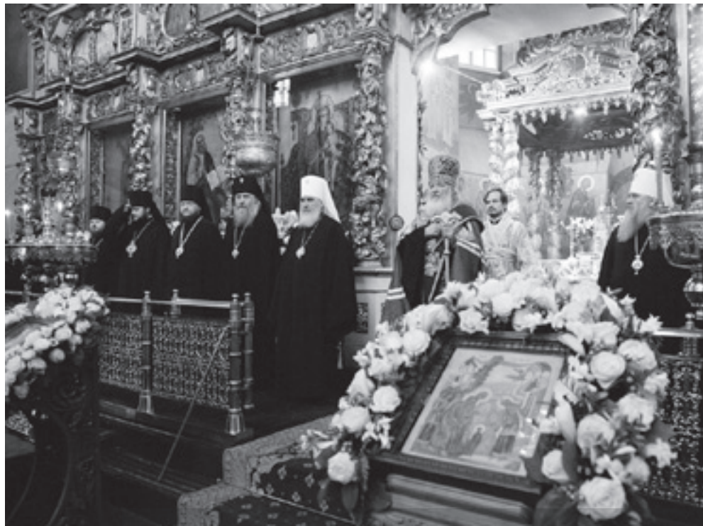
Богослужение в Донском ставропигиальном монастыре г. Москвы