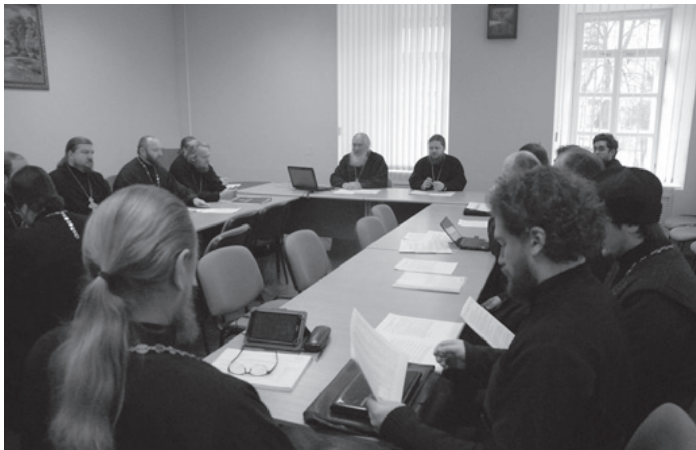
Заседание Епархиального совета с участием руководителей отделов и комиссий епархии