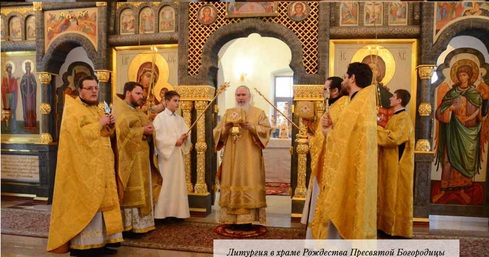
Литургия в храме Рождества Пресвятой Богородицы «на реке Калужке» – подворье Свято-Никольского Черно- островского Малоарсланецкого монастыря. Подробности на стр. 3