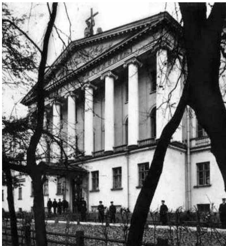
Санкт-Петербургская духовная академия. Начало XX века