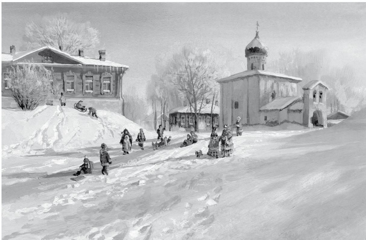
В. Жданов. Зима