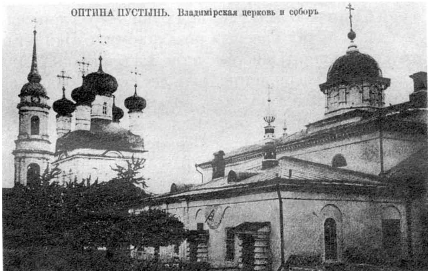
Владимирский храм и Введенский собор Оптиной пустыни, фото начала XX века.