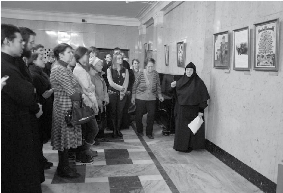
Открытие выставочного проекта, посвящённого 1000-летию русского присутствия на Афоне