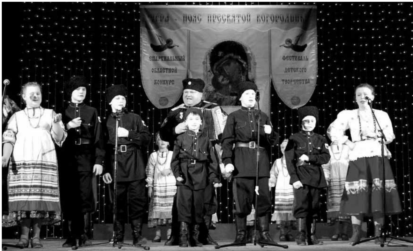
Заключительный концерт лауреатов 4-го межрегионального конкурса-фестиваля «Угра – пояс Пресвятой Богородицы»

По окончании литургии был совершен праздничный молебен Иоанну Златоустому, в завершение которого были провозглашены уставные мно-