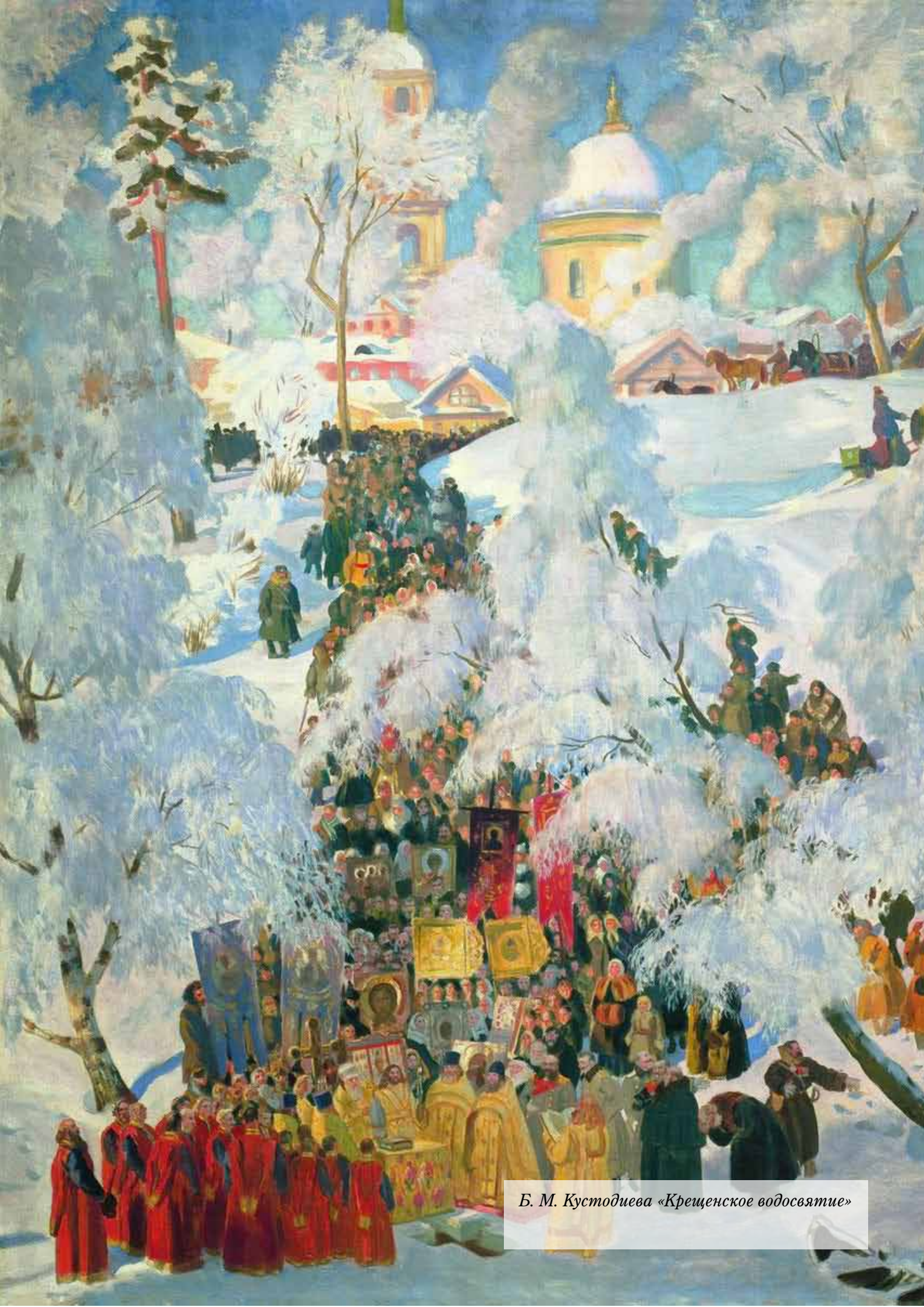
Б. М. Кустодиева «Крещенское водосвятие»