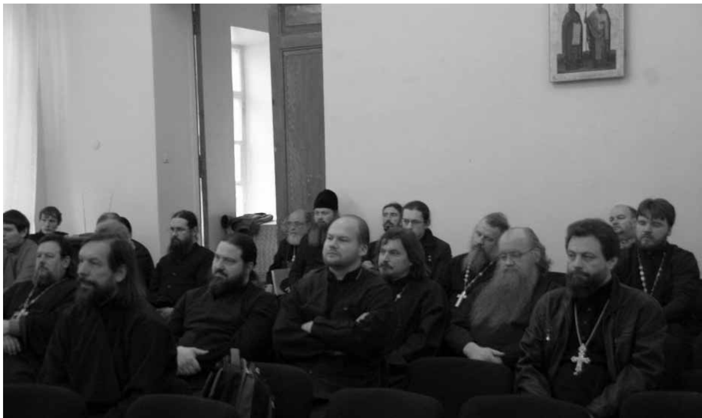
Пастырский семинар Калужской епархии, посвященный новомученикам Российским

Говорят, что панорама эпохи в первую очередь состоит из лиц. И это действительно так. Если мы посмотрим на фотографии священнослужителей и мирян, то с одного взгляда определим, где фотографии, сделанные до революции, а где – в годы репрессий. На первых мы видим добрых пастырей. На вторых – изможденных физически, но не сломленных духом заключенных. Это бесценные свидетельства, наглядно показывающие нам истинное положение дел, особенности подвига святых XX века. Рассказы о пострадавших за Христа, выставки фотографий, периодики и литературы на эту тему всегда сопровождают встречи лектория «Россия в XX веке». Лекторий позволяет калужанам знакомиться с самыми последними исследованиями о святых XX века, новыми сведениями о подвиге калужских новомучеников. Это возможность узнать больше о тех, кто мужественно претерпел все страдания и самую смерть за веру Христову и за Православие. Время идет, но память о тех, кто ценою своей жизни спас Православие на Святой Руси, не будет утрачена.